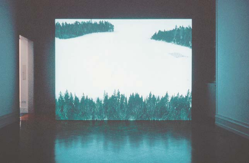
Mark Lewis, Algonquin Park, Early March , 2002, film 35 mm couleur transféré sur DVD, 4 min. Vue de l'installation à la Kunsthalle Bern, Allemagne.