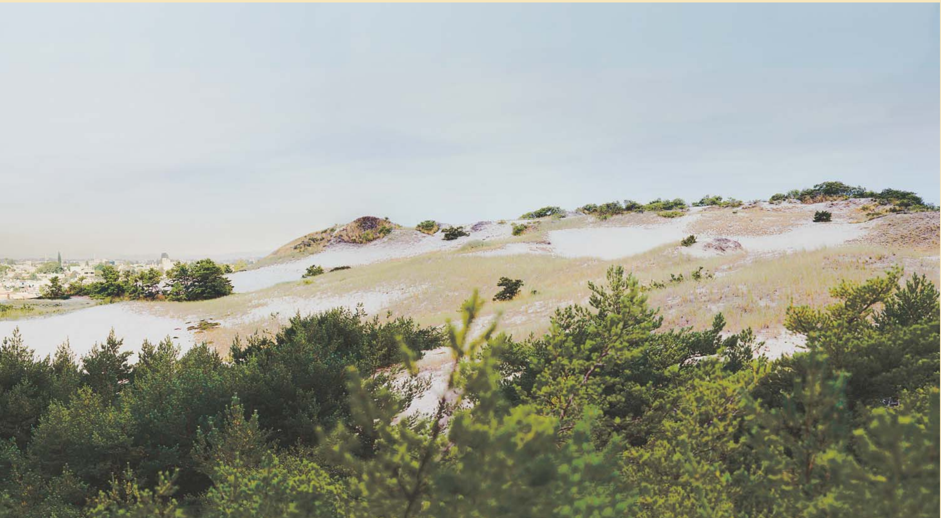
Isabelle Hayeur, Élévation , 2004, épreuve numérique, 97 x 348 cm.

Isabelle Hayeur lives and works in Montreal. Since the late 1990s, she has been known for her video production and large-format digital montages. Both appealing and alarming, her works present vast panoramic landscapes that denounce the no-man's-lands that modern and contemporary civilizations allow to emerge. Her digital images have been presented in solo exhibitions in Quebec and Canada as well as in a number of group exhibitions: Lieux anthropiques, presented by VOX at the Centro Cultural Casa Vallarta, Guadalajara, Mexico, and Tomorrow's New at the Hippolyte Gallery, Helsinki, Finland, in 2003; Chantiers at Centre des arts actuels Skol, and Plan Large at Quartier éphémère as part of Mois de la Photo à Montréal, in 2001. Her participation in this last event attracted much attention and earned her the Prix Contact for young artists. Selected for showing at international festivals, her videos circulate throughout the world.