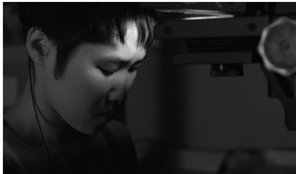
Nước dir. Quyên Nguyen-Le, 2016.