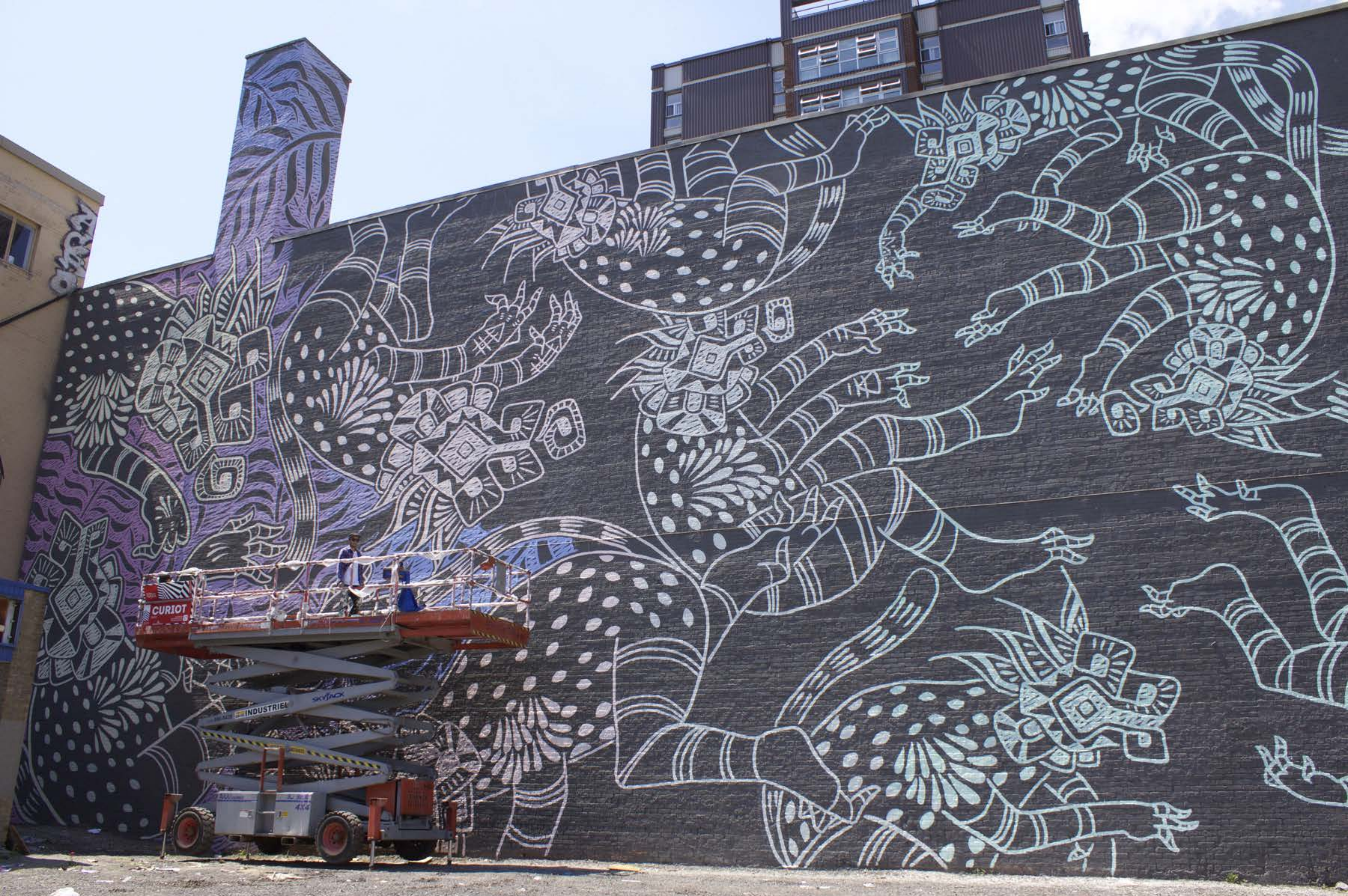
Curriot, Mexique, 2015 Emplacement / Location : Sherbrooke / Jeanne-Mance