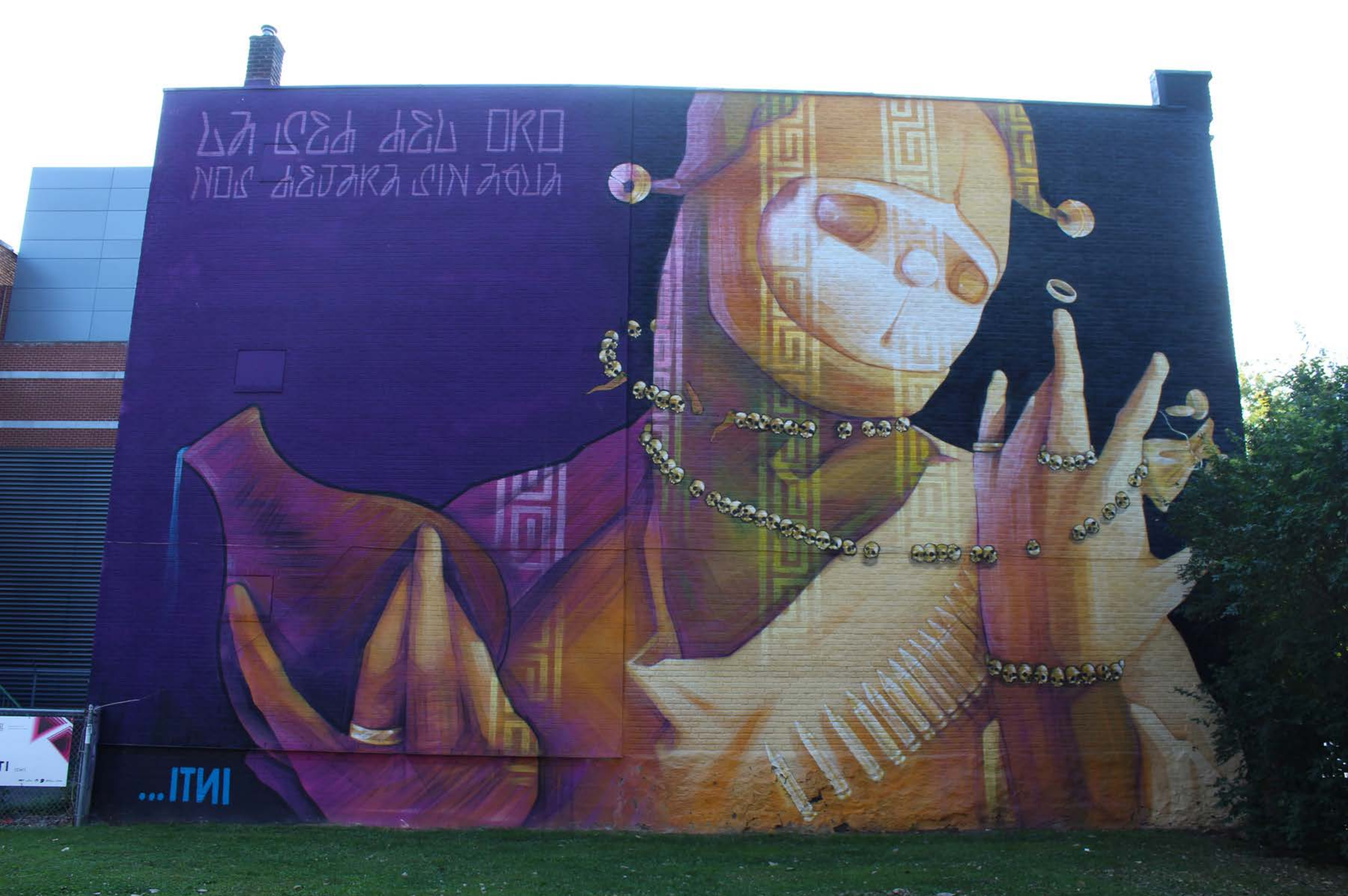
Inti, Chili, 2014 Emplacement / Location : Saint-Laurent / Prince-Arthur