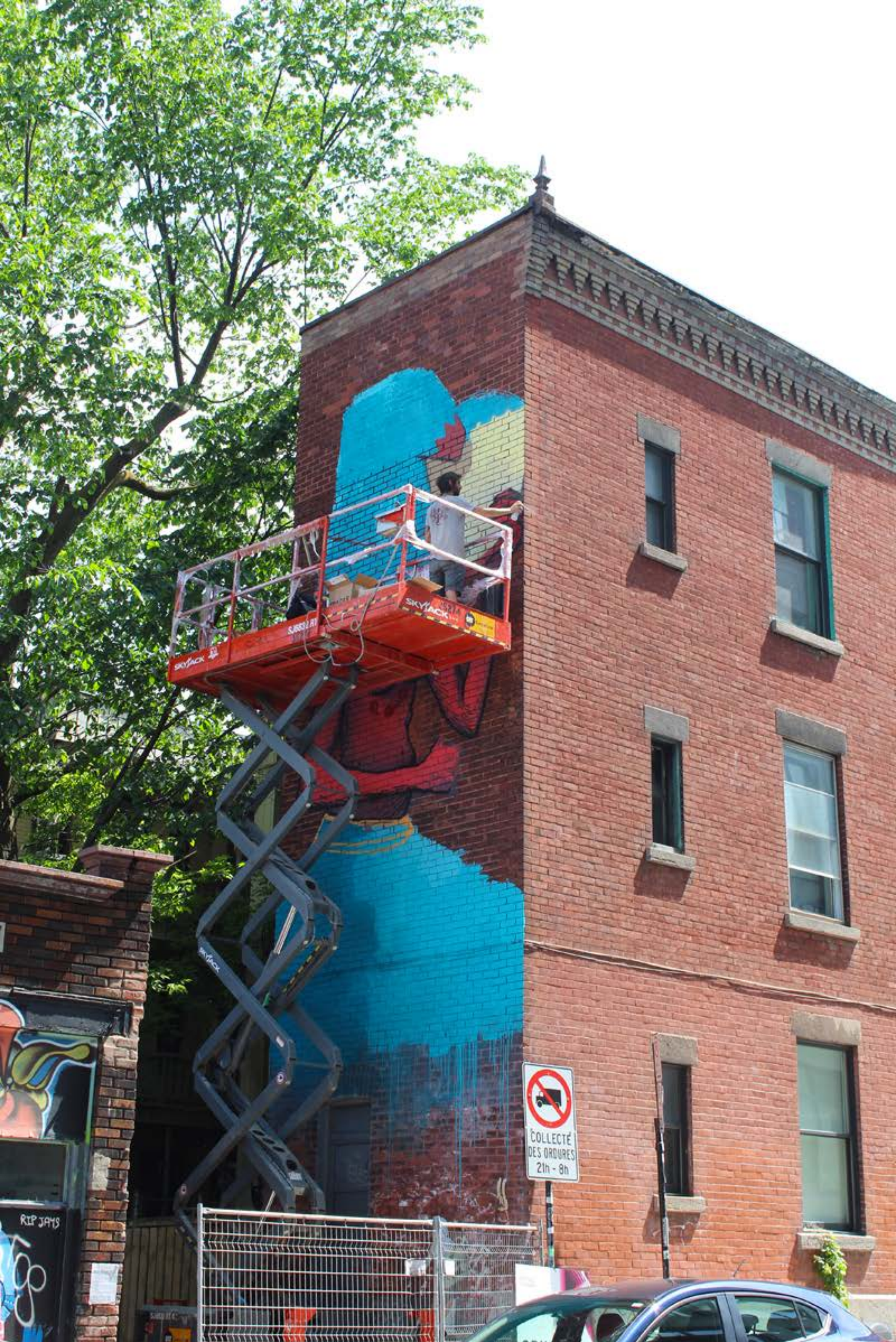
Sbu One, Canada, 2017 Emplacement / Location : Duluth / Clark