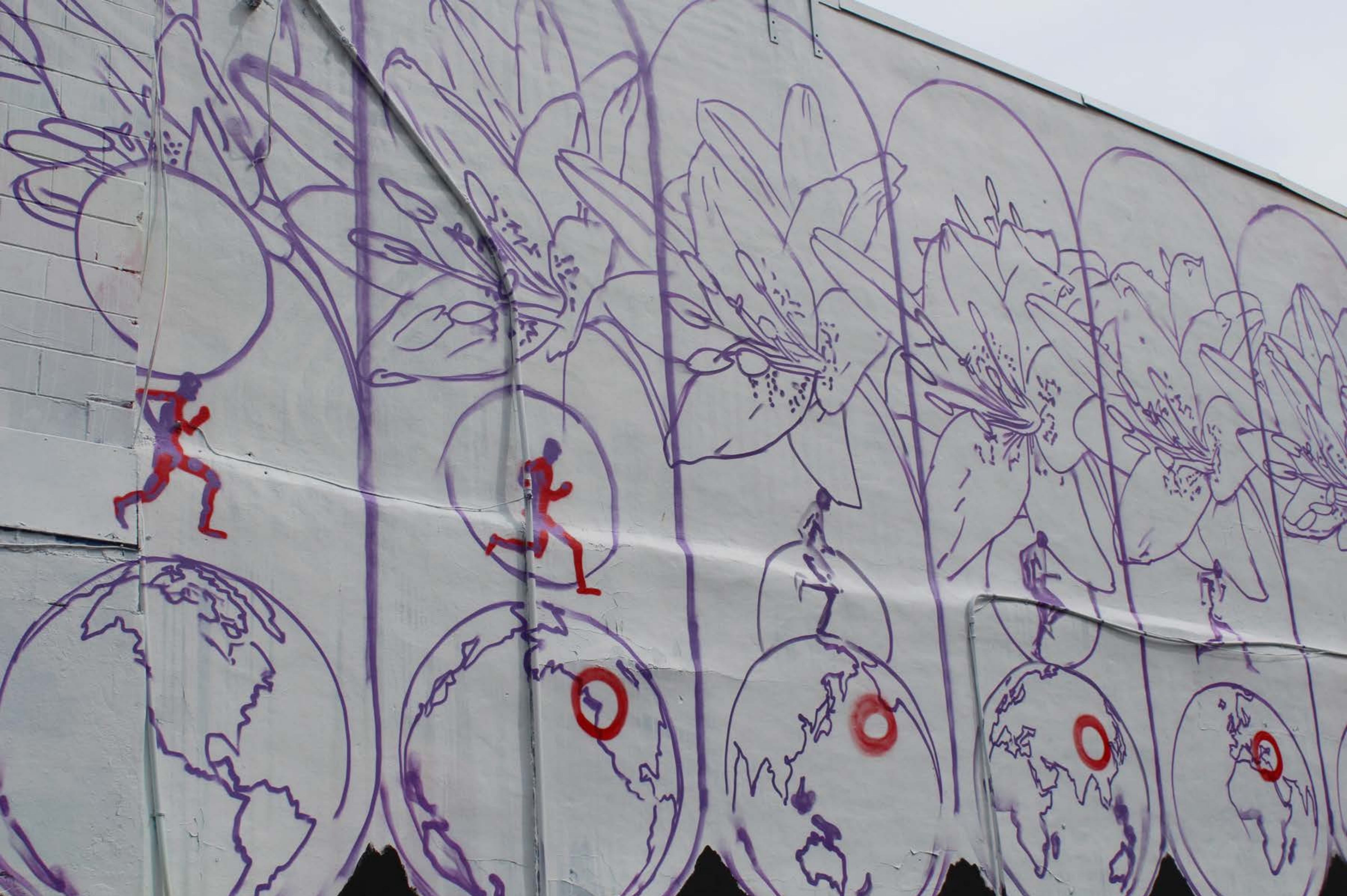
Insa, Angleterre, 2017