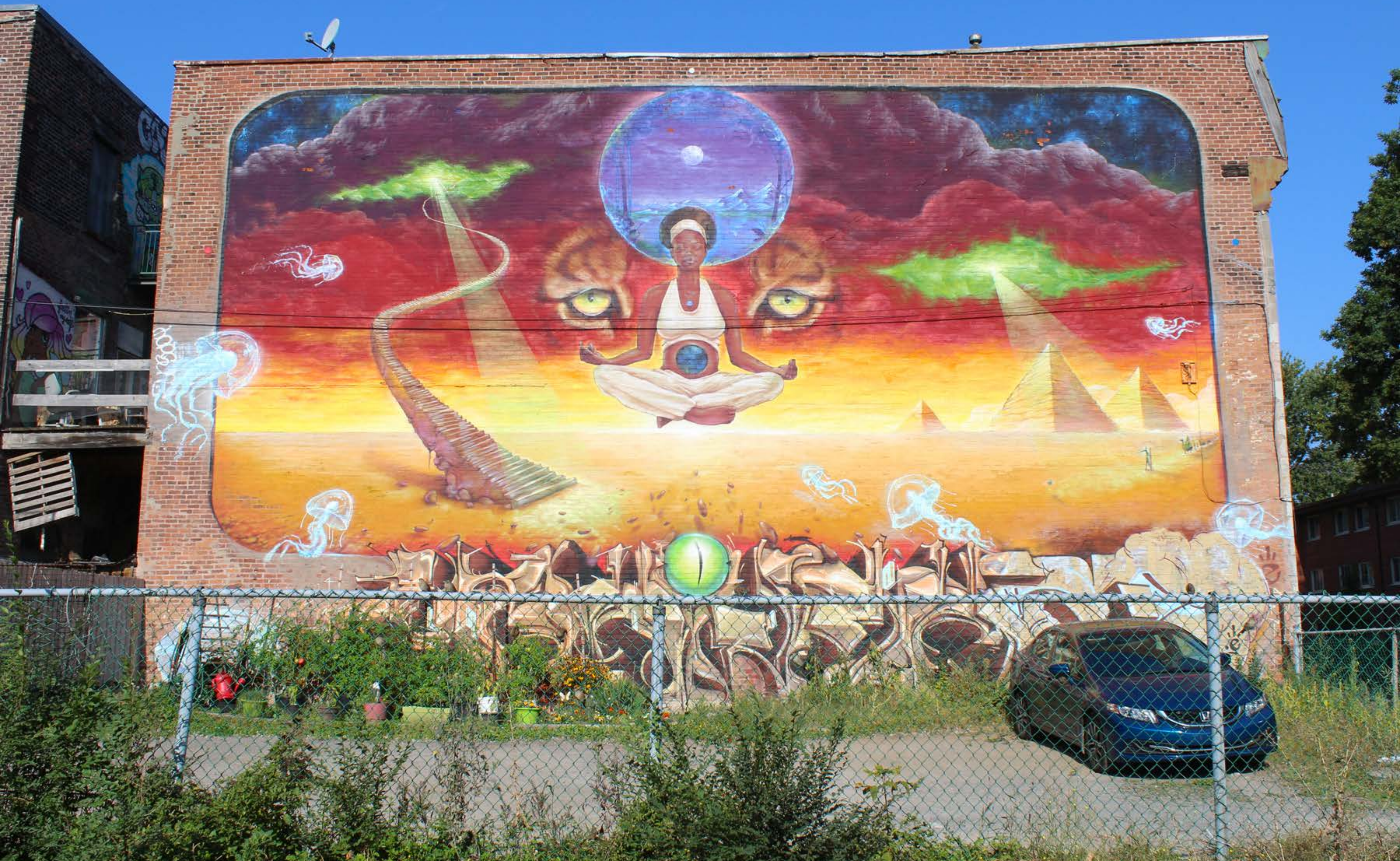
Monk E, Canada, 2015

Emplacement / Location : Saint-Dominique / de Maisonneuve