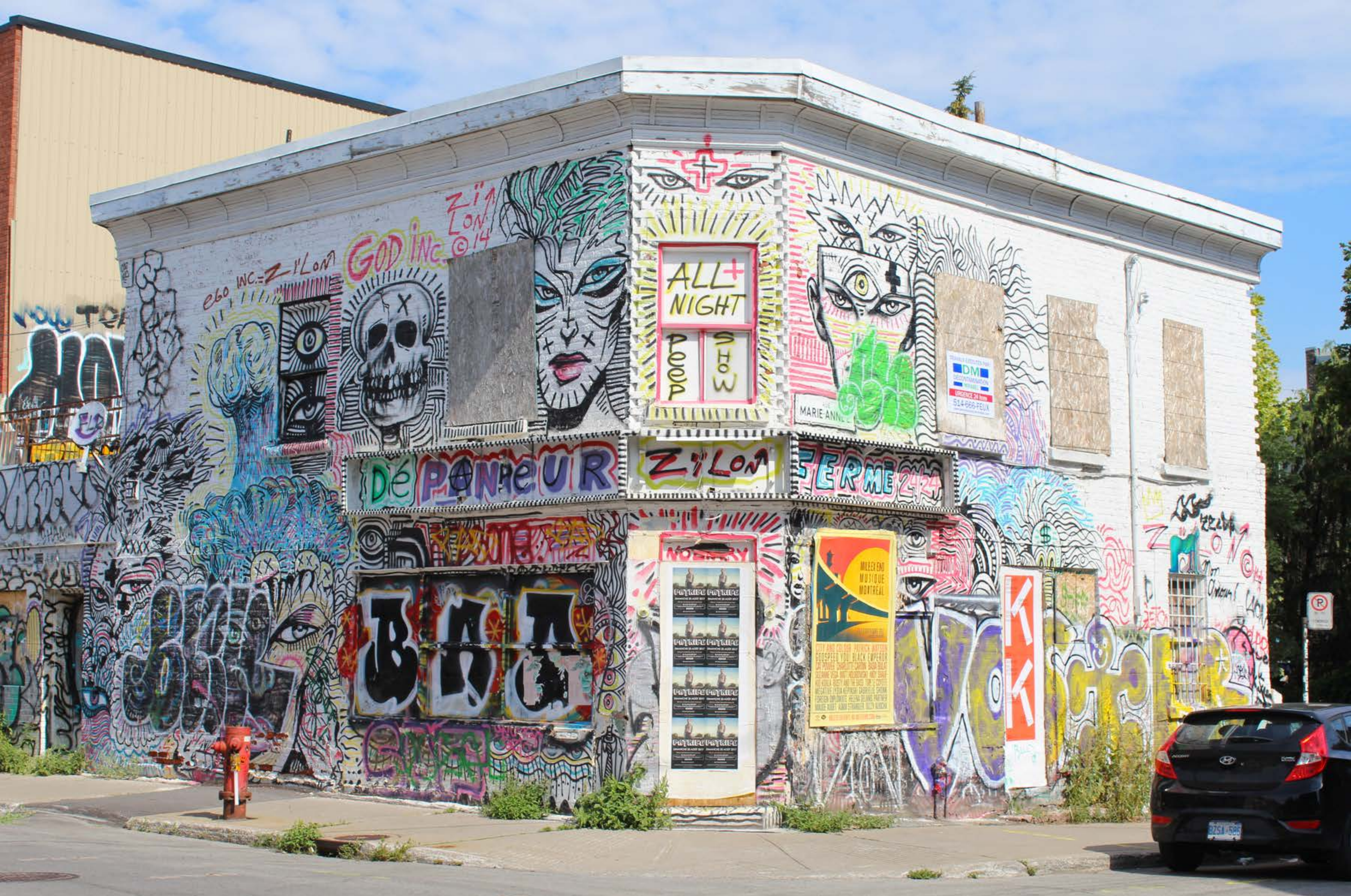
Zilon, Canada, 2014 Emplacement / Location : Saint-Dominique / Marie-Anne