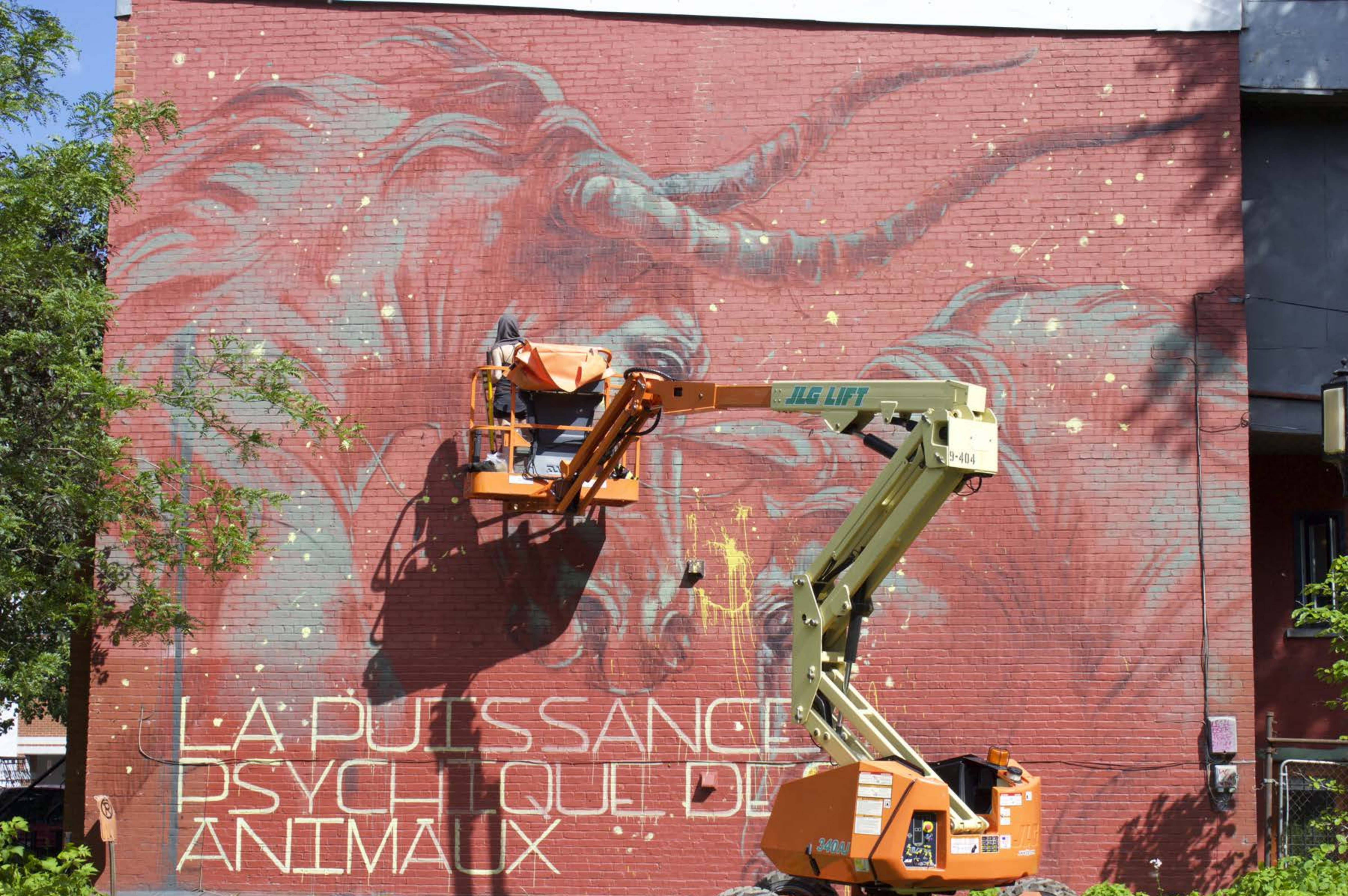
Faith 47, Afrique du Sud, 2015 Emplacement / Location : Prince-Arthur / Clark