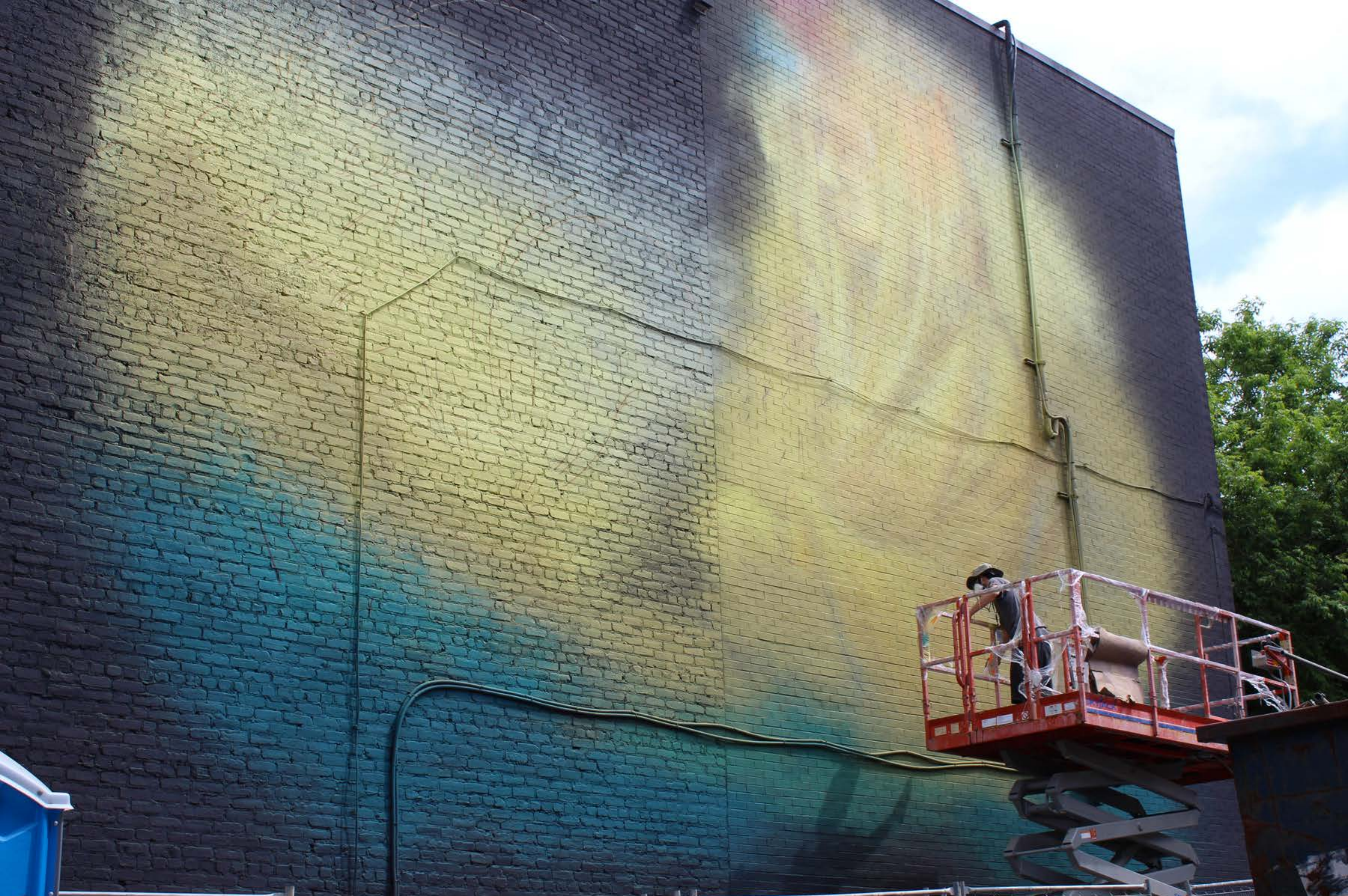
Scribe CSX, Canada, 2017 Emplacement / Location : Saint-Laurent / Saint-Cuthbert