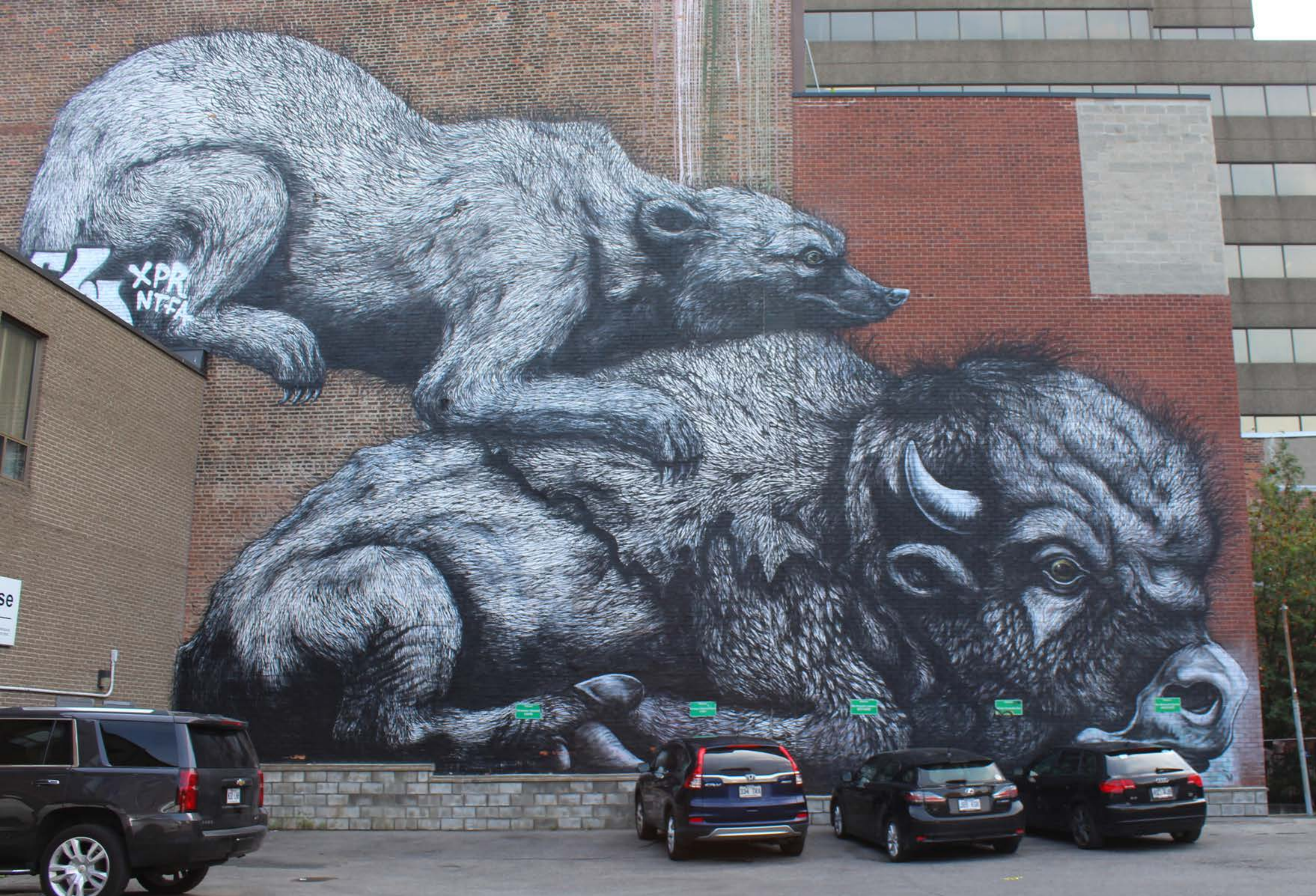
Roa, Belgique, 2013 Emplacement / Location : Clark, entre Marie-Anne et Rachel