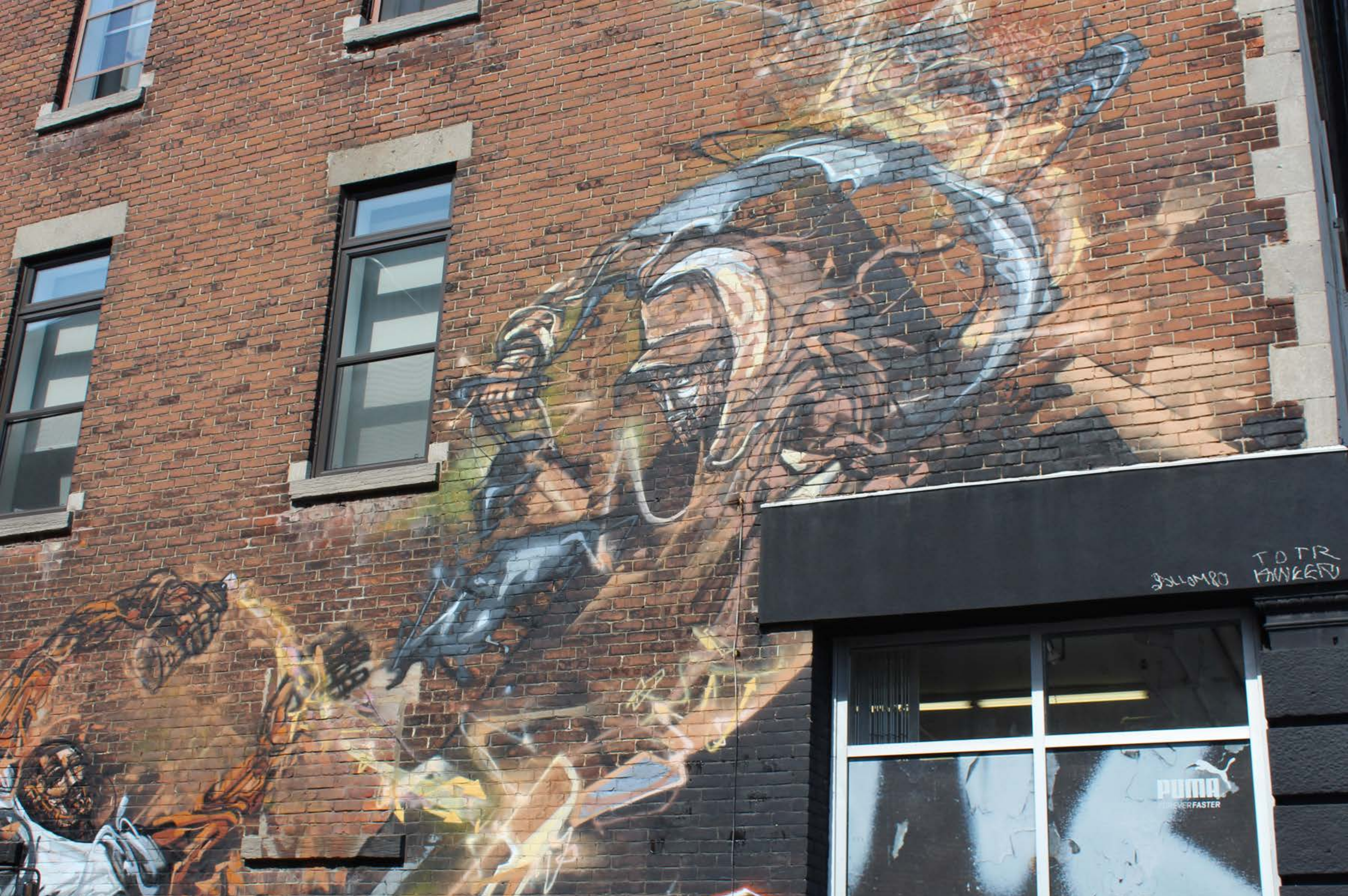
Stare & Tchug, Canada, 2013 Emplacement / Location : Marie-Anne / Saint-Laurent