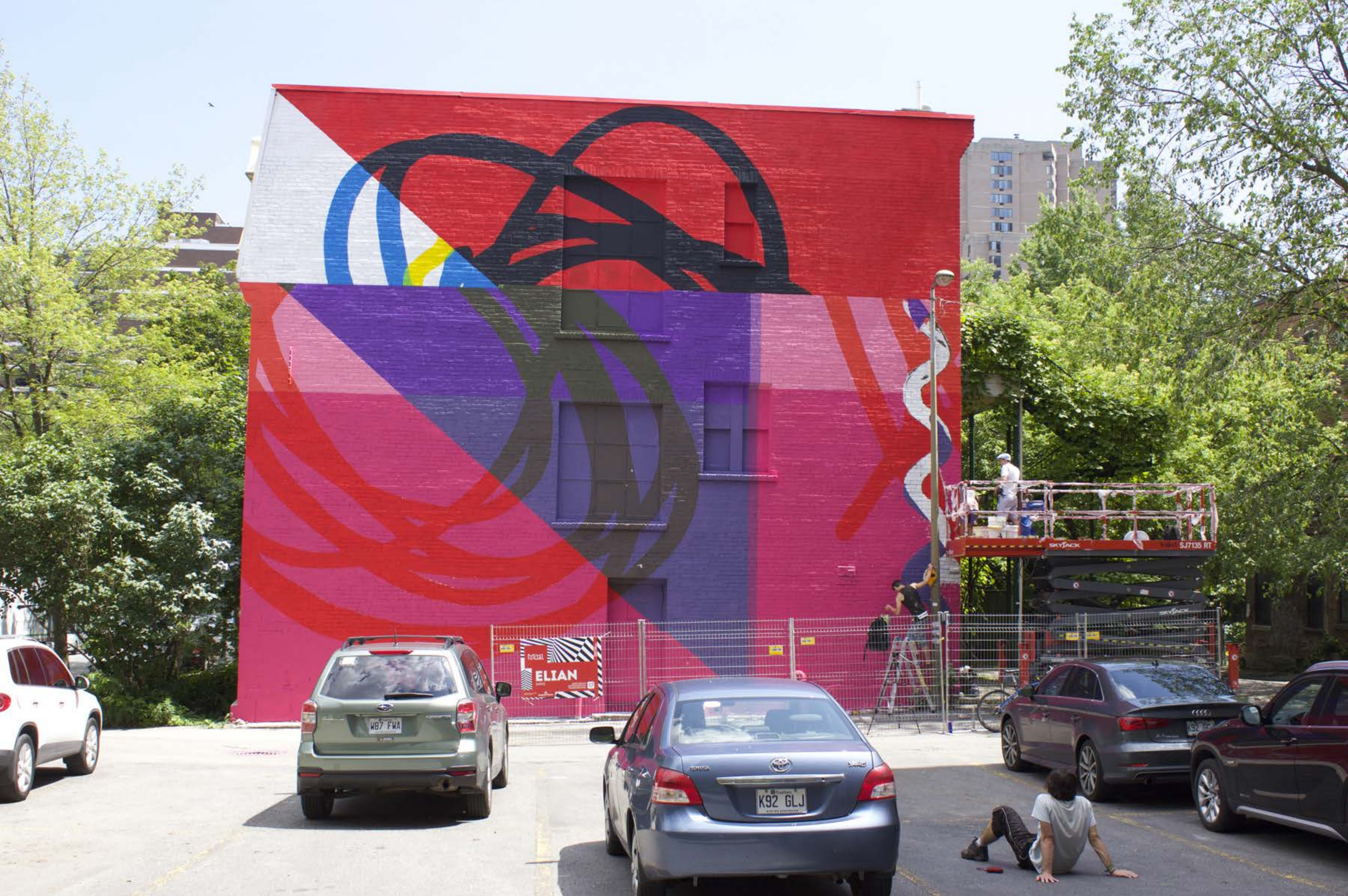
Elian Chali, Argentine, 2015 Emplacement / Location : Sainte-Famille / Basset