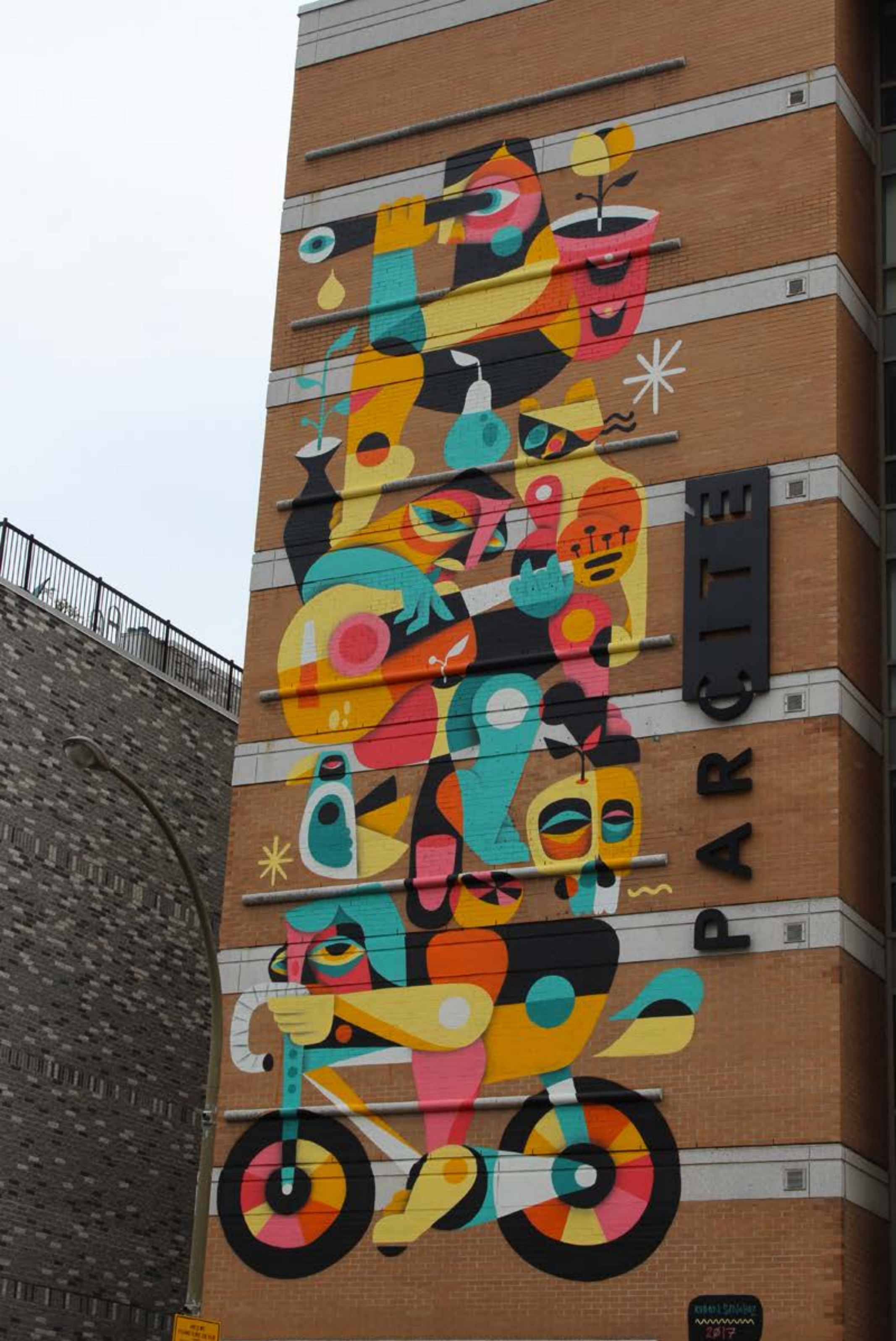
Ruben Sanchez, Espagne, 2017 Emplacement / Location : Parc / Sherbrooke Toujours visible : OUI (Été 2017)