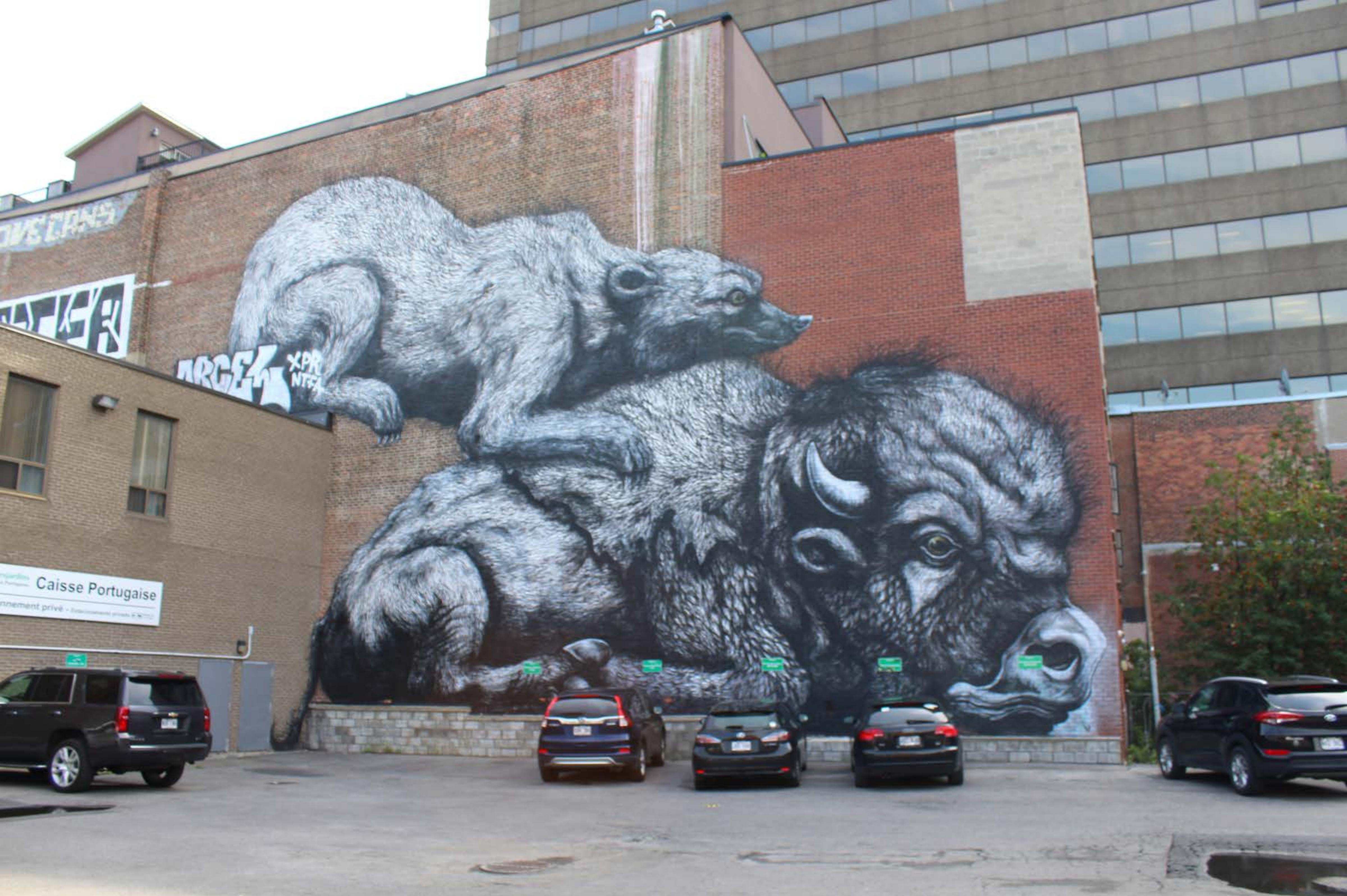
Roa, Belgique, 2013 Emplacement / Location : Clark, entre Marie-Anne et Rachel