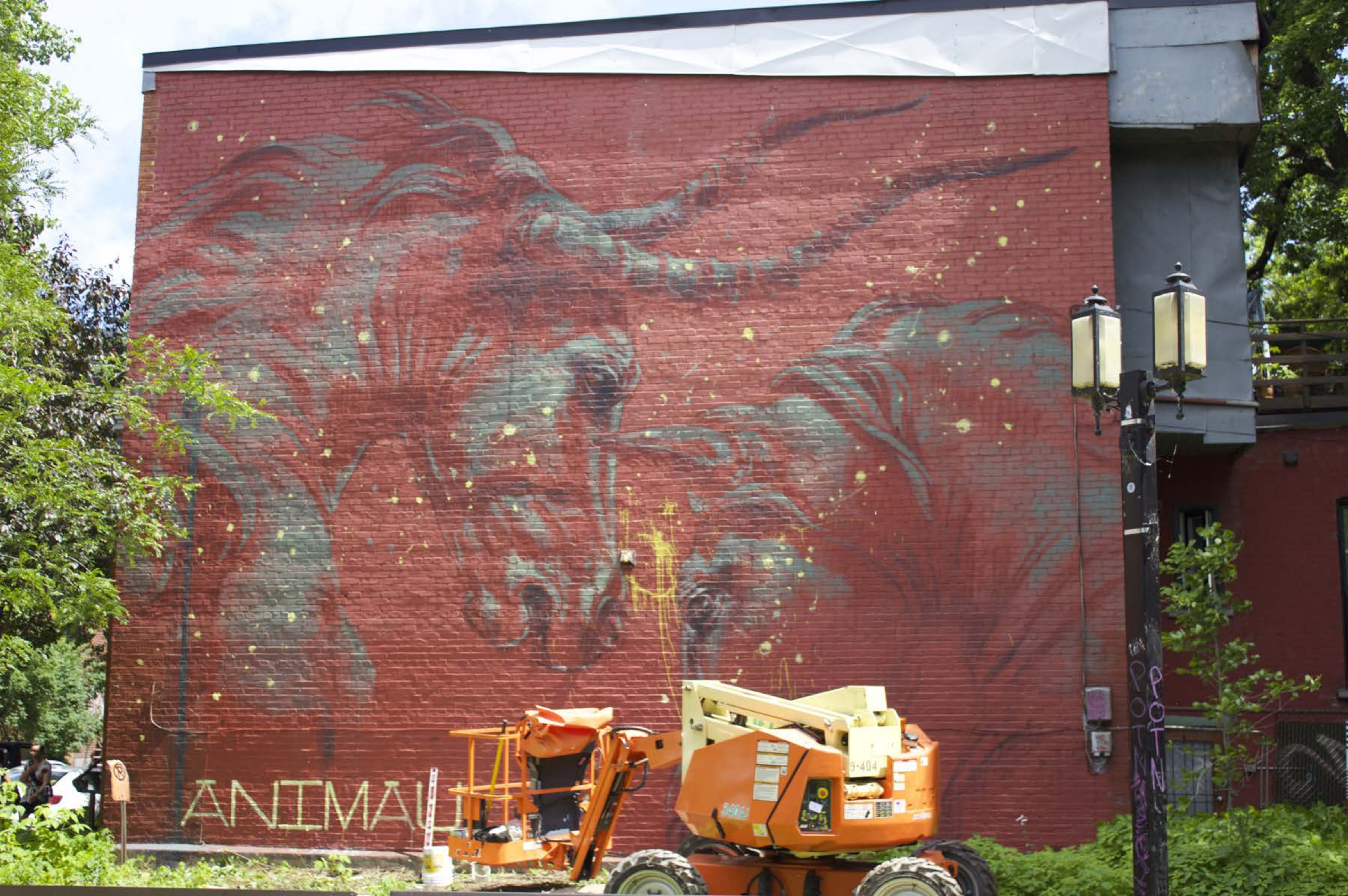
Faith 47, Afrique du Sud, 2015 Emplacement / Location : Prince-Arthur / Clark