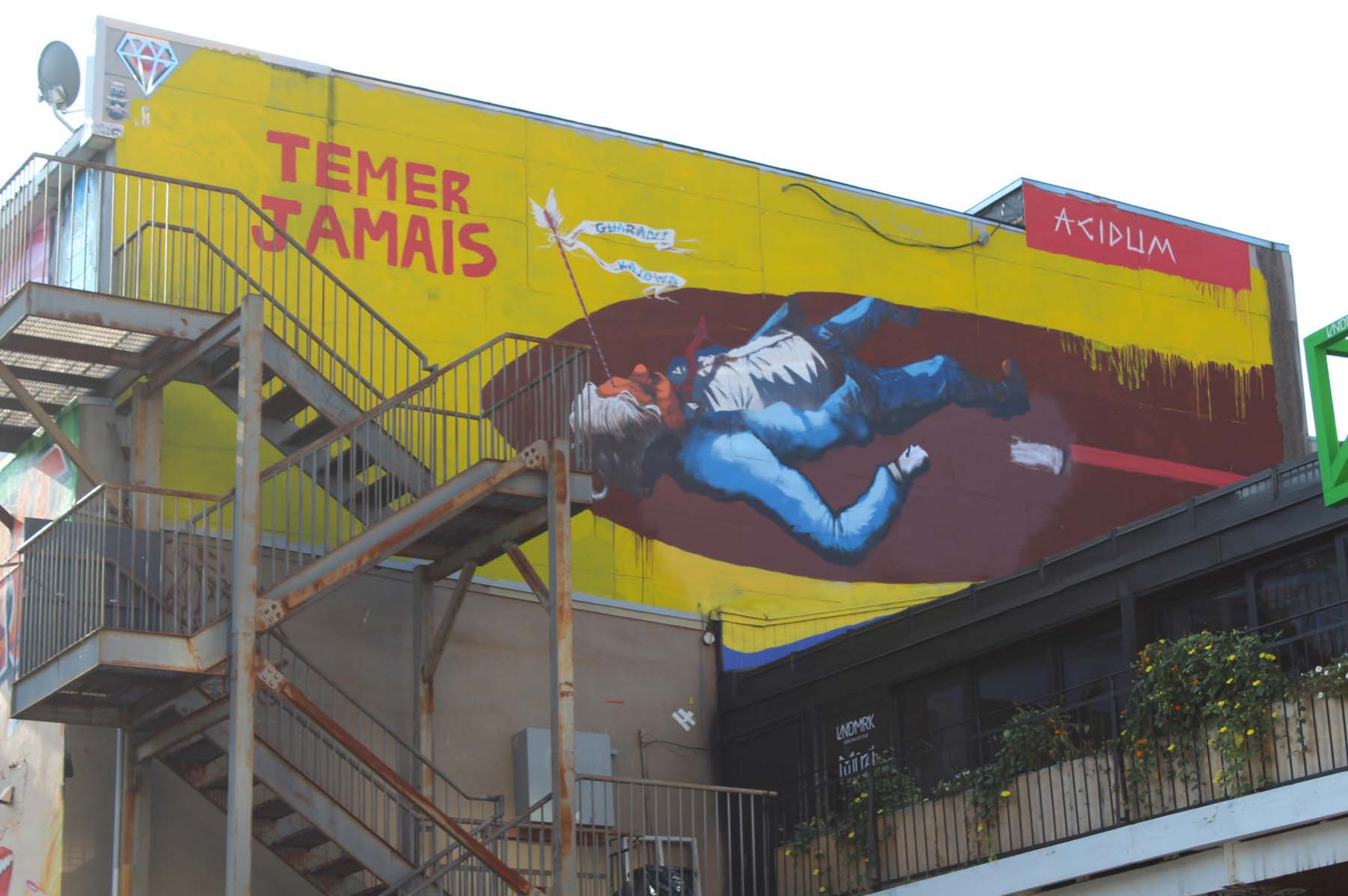
Acidum Project, Brésil, 2016 Emplacement / Location : Saint-Laurent, entre Prince-Arthur et Milton