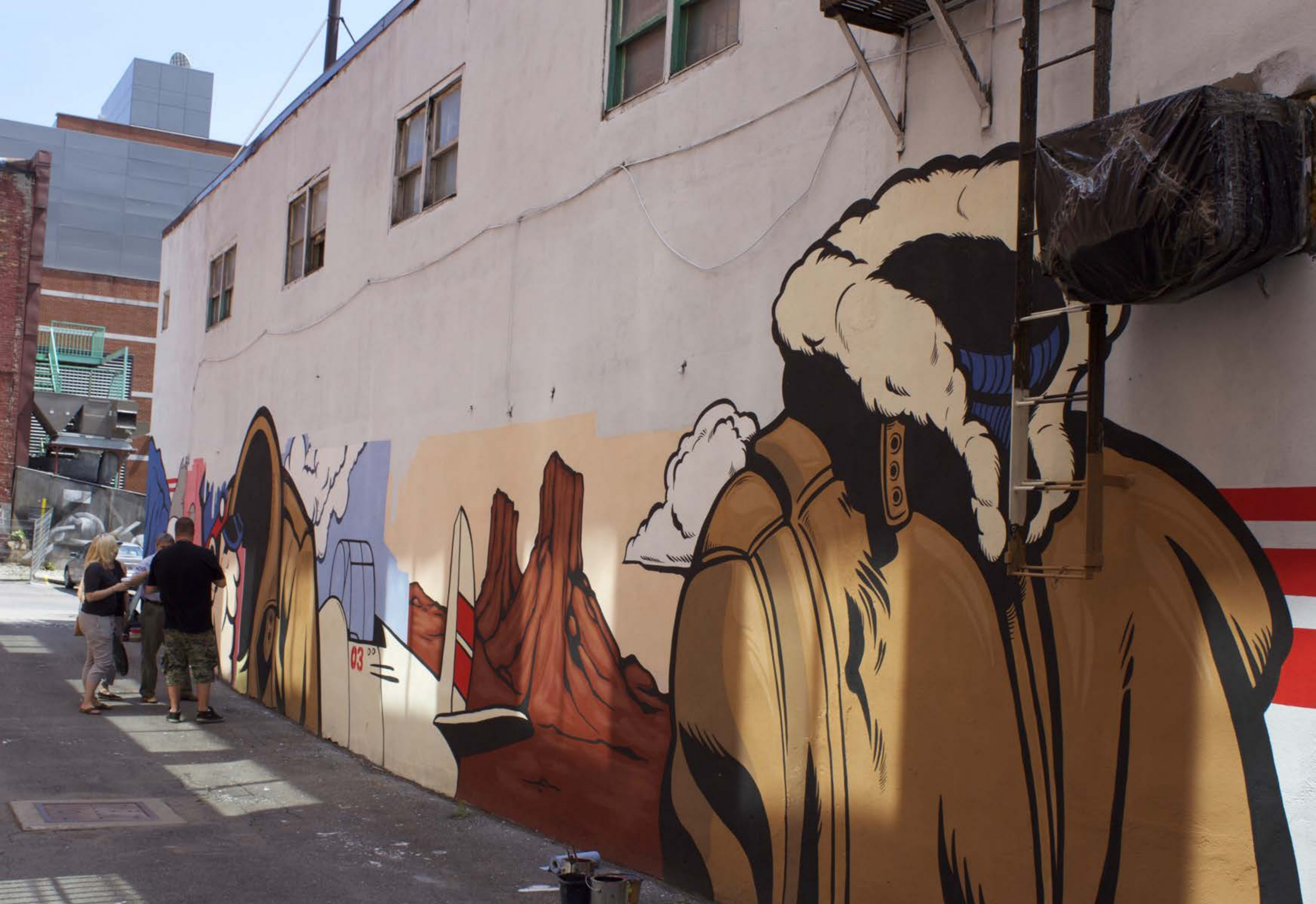
Éric Clément, Canada, 2015 Emplacement / Location : Ruelle (Saint-Laurent / Prince-Arthur)