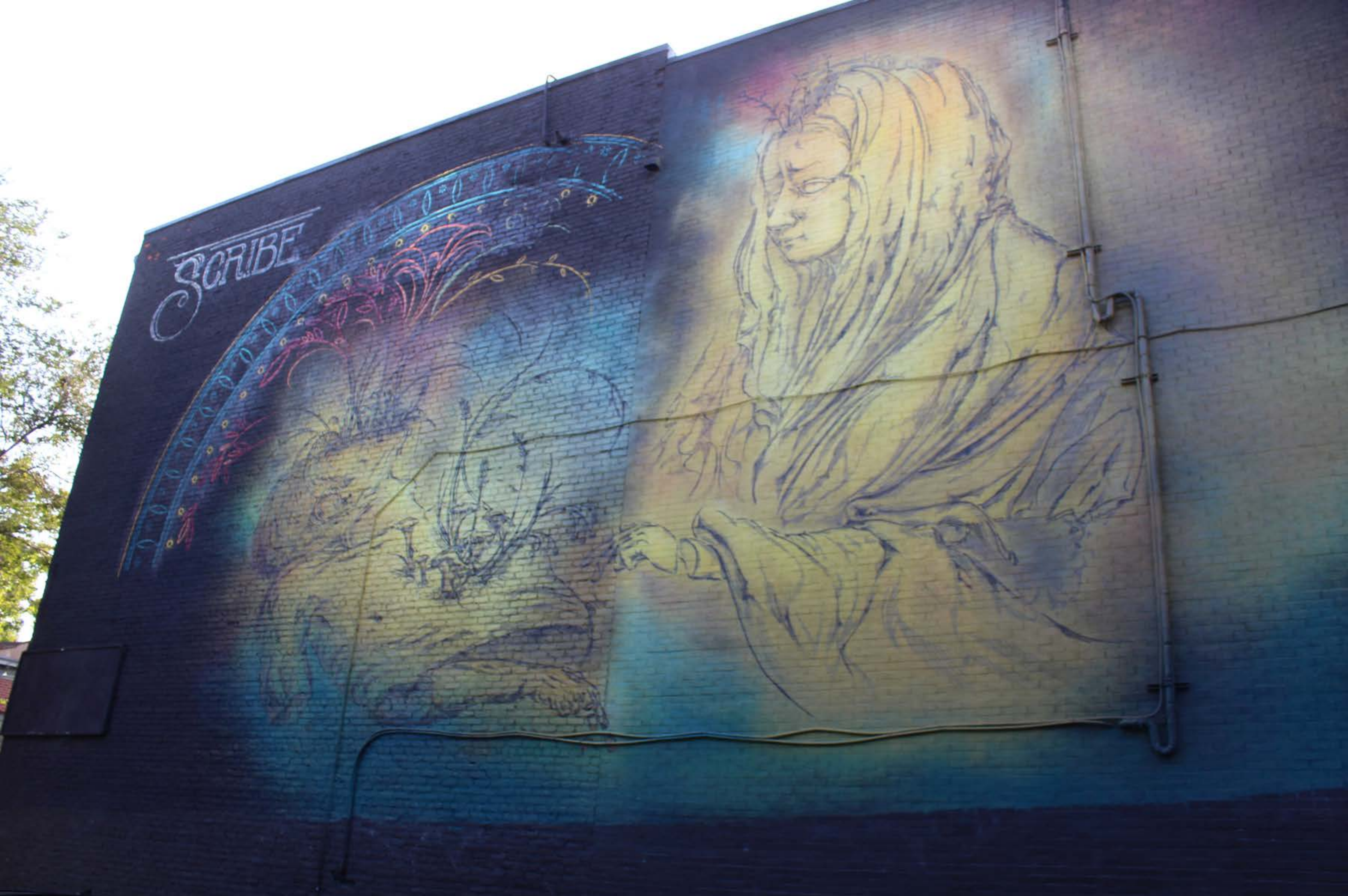
Scribe CSX, Canada, 2017