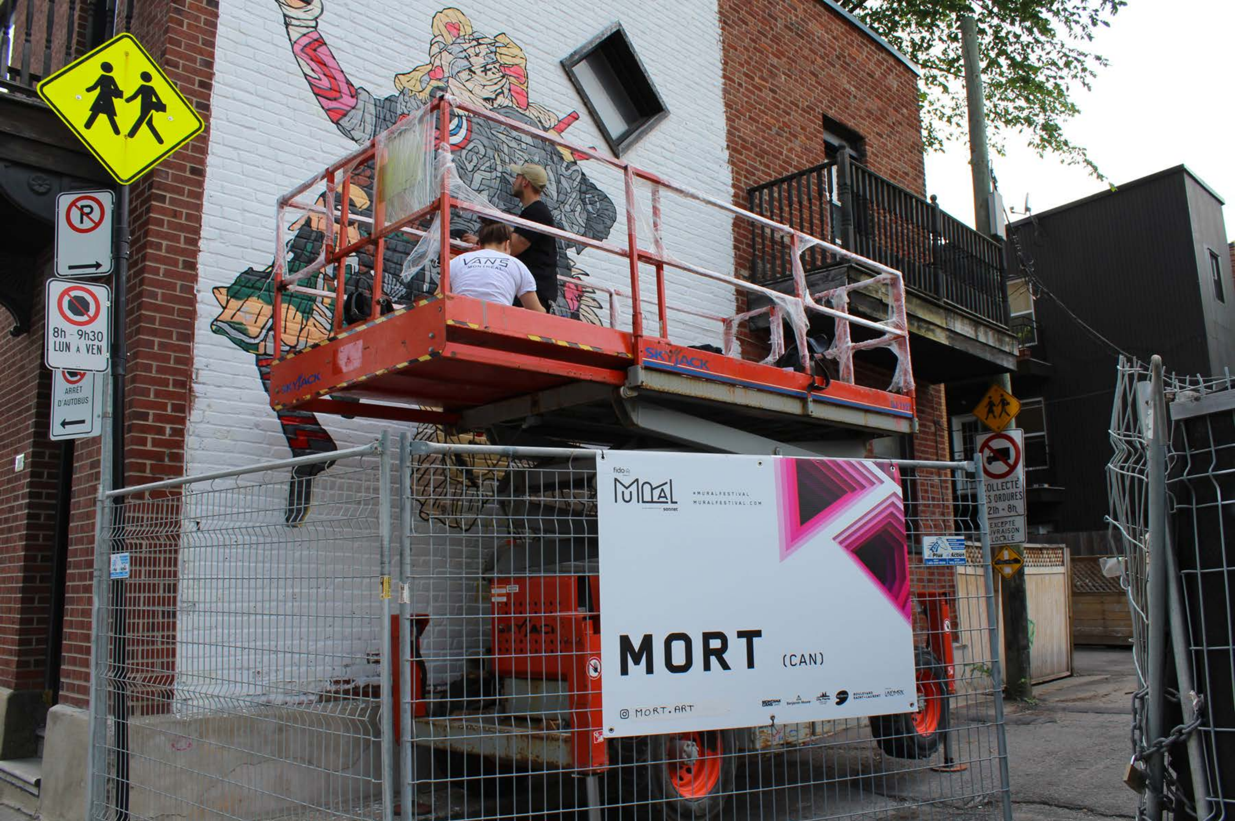
Mort, Canada, 2017