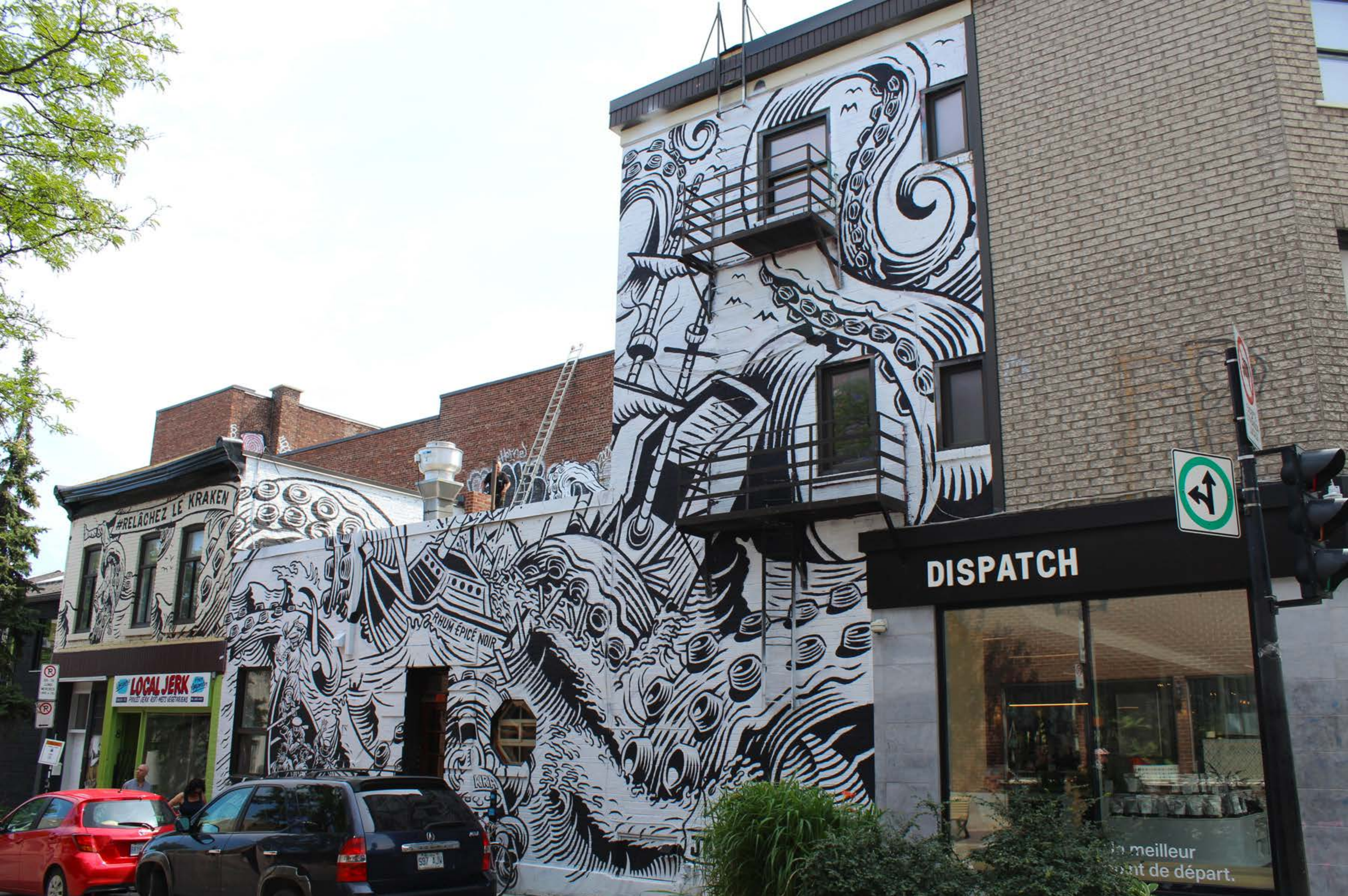
Jason Wasserman, Canada, 2017 Emplacement / Location : Duluth / Saint-Laurent