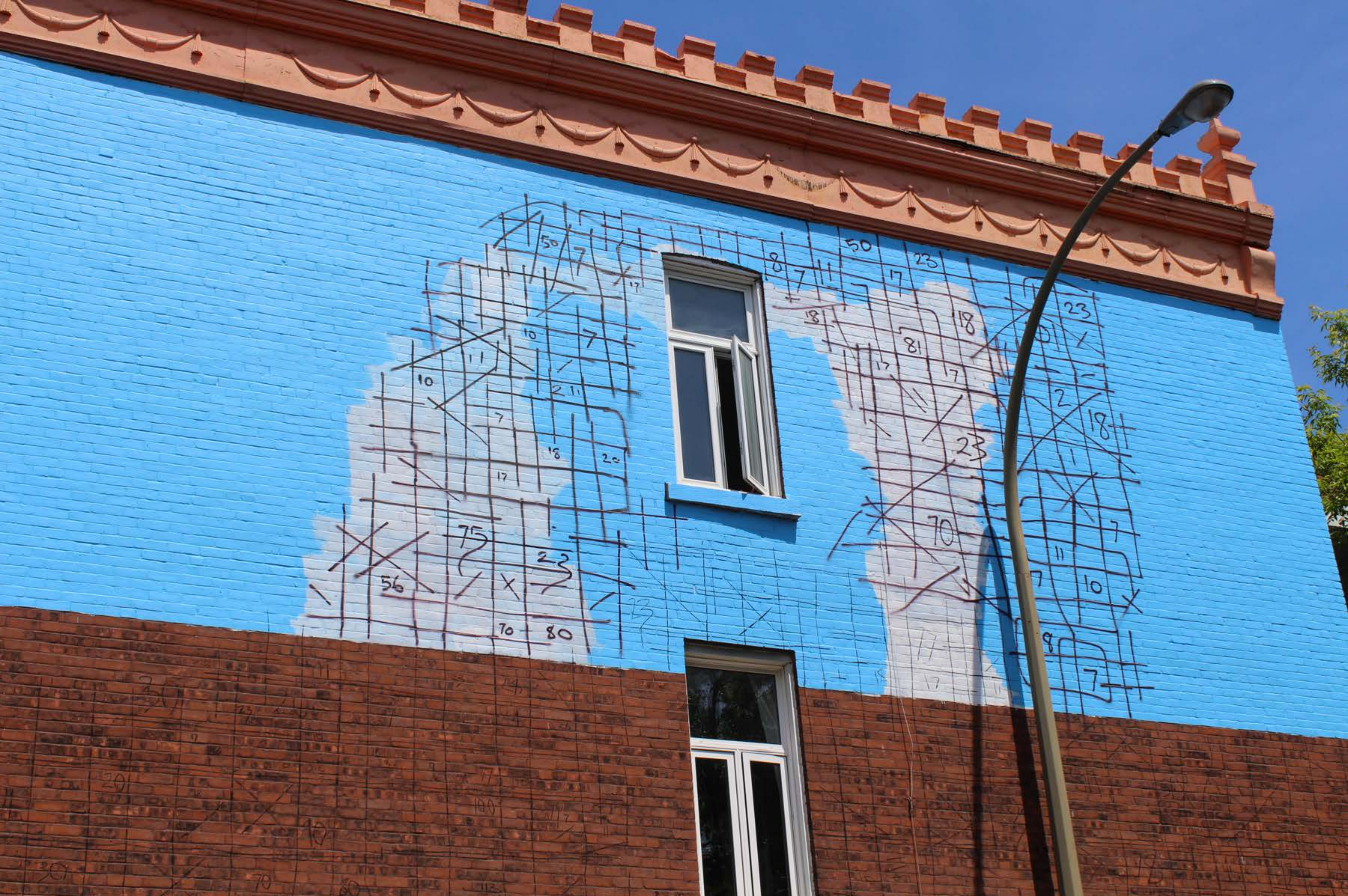
Fintan Magee, Australie, 2017 Emplacement / Location : Hotel-de-Ville / Av. des Pins