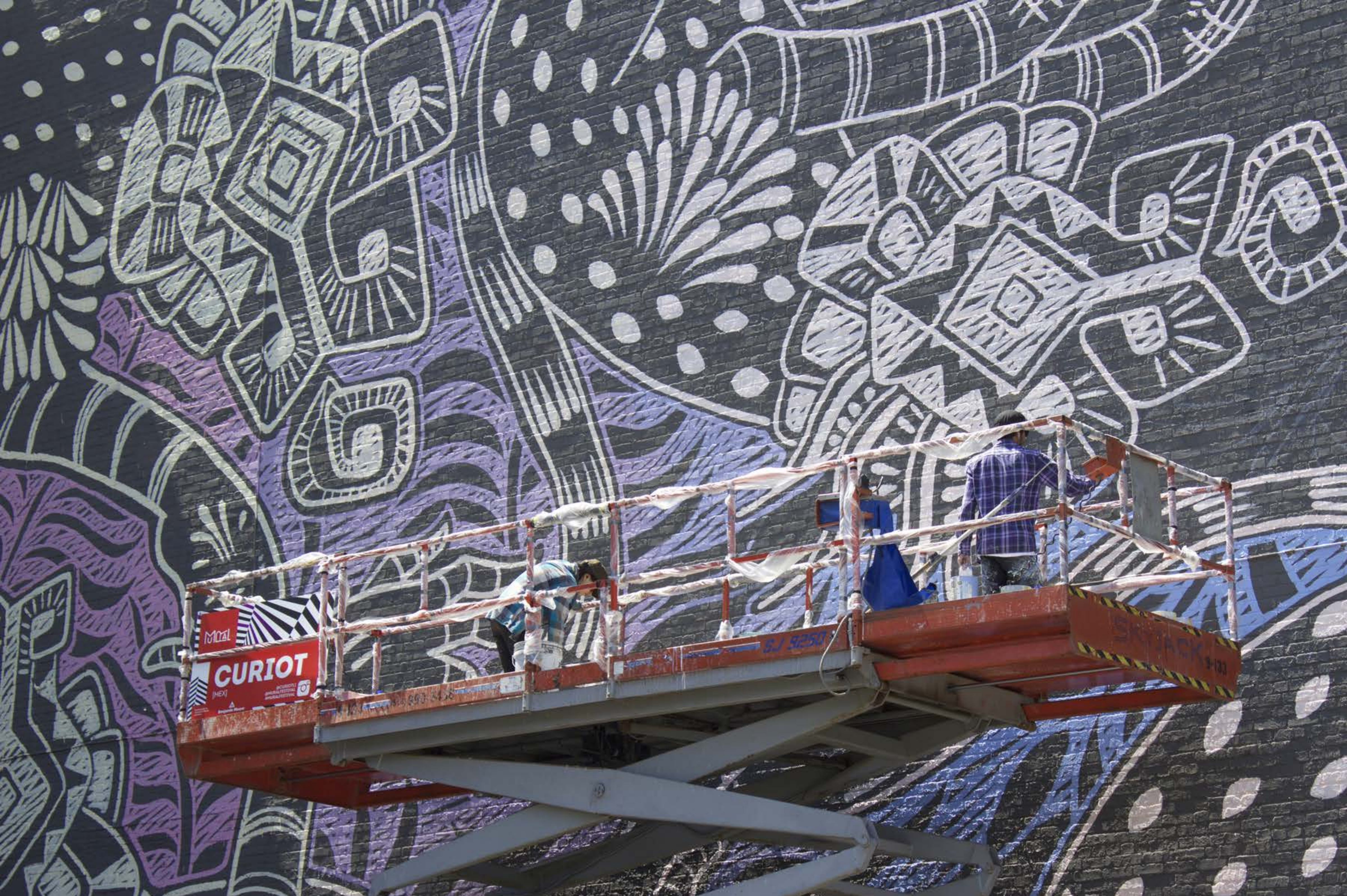
Curiot, Mexique, 2015 Emplacement / Location : Sherbrooke / Jeanne-Mance