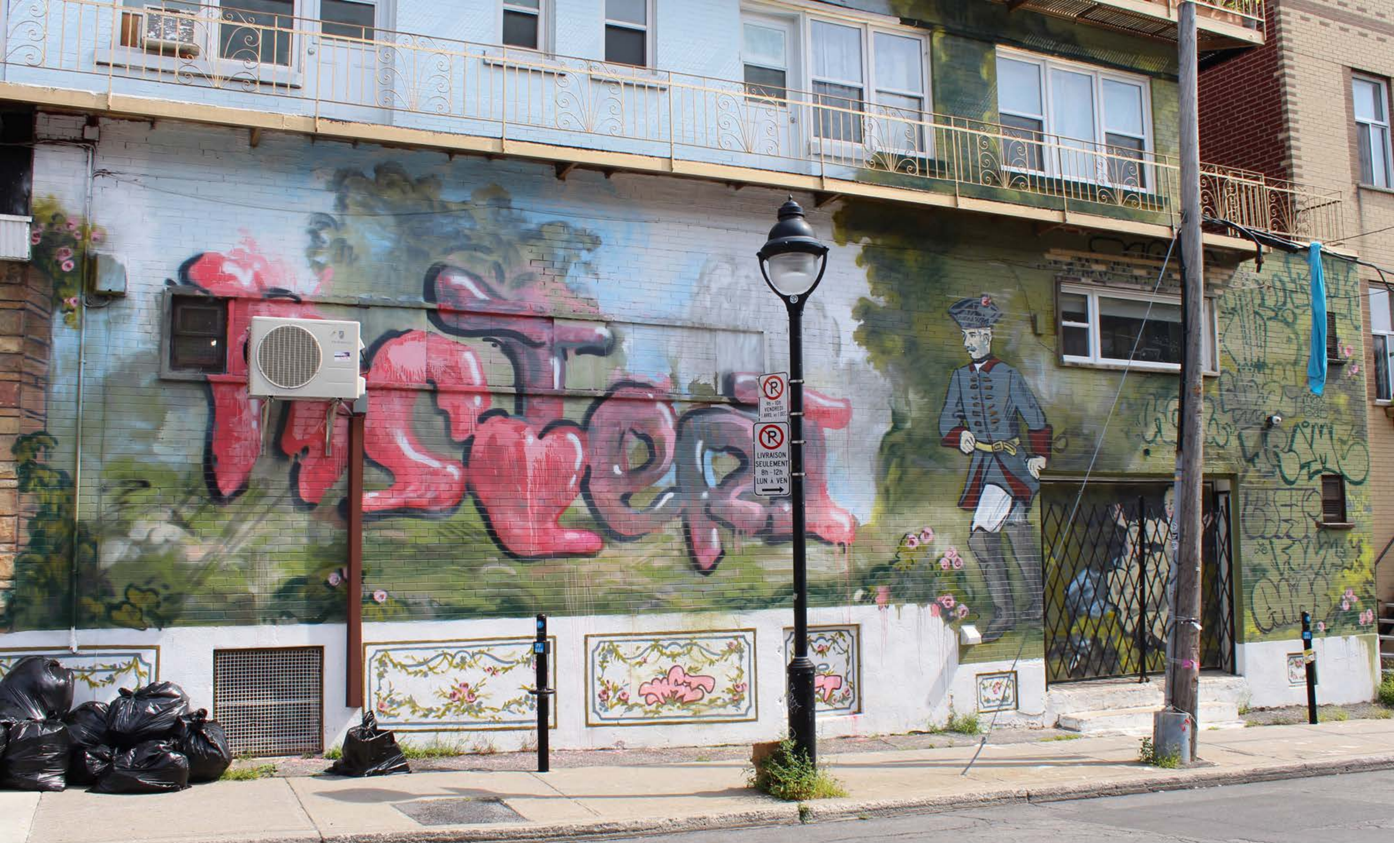
Miss Teri, Canada, 2016 Emplacement / Location : Hotel-de-Ville / Rachel