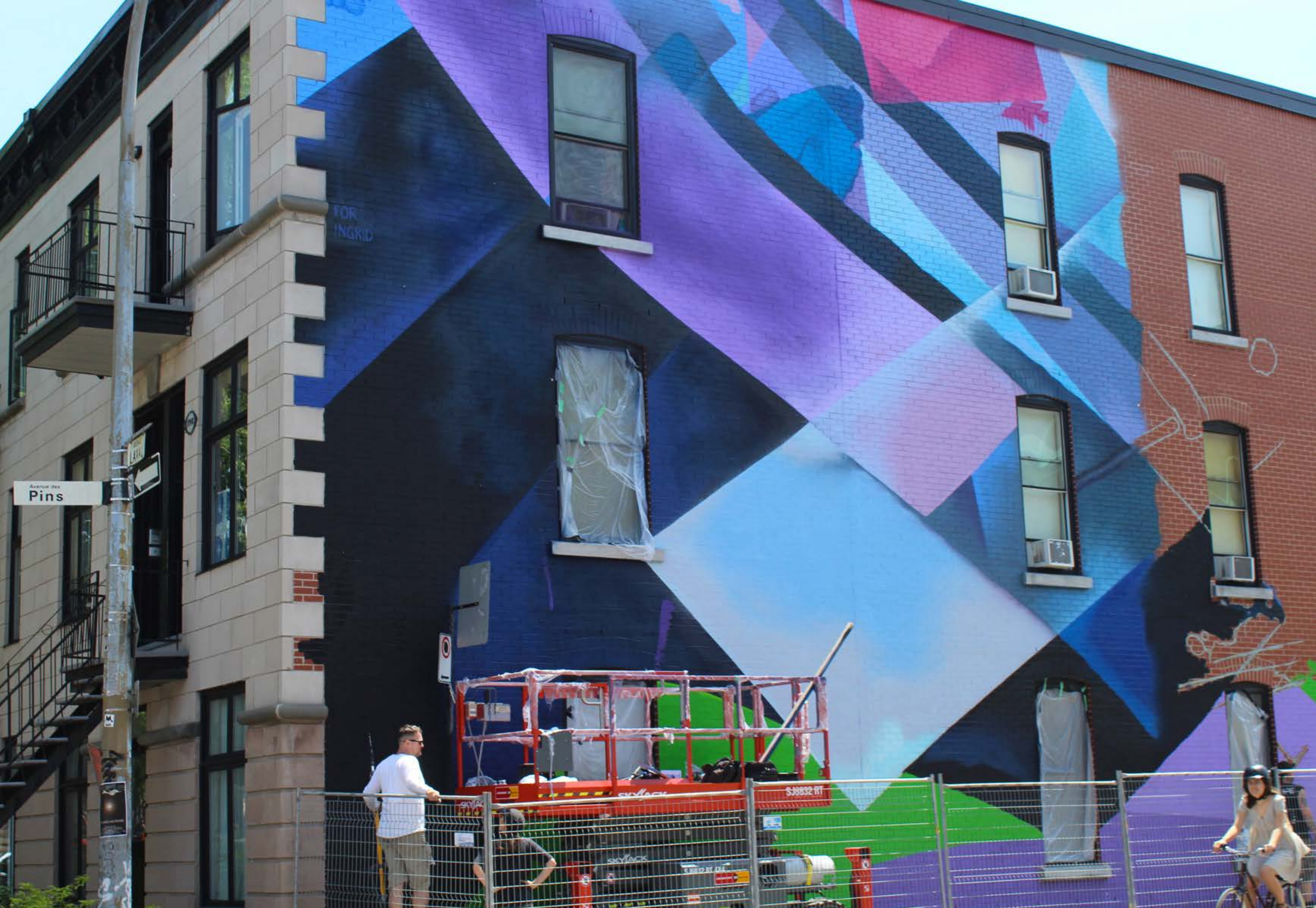
Mad C, Allemagne, 2017 Emplacement / Location : Av. des Pins / Laval