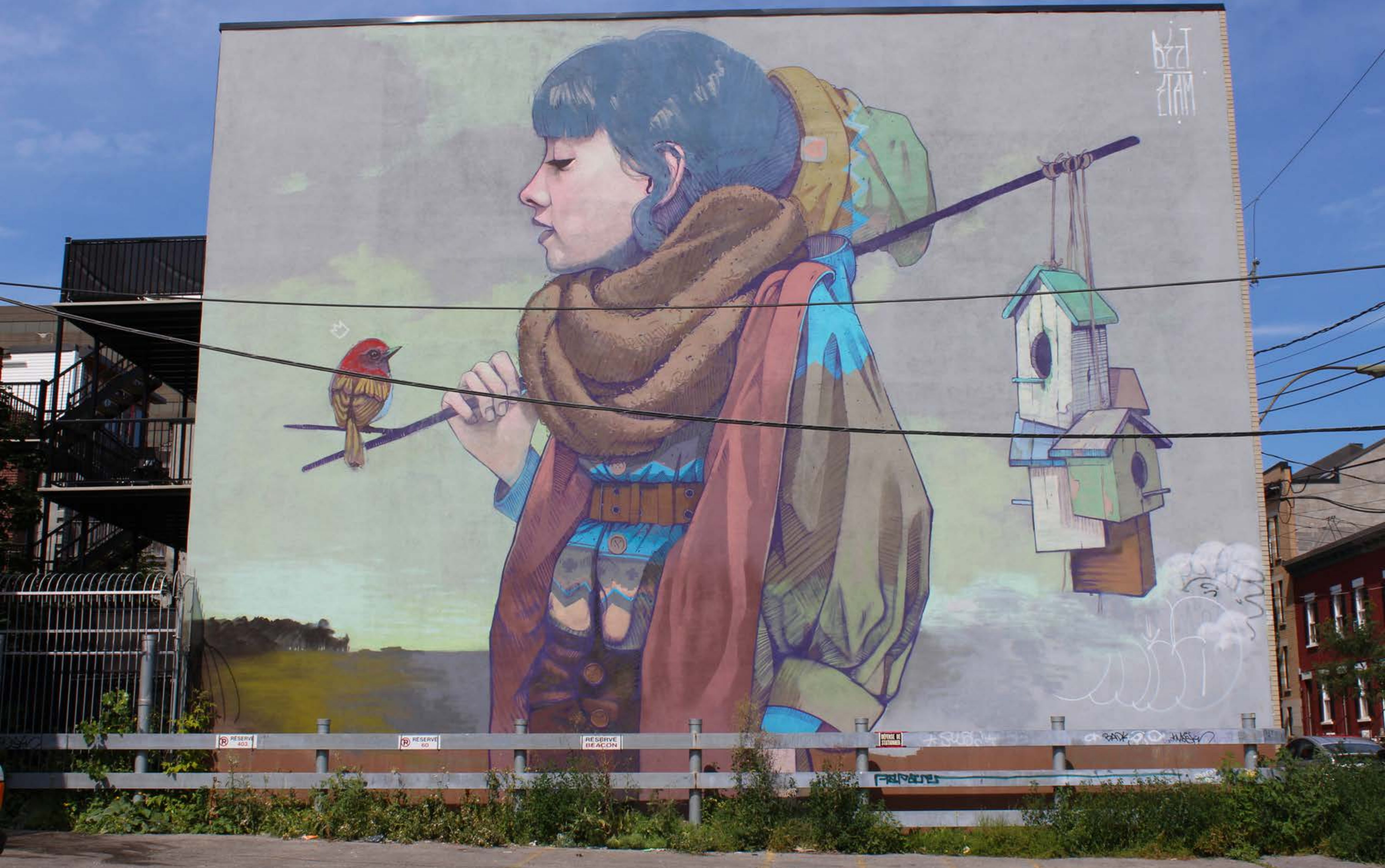
Betz, Pologne, 2014

Emplacement / Location : Saint-Dominique, entre Rachel et Duluth