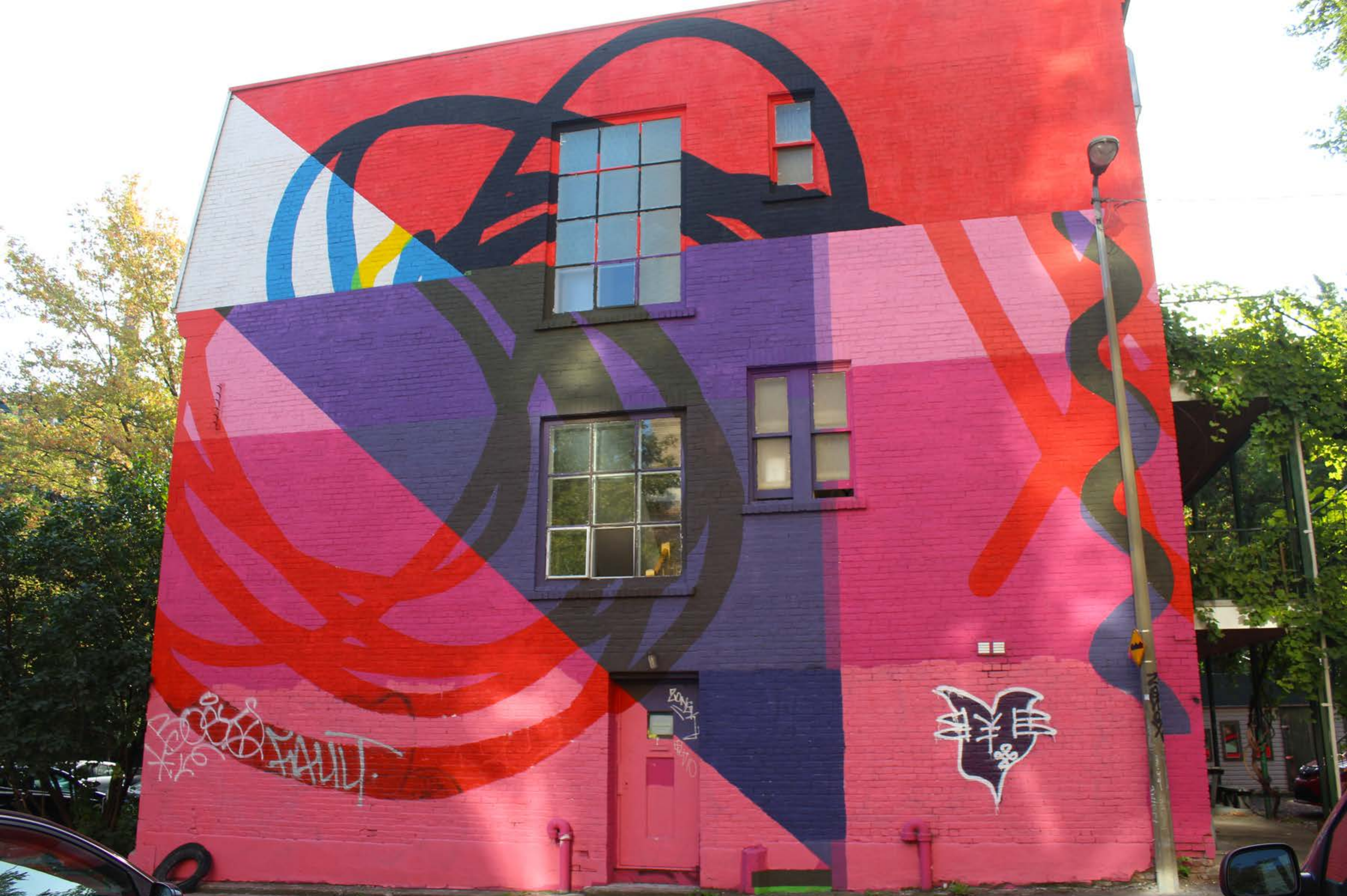
Elian Chali, Argentine, 2015 Emplacement / Location : Sainte-Famille / Basset