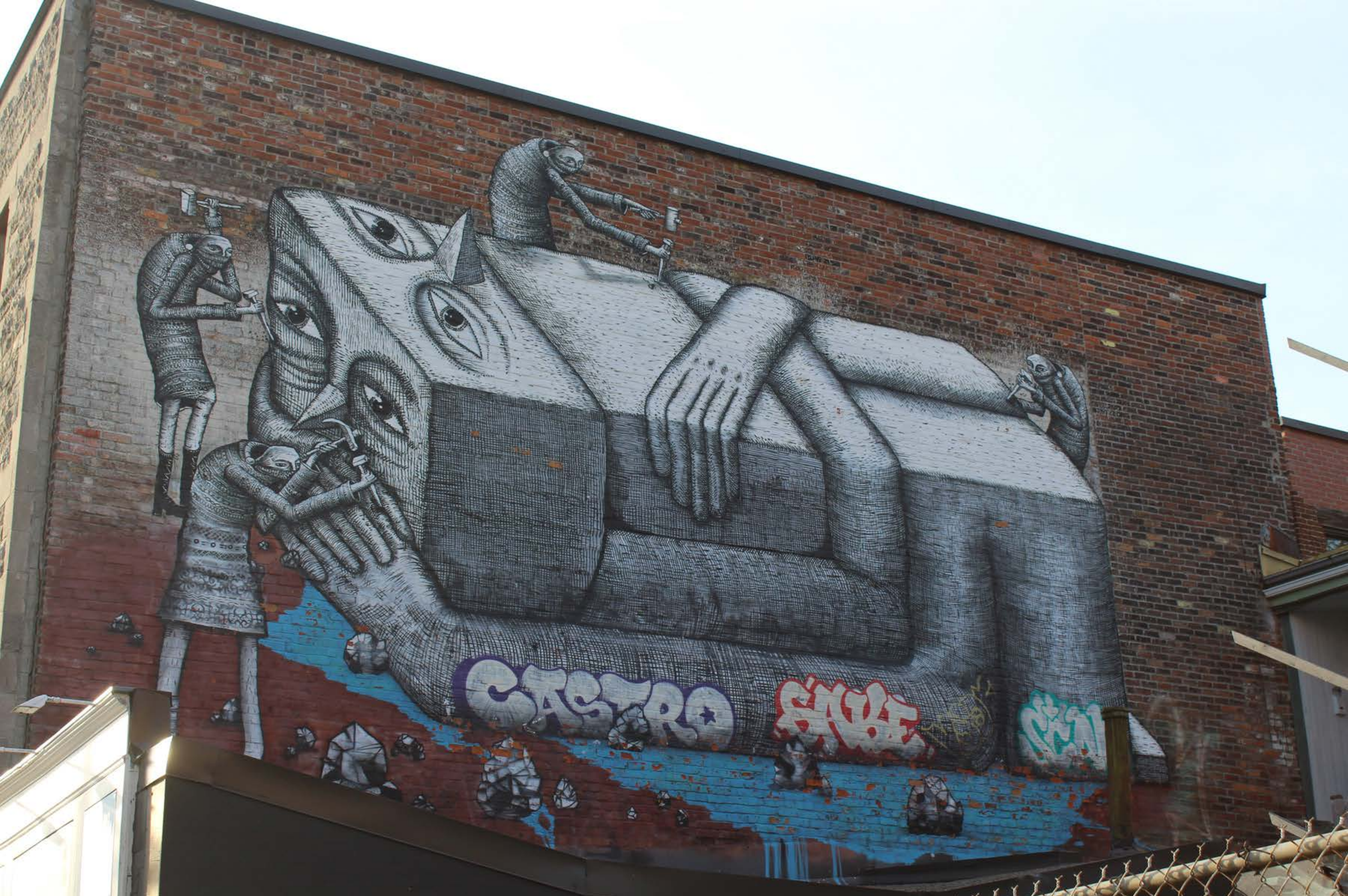
Phlegm, Angleterre, 2013 Emplacement / Location : Saint-Laurent / Napoléon