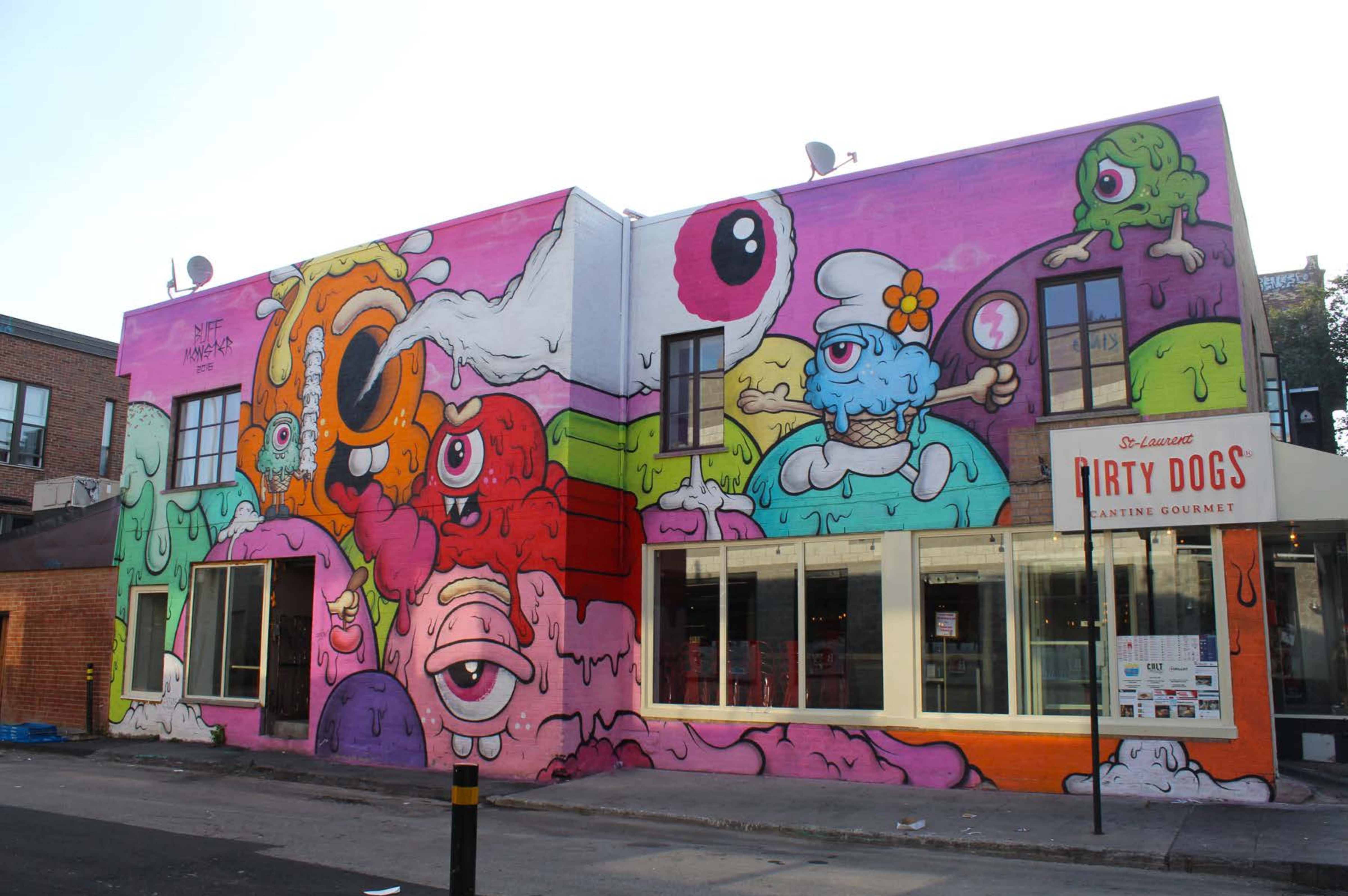
Buff Monster, États-Unis, 2016 Emplacement / Location : Guilbault / Saint-Laurent