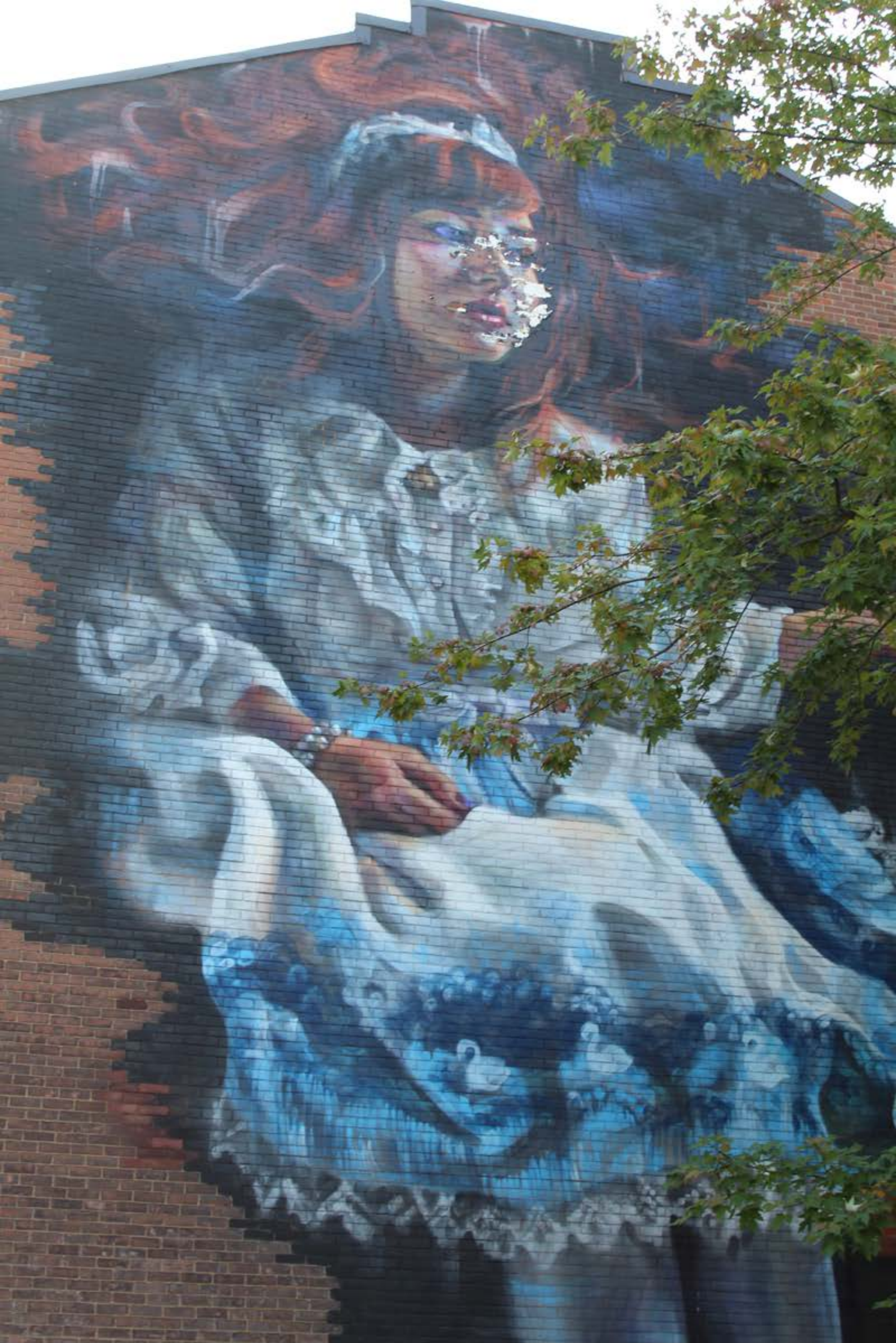
Jarus, Canada, 2015 Emplacement / Location : Milton / Sainte-Famille