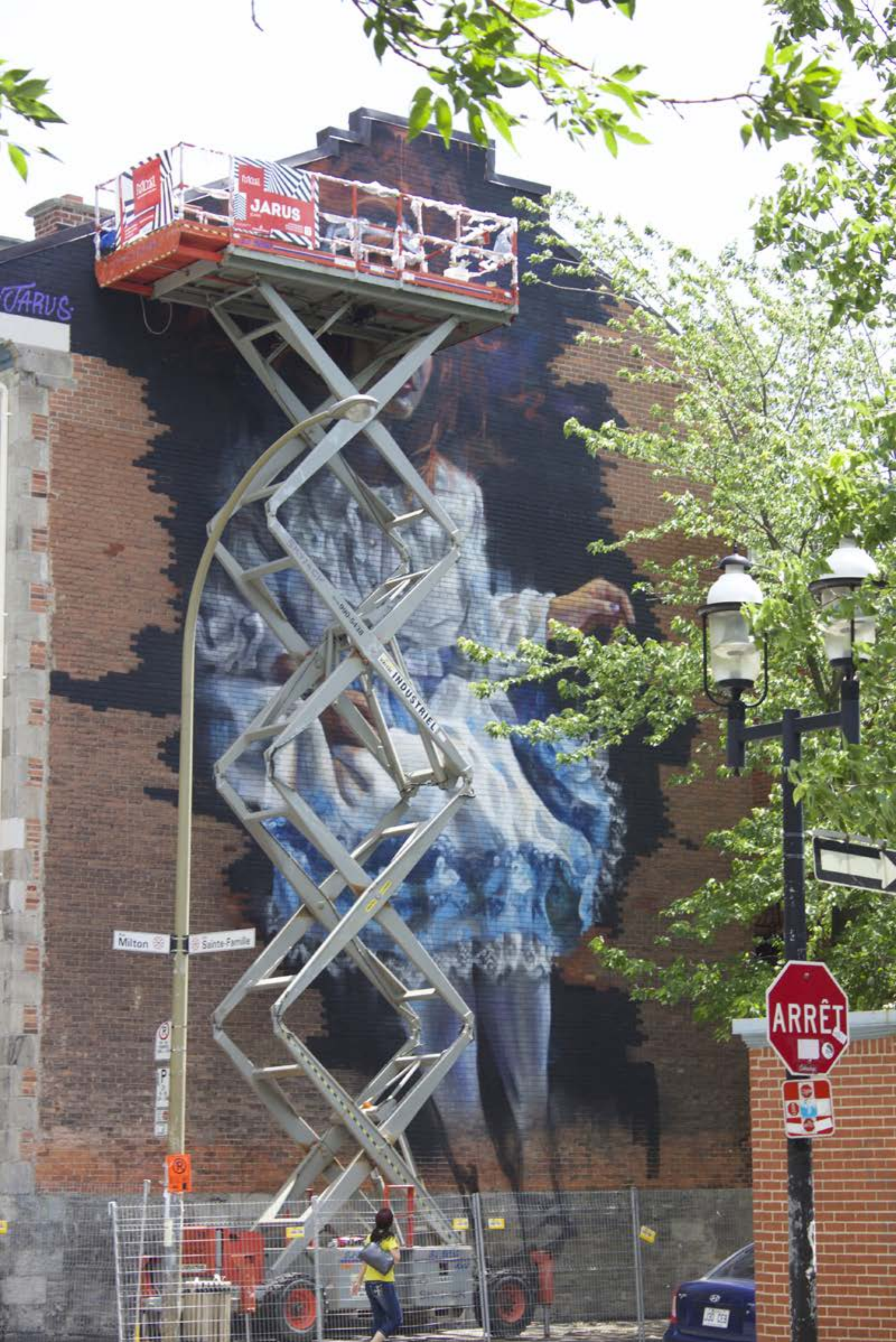
Jarus, Canada, 2015 Emplacement / Location : Milton / Sainte-Famille