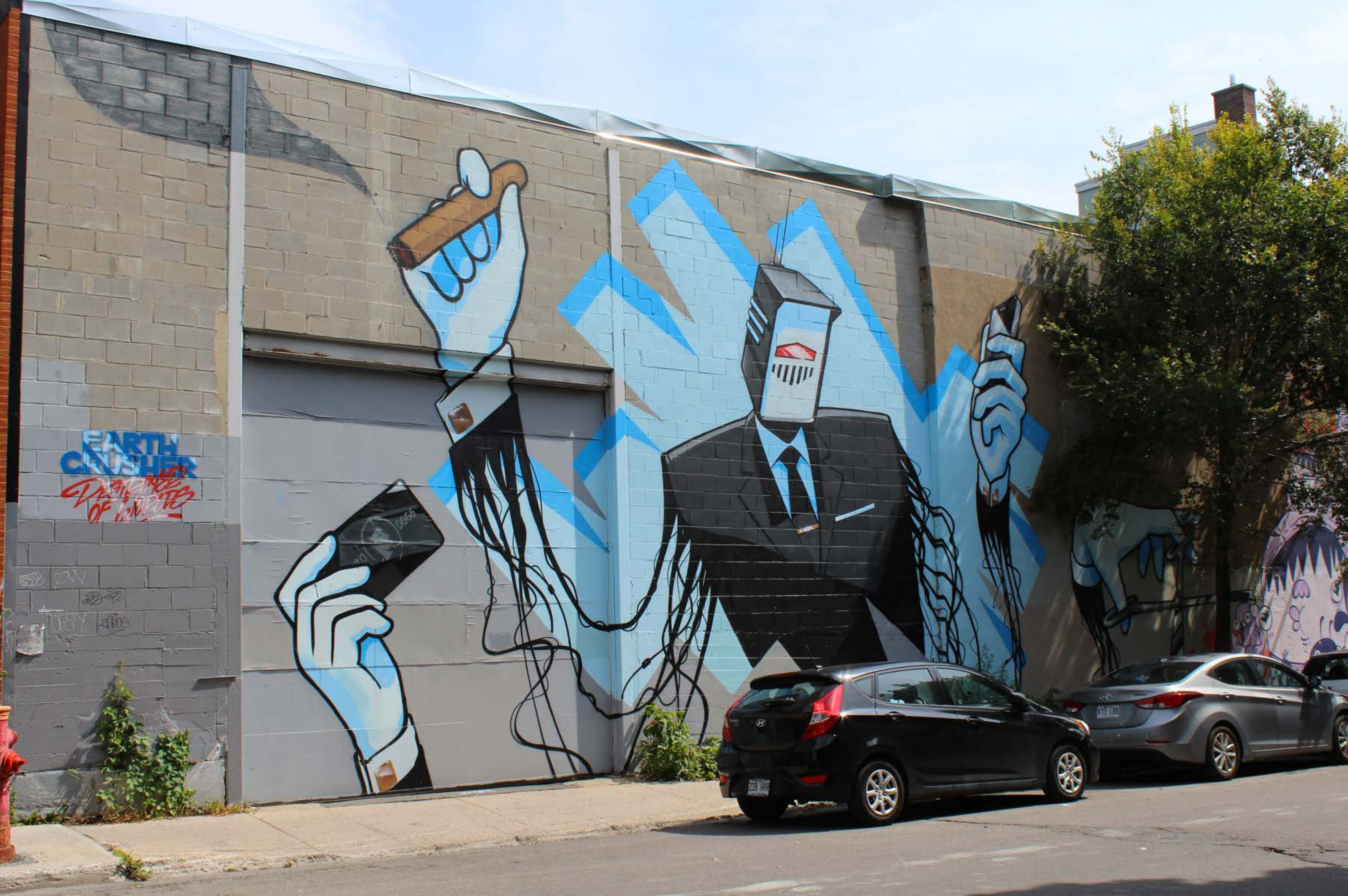
Earth Crusher, Canada, 2015 Emplacement / Location : Clark, entre Rachel et Duluth