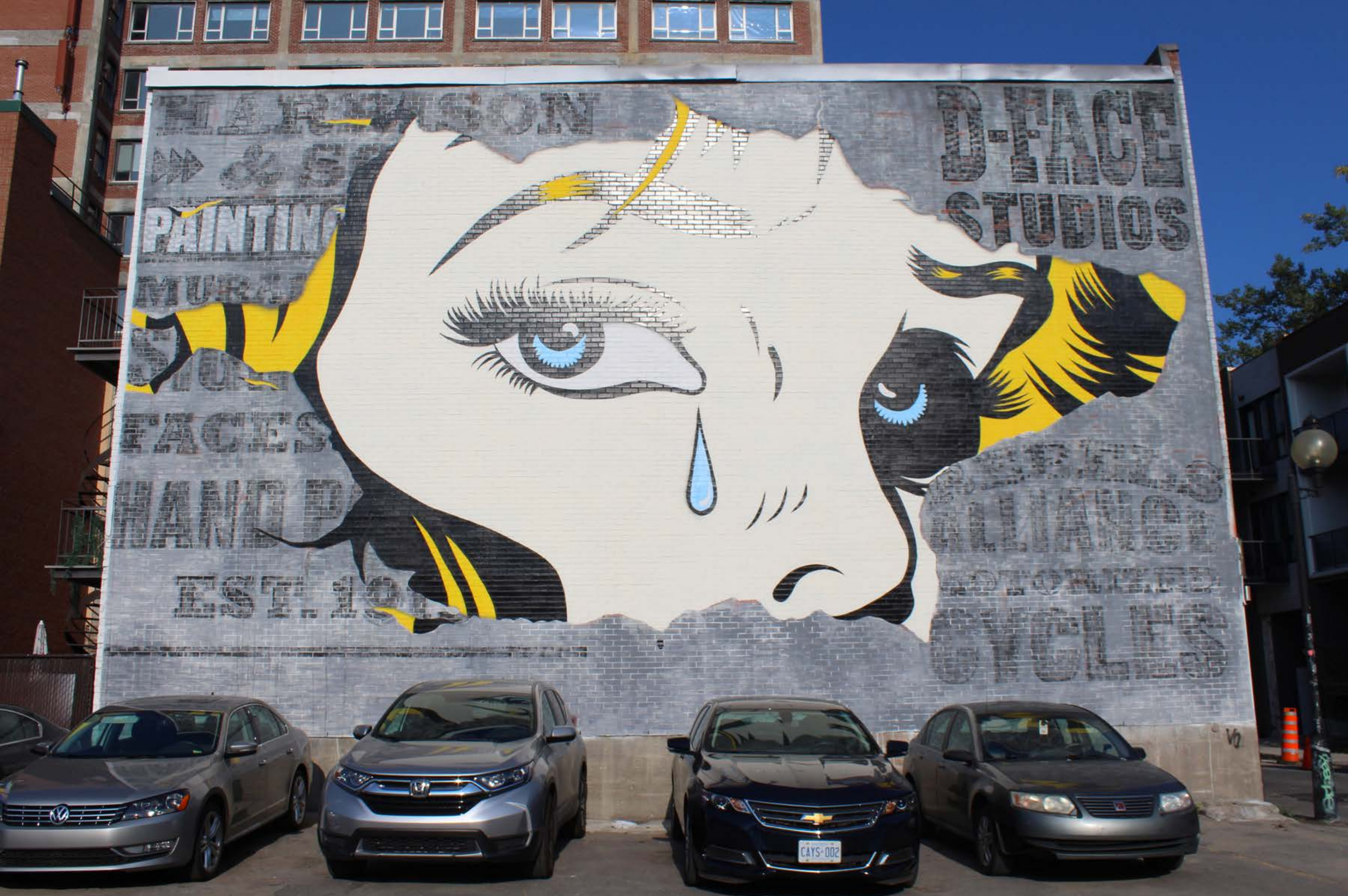
D*Face, Angleterre, 2016

Emplacement / Location : Saint-Dominique, entre Prince-Arthur et Milton