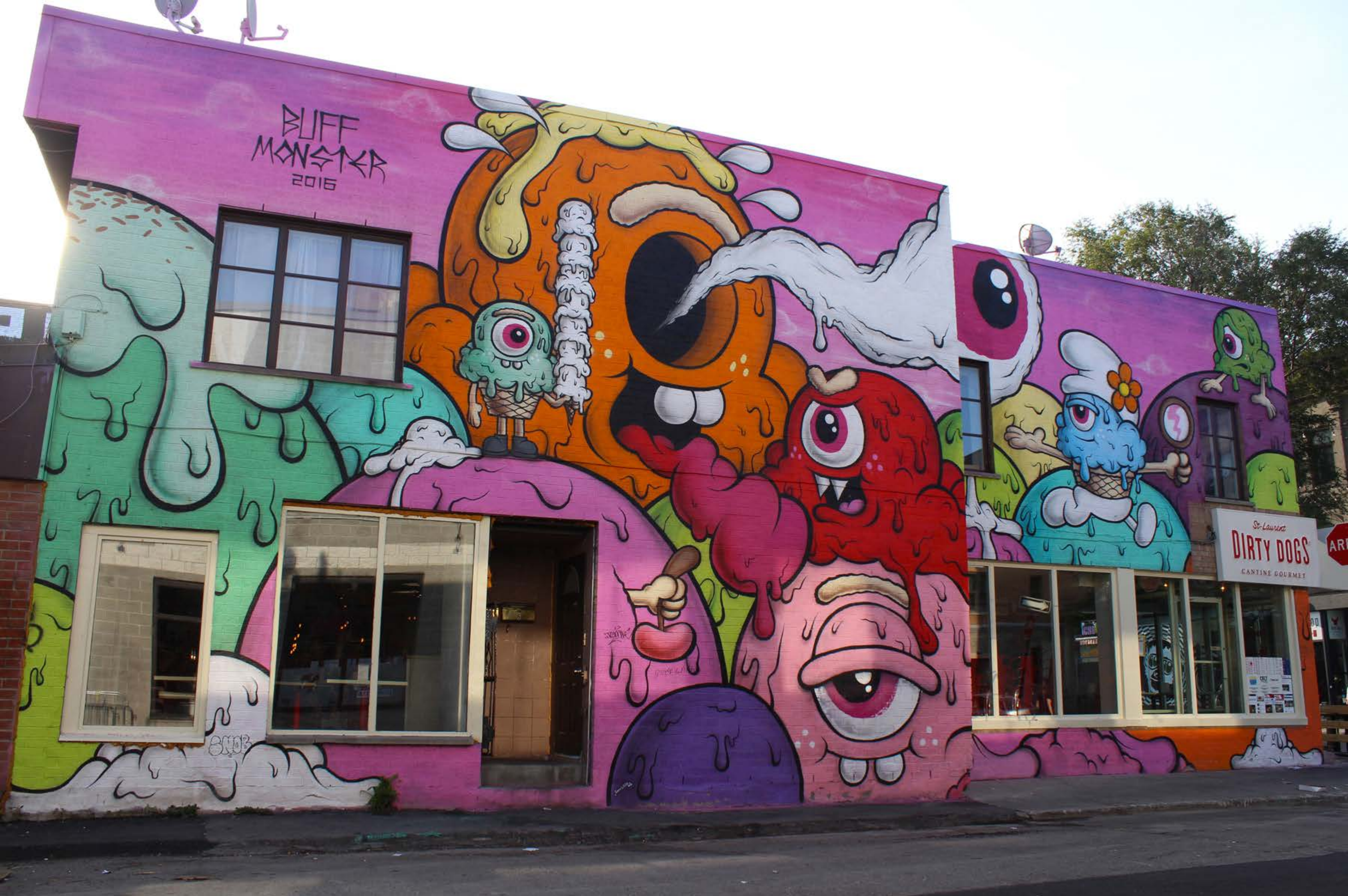
Buff Monster, États-Unis, 2016 Emplacement / Location : Guilbault / Saint-Laurent