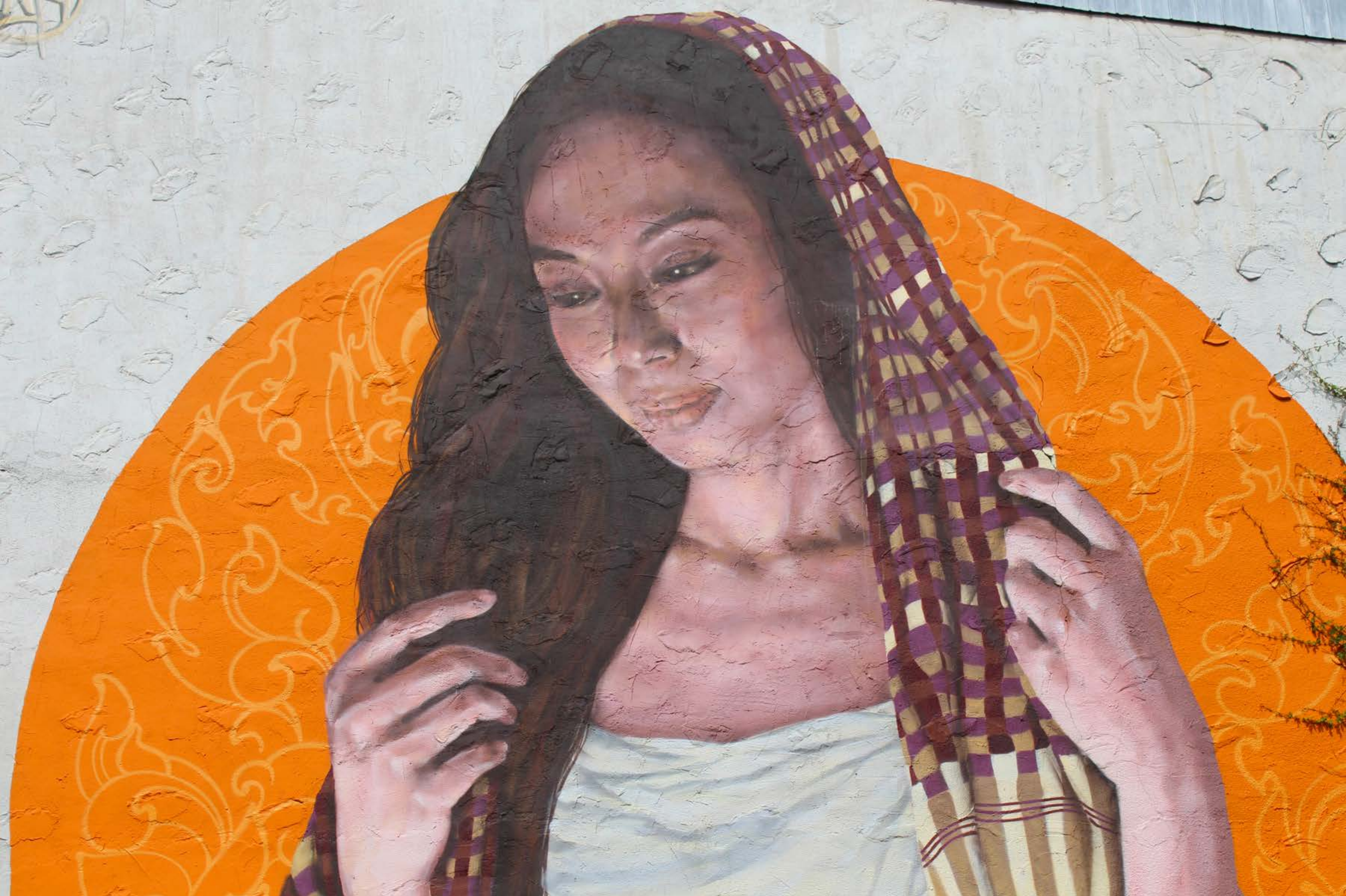
Fonki, Canada, 2016

Emplacement / Location : Saint-Urbain, entre Rachel et Duluth