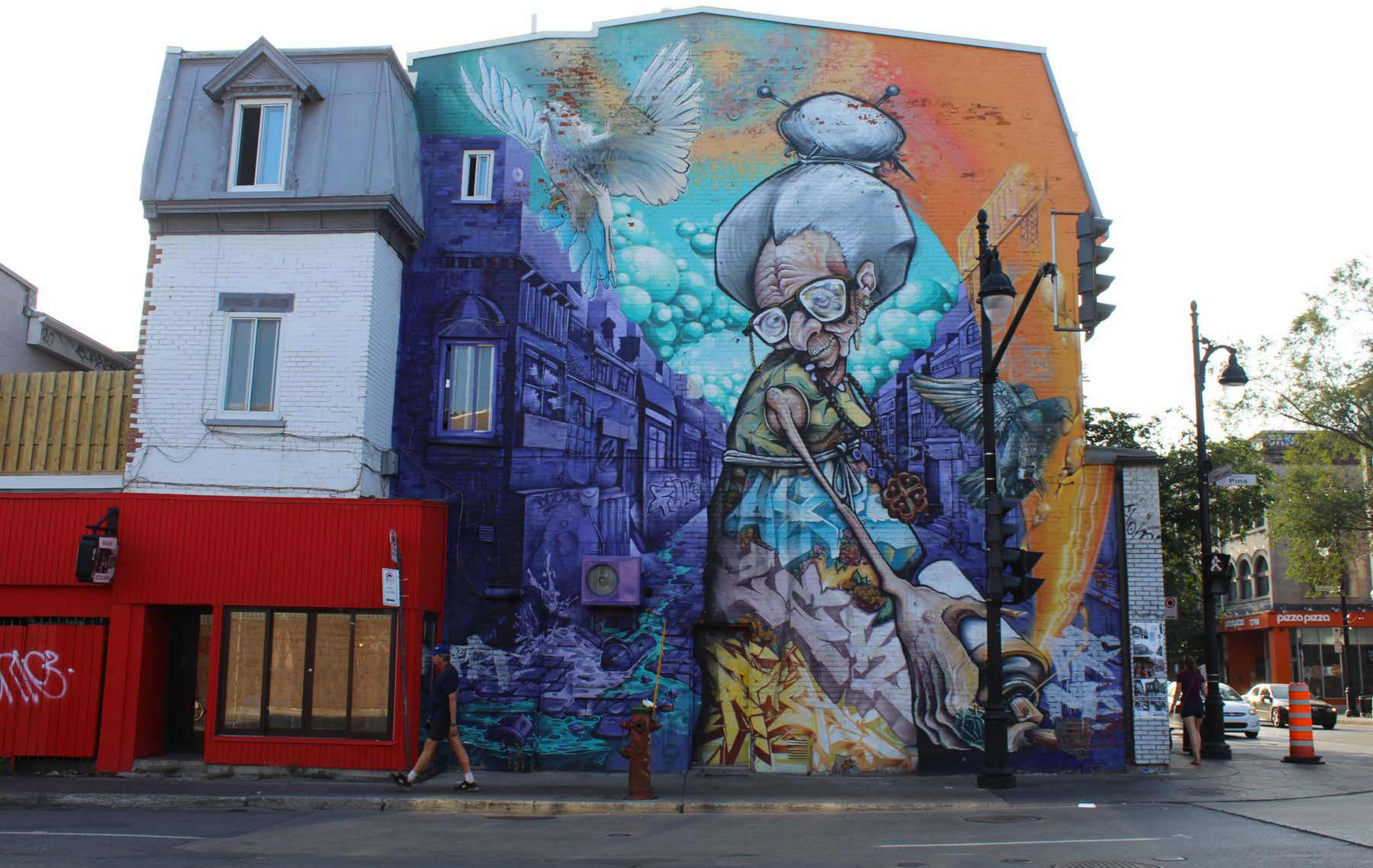
Ashop (Collectif), Canada, 2013 Emplacement / Location : Av. des Pins / Saint-Laurent