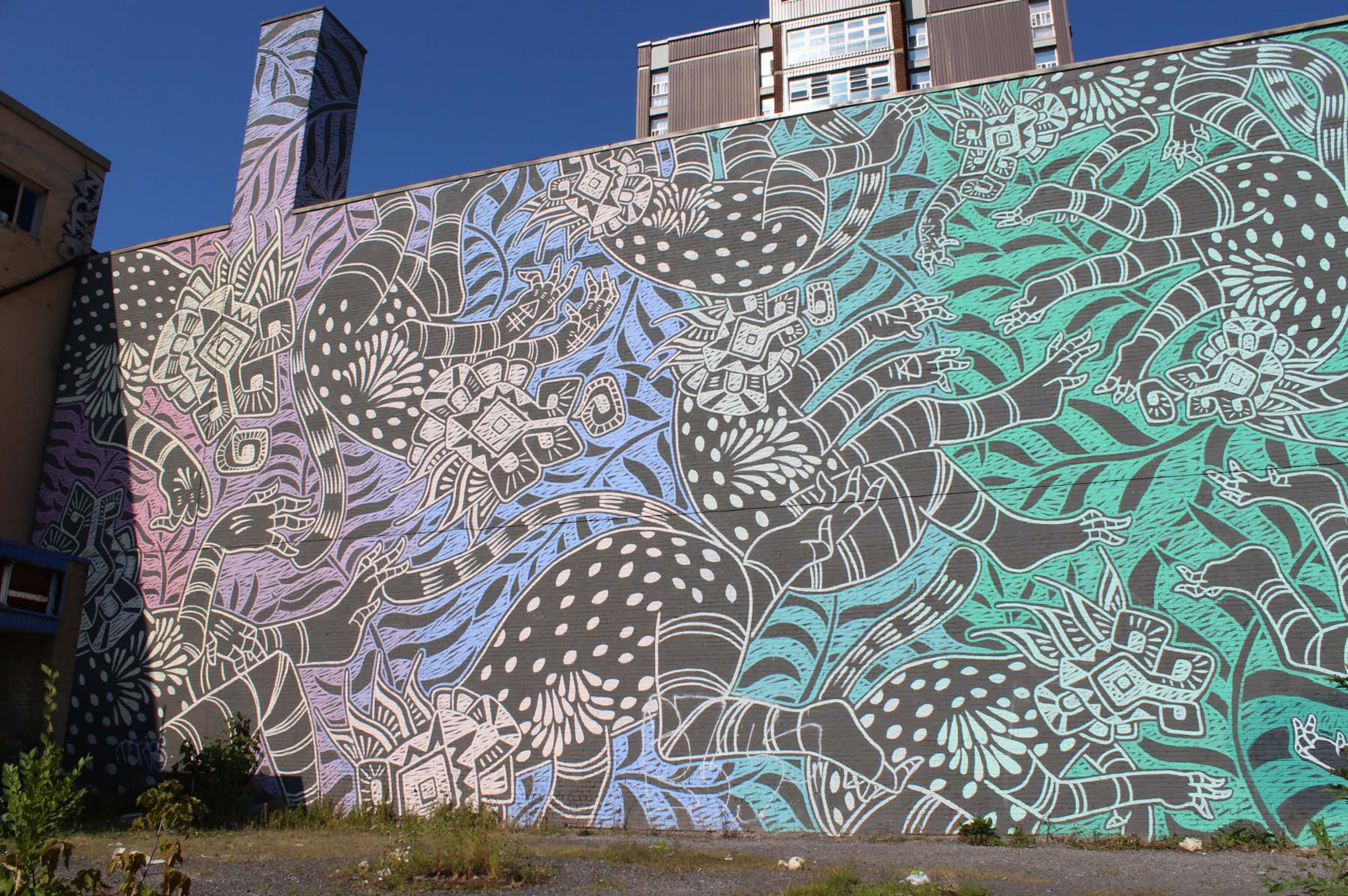
Curiot, Mexique, 2015 Emplacement / Location : Sherbrooke / Jeanne-Mance