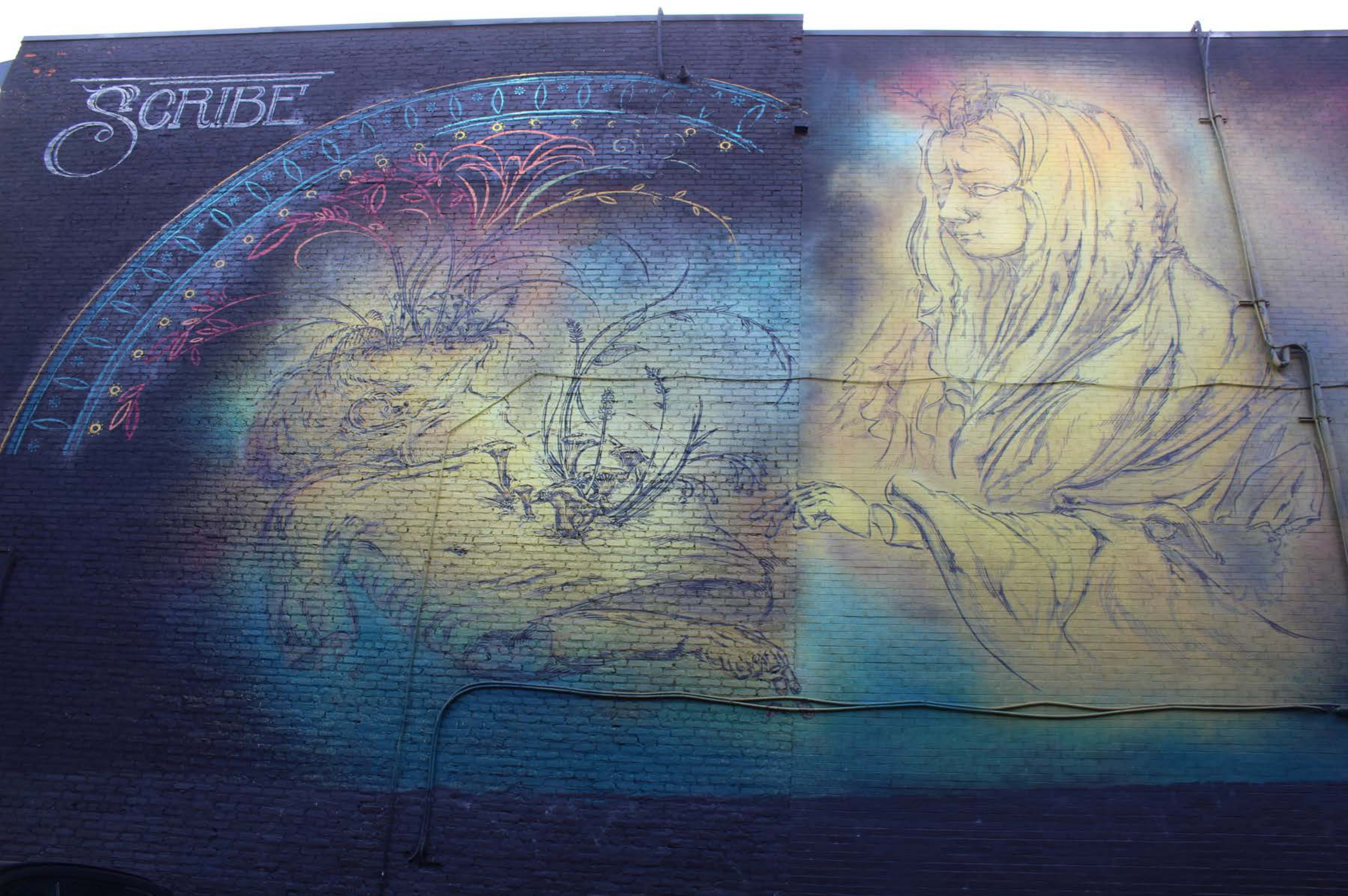
Scribe CSX, Canada, 2017 Emplacement / Location : Saint-Laurent / Saint-Cuthbert