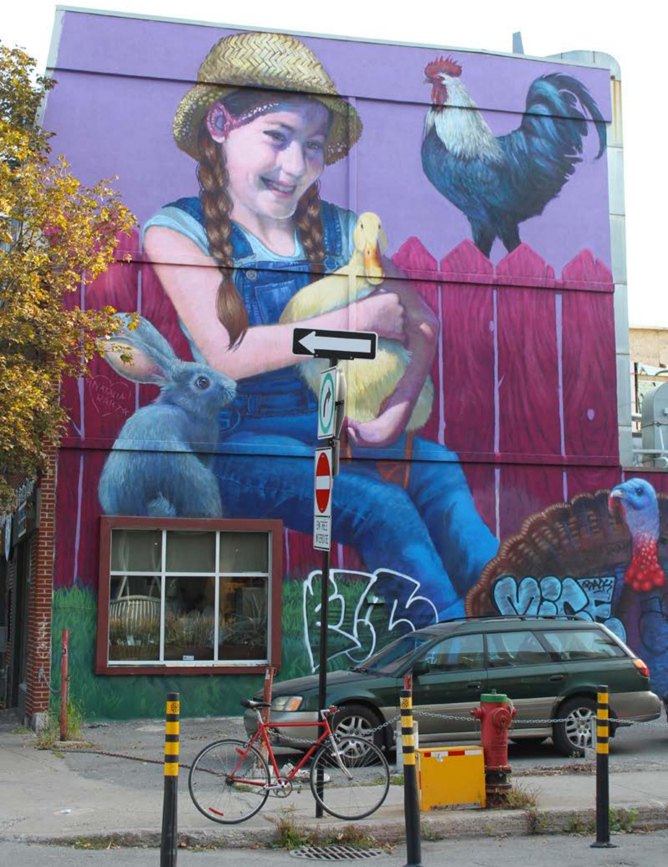
Natalia Rak, Pologne, 2016 Emplacement / Location : Coloniale / Roy