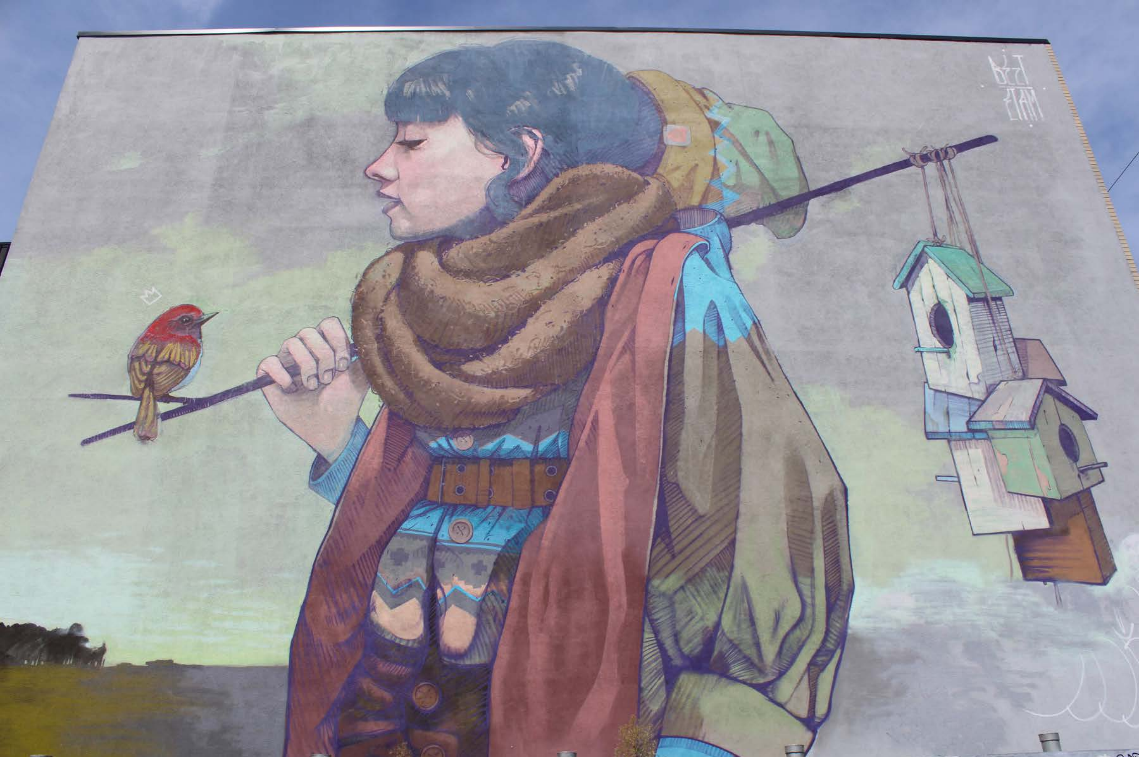
Betz, Pologne, 2014 Emplacement / Location : Saint-Dominique, entre Rachel et Duluth