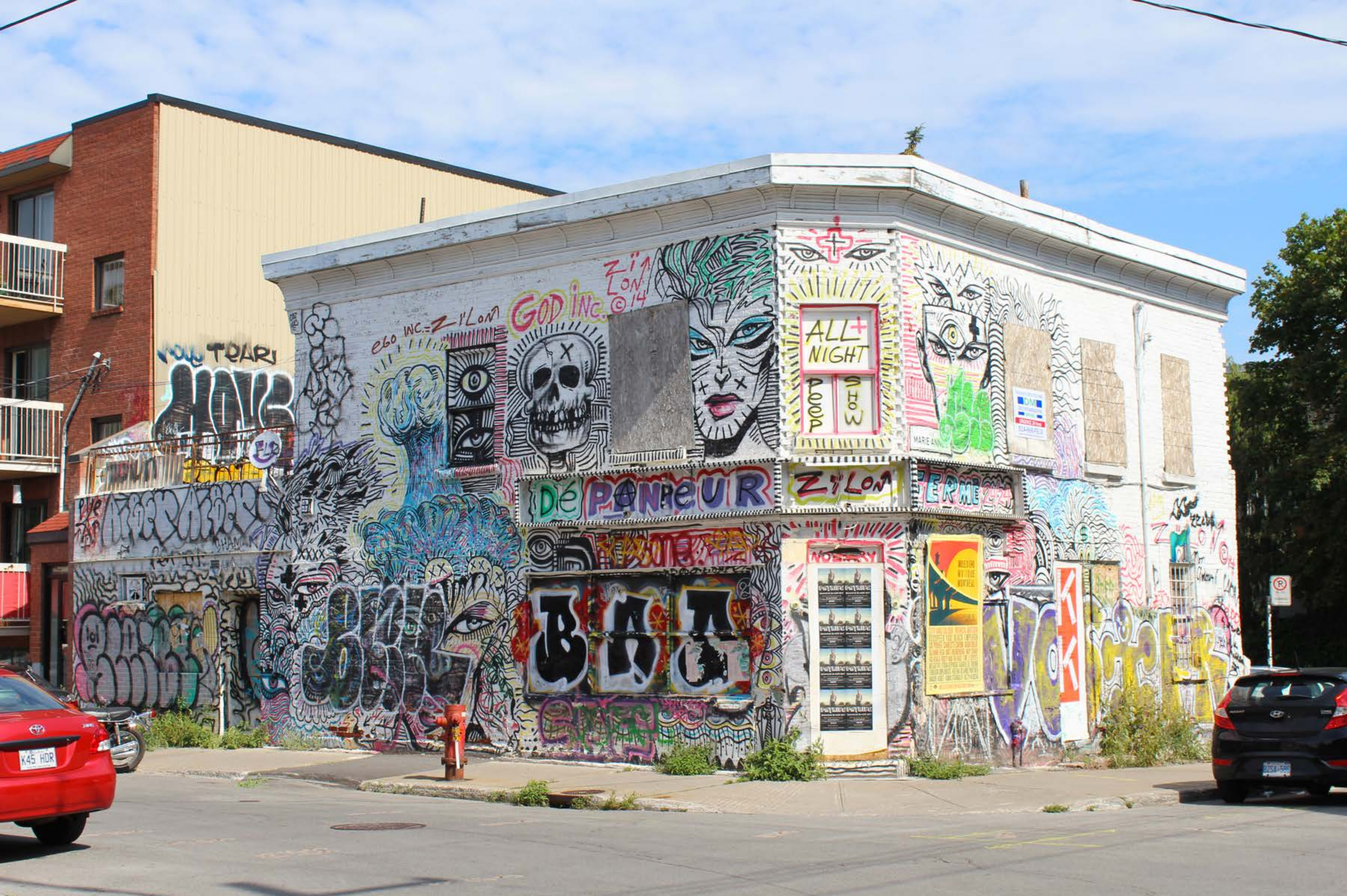
Zilon, Canada, 2014 Emplacement / Location : Saint-Dominique / Marie-Anne