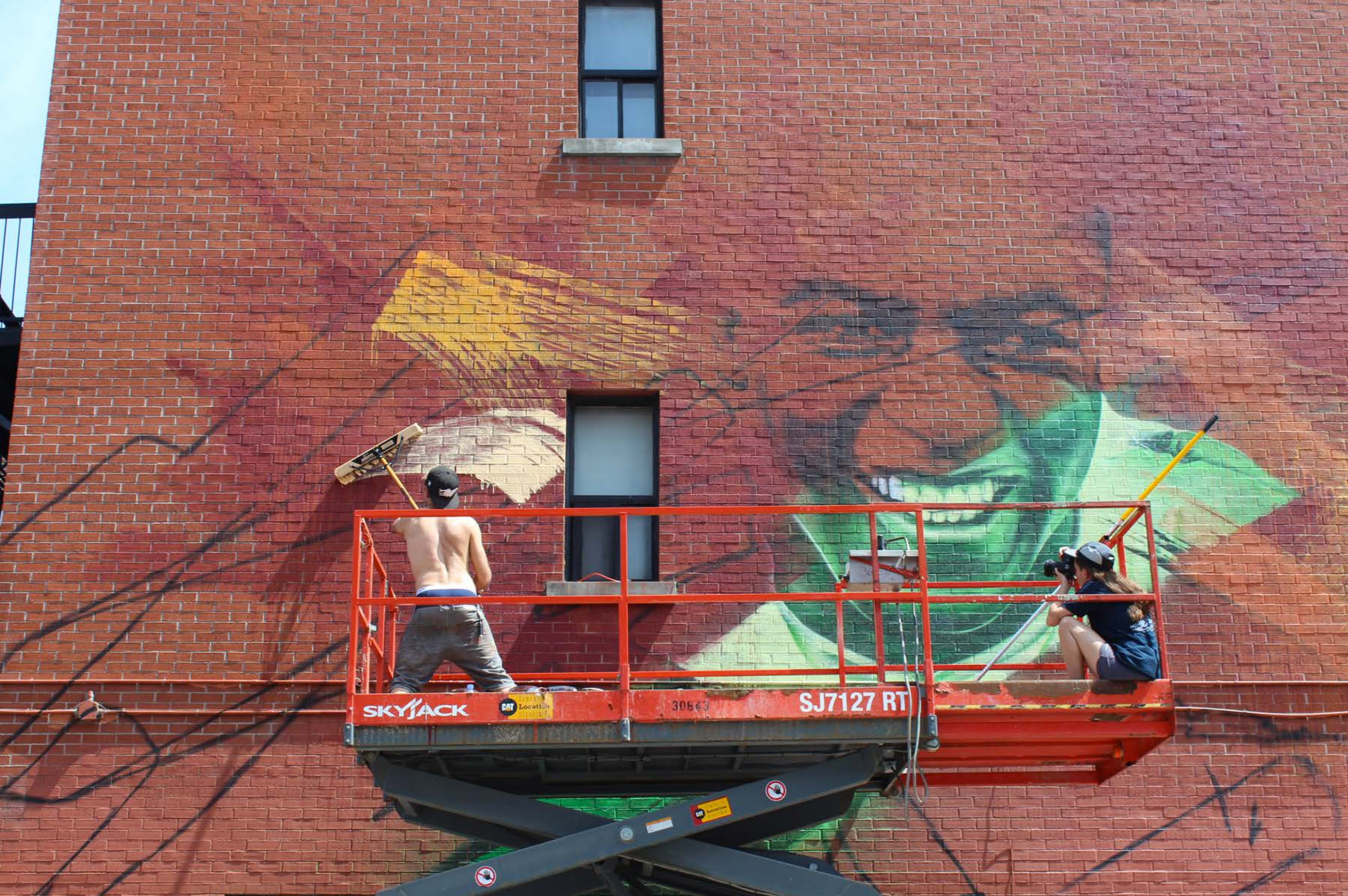
Fluke, Canada, 2017

Emplacement / Location : Napoléon / Saint-Laurent