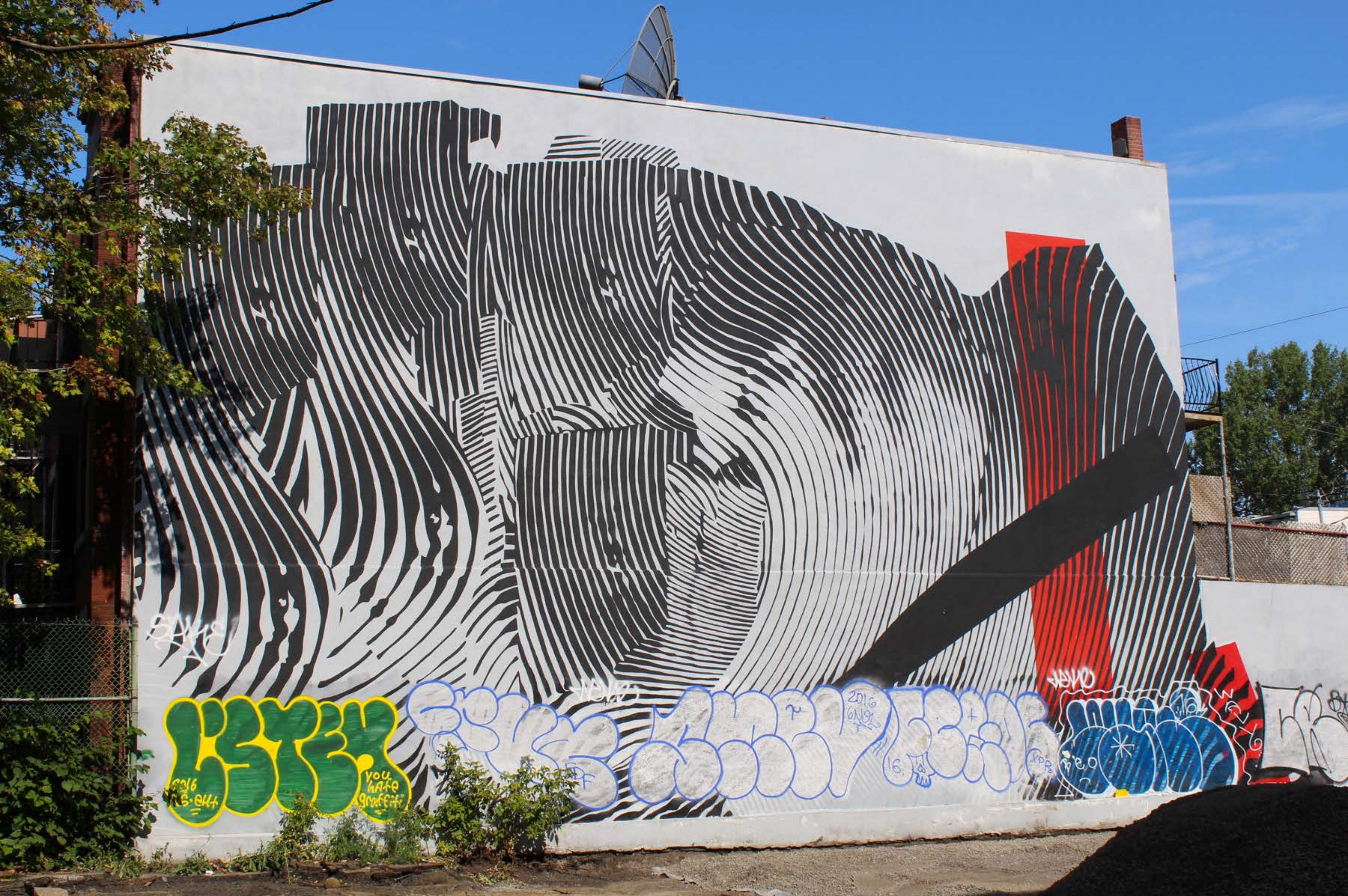
2 Alas, États-Unis, 2015 Emplacement / Location : Saint-Urbain / Mont-Royal