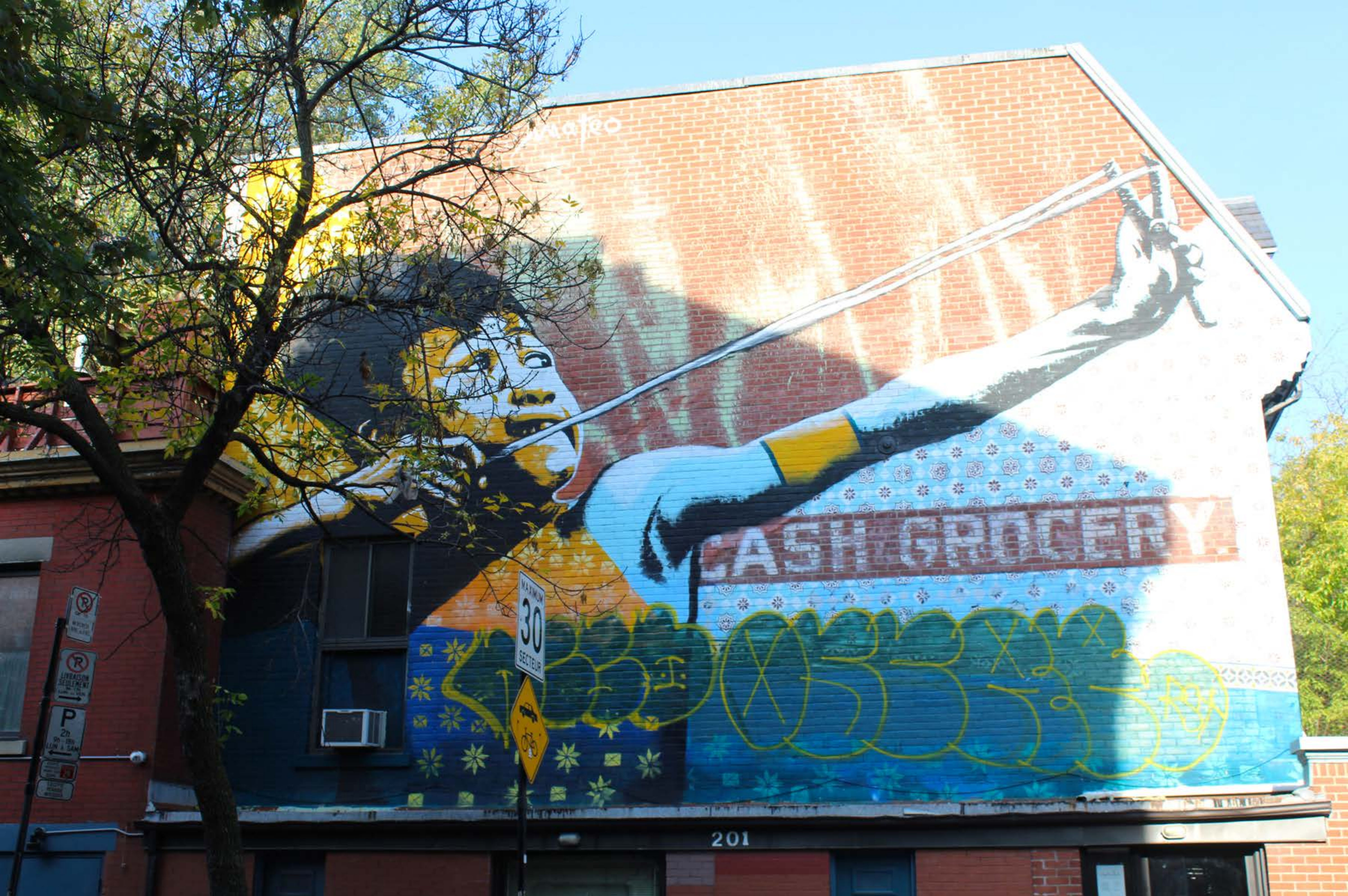
Mateo, Canada, 2016 Emplacement / Location : Milton / Sainte-Famille