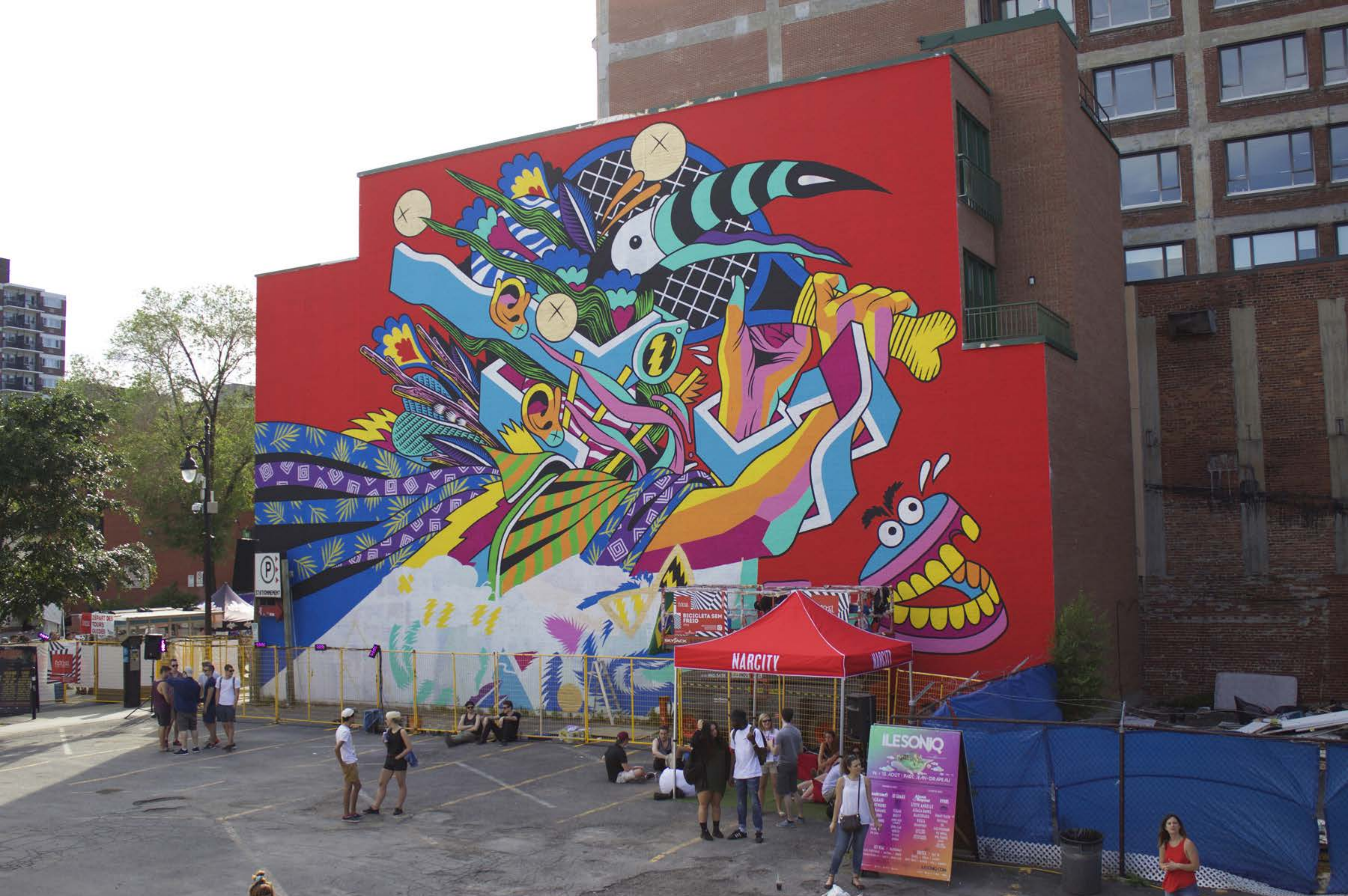
Bicicleta sem Freio, Brésil, 2015 Emplacement / Location : Saint-Laurent, entre Prince-Arthur et Milton