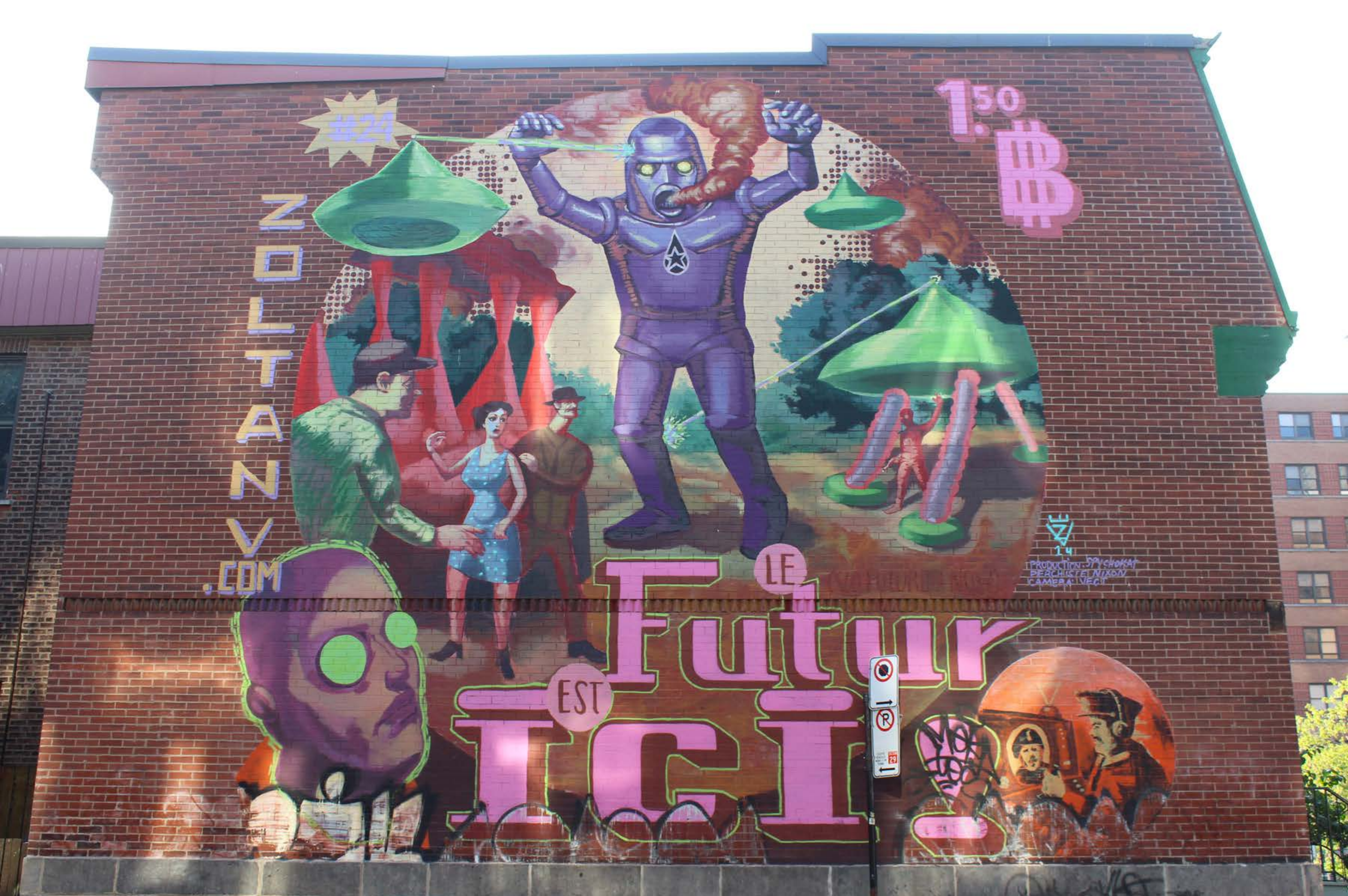
Zoltan, Canada, 2014 Emplacement / Location : Guilbault / Saint-Urbain