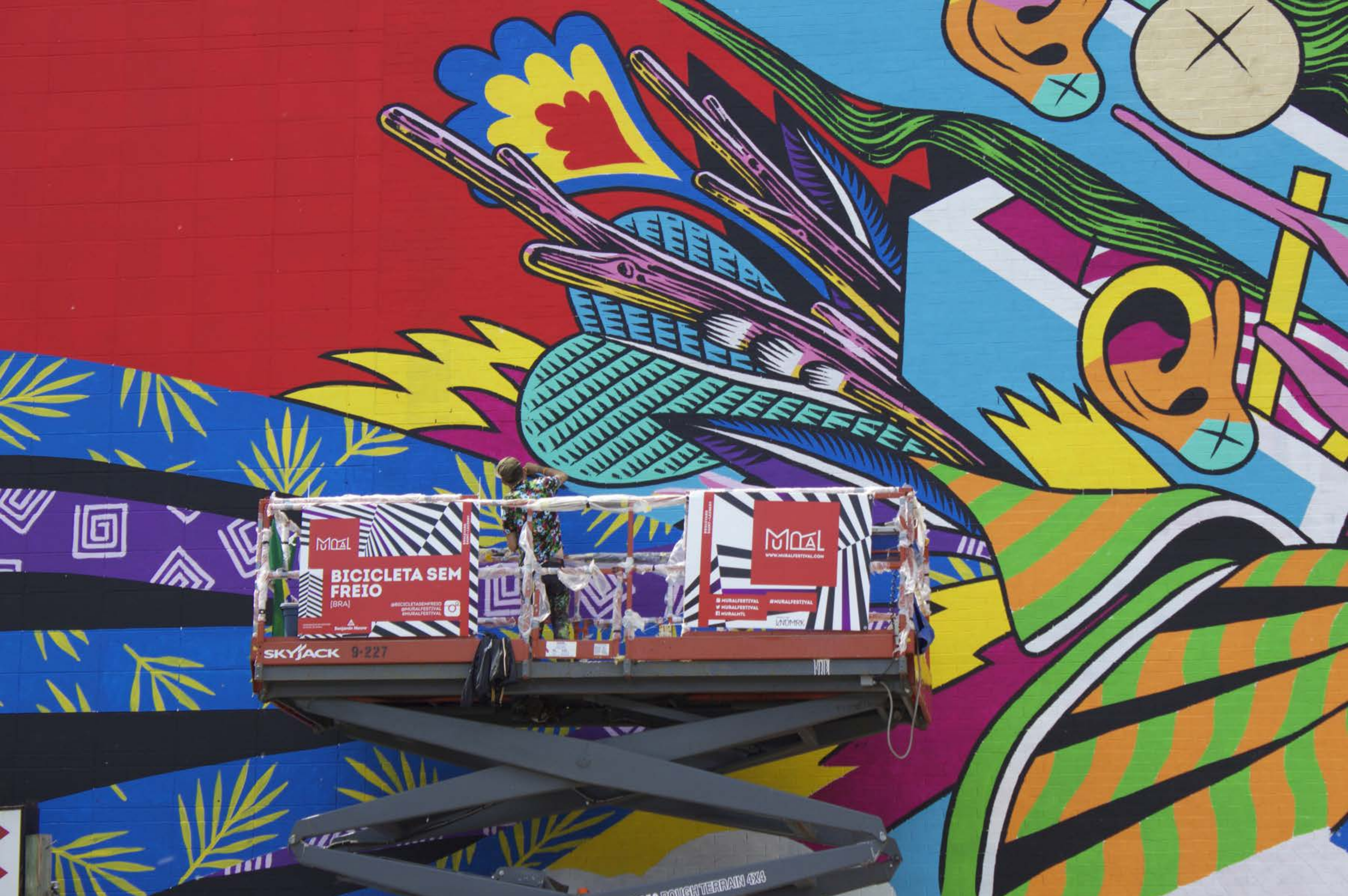
Bicicleta sem Freio, Brésil, 2015 Emplacement / Location : Saint-Laurent, entre Prince-Arthur et Milton