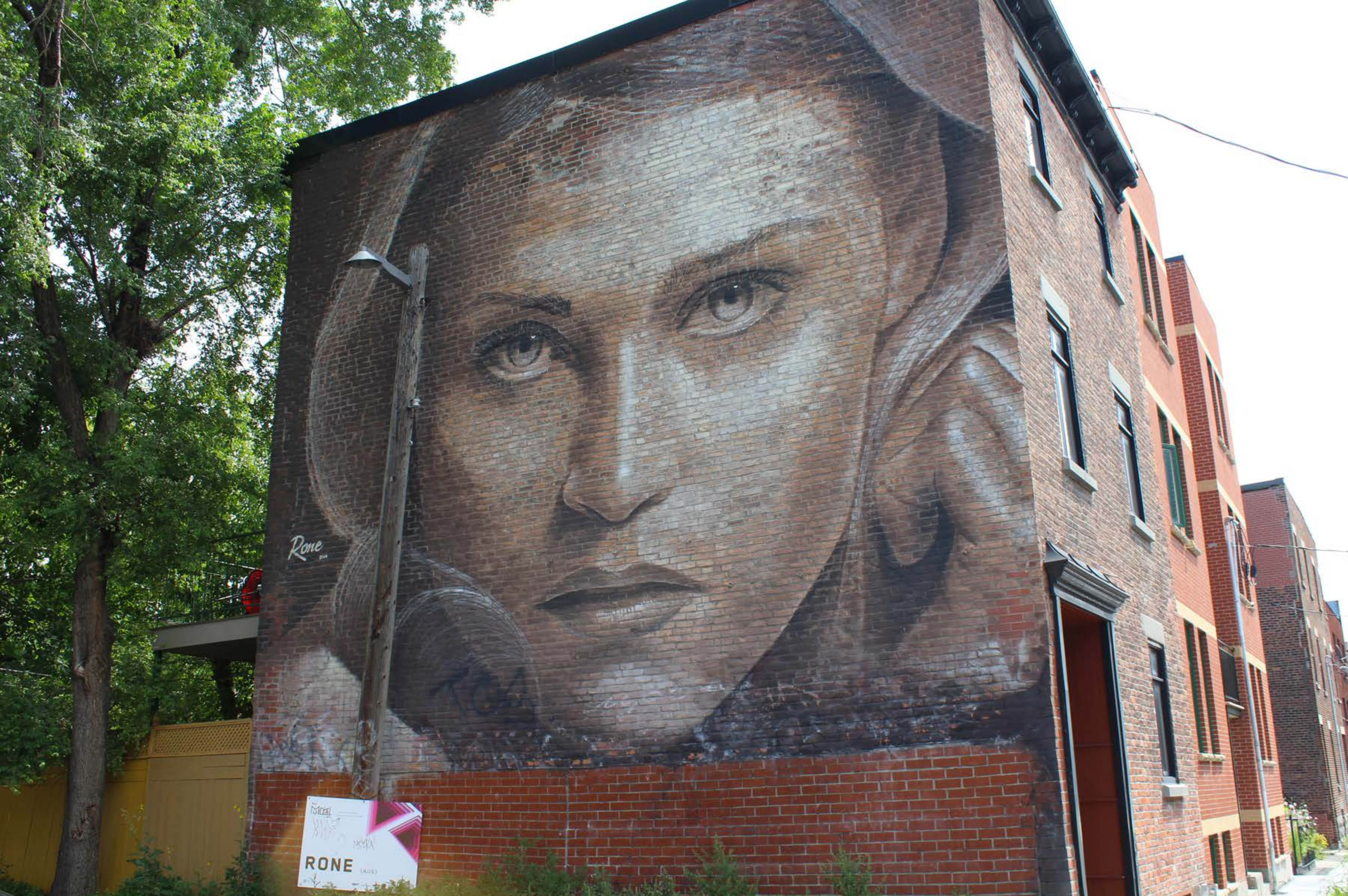
Rone, Australie, 2014 Emplacement / Location : Saint-Dominique / Napoléon et Roy