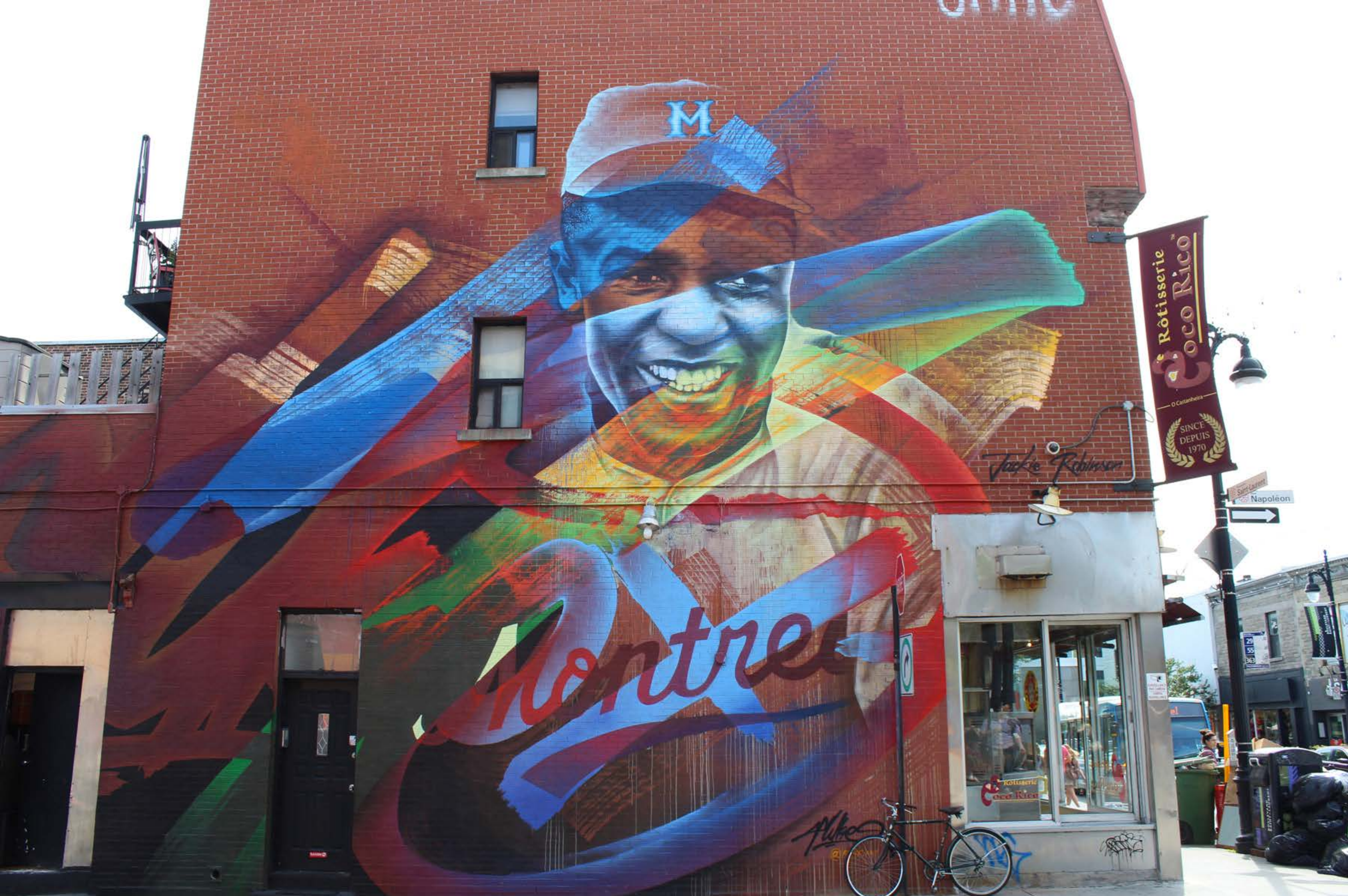
Fluke, Canada, 2017 Emplacement / Location : Napoléon / Saint-Laurent