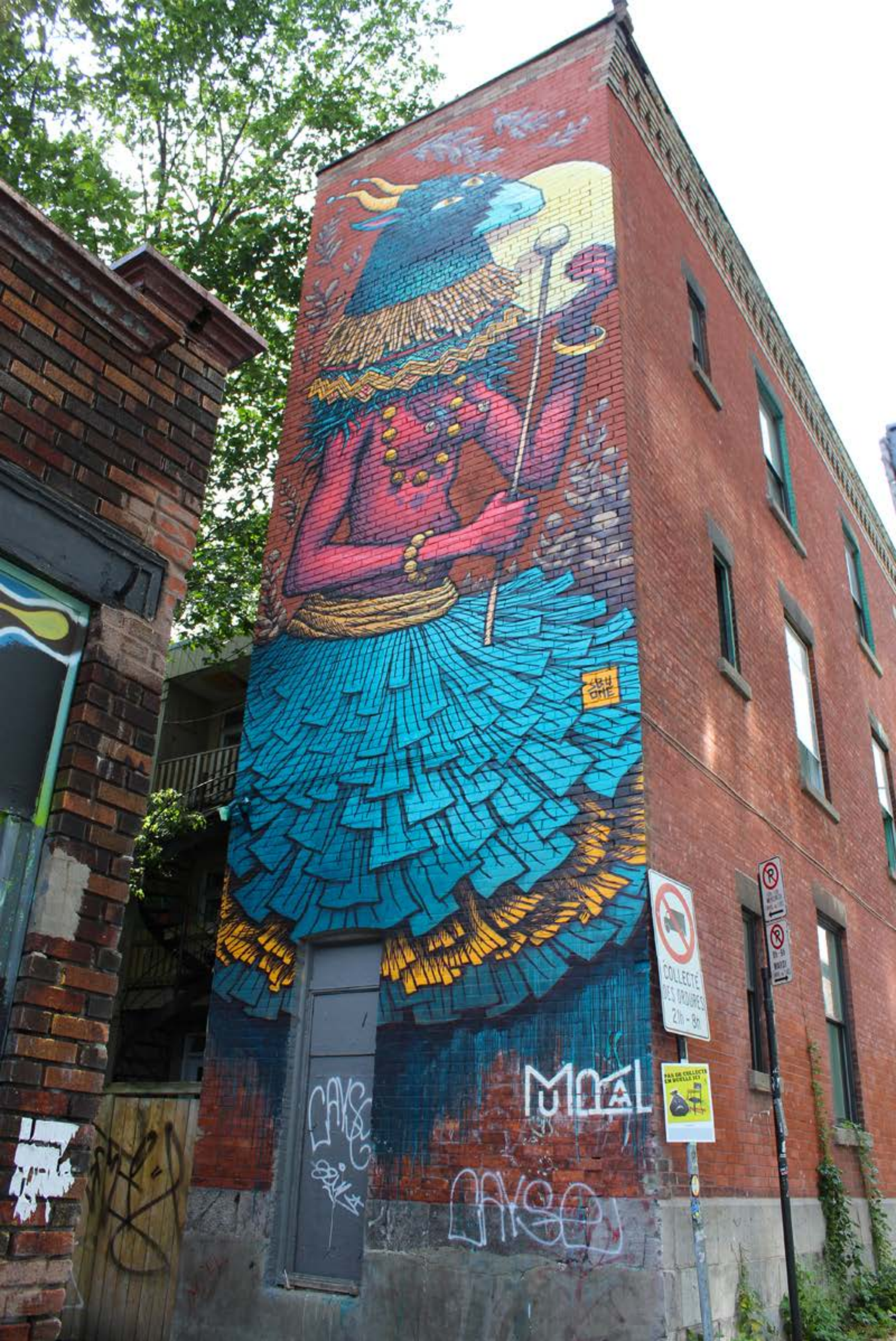
Sbu One, Canada, 2017 Emplacement / Location : Duluth / Clark