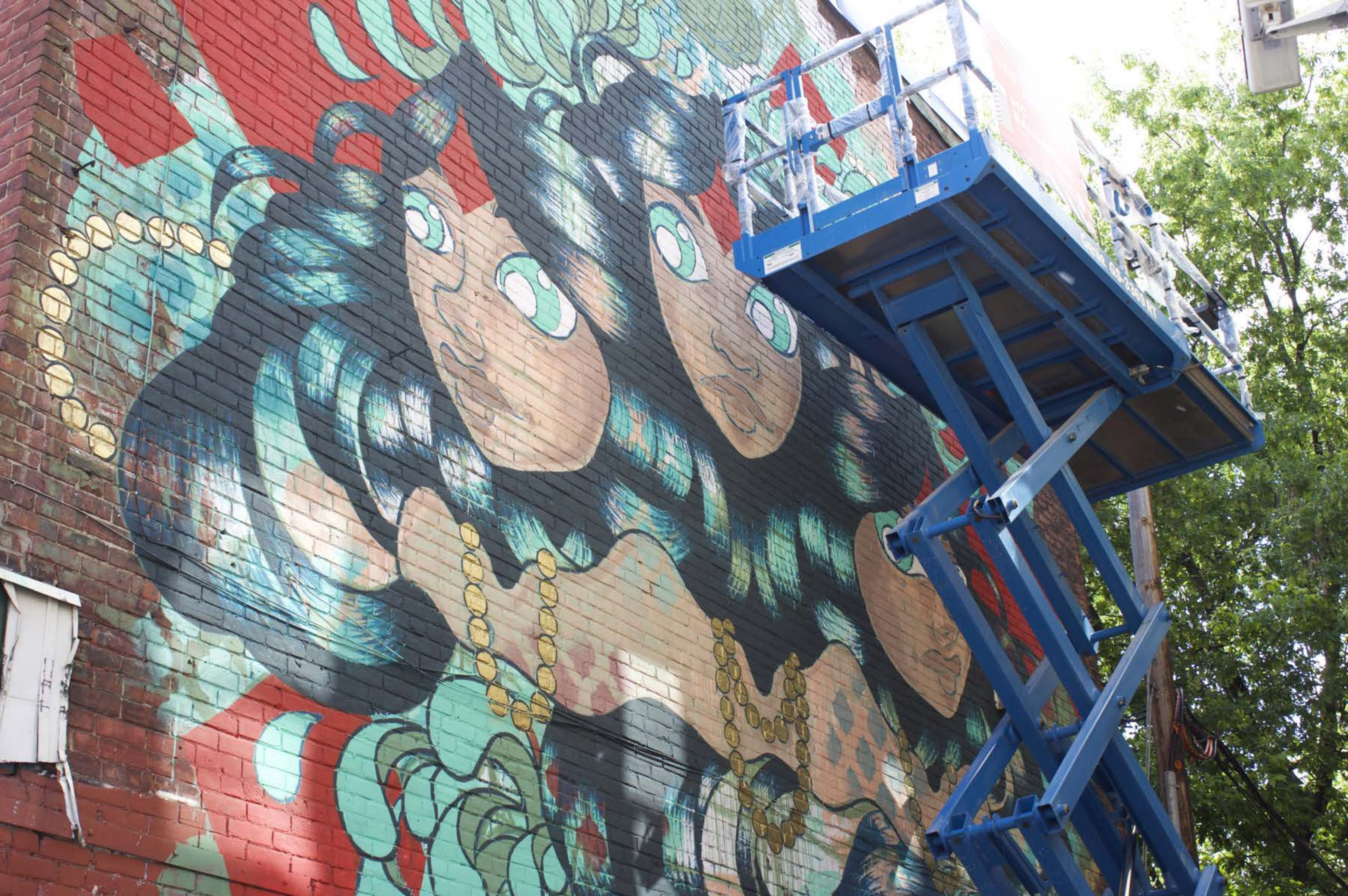
MC Baldassari, Canada, 2015 Emplacement / Location : Prince-Arthur / Saint-Laurent