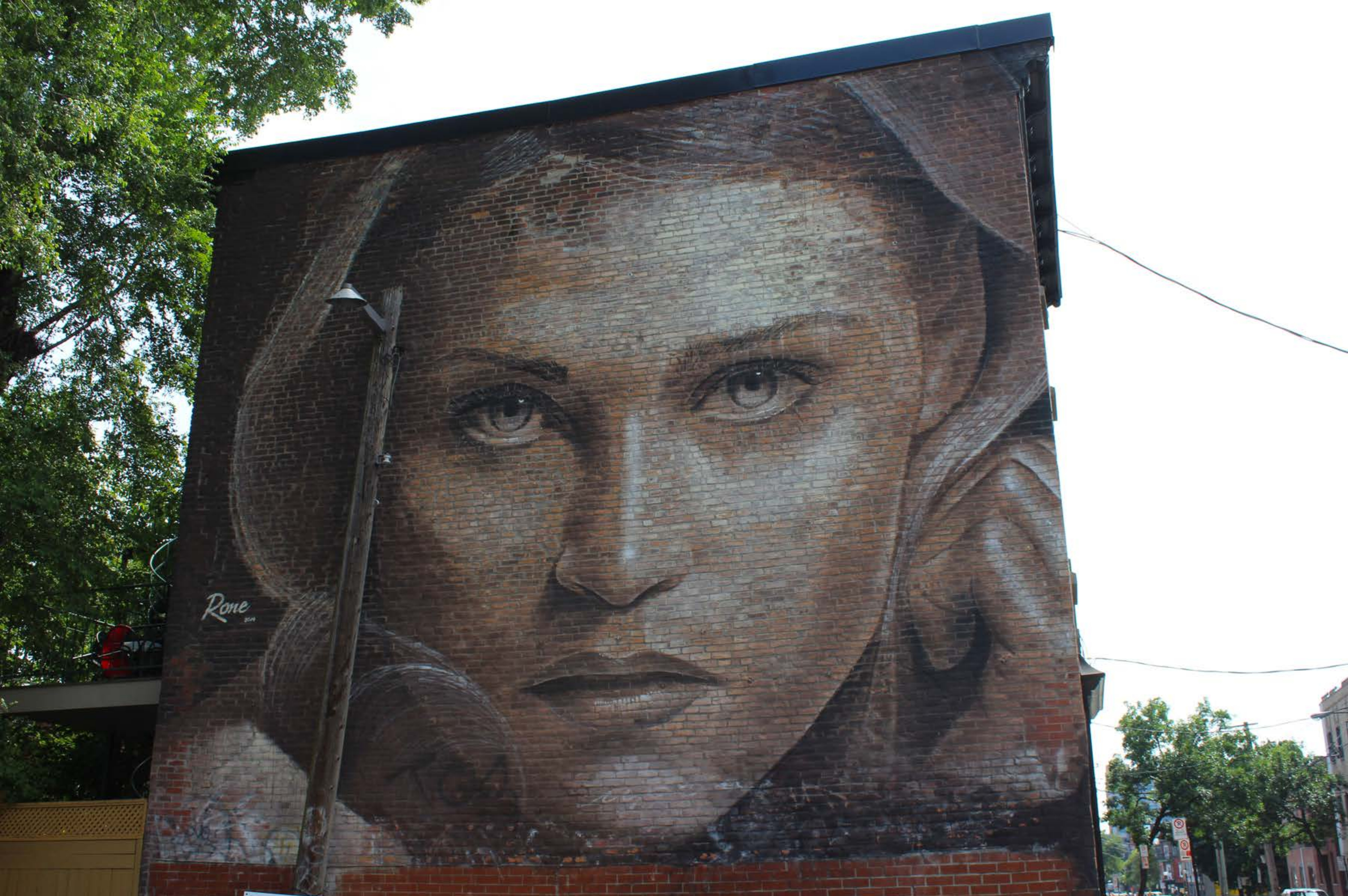
Rone, Australie, 2014 Emplacement / Location : Saint-Dominique / Napoléon et Roy