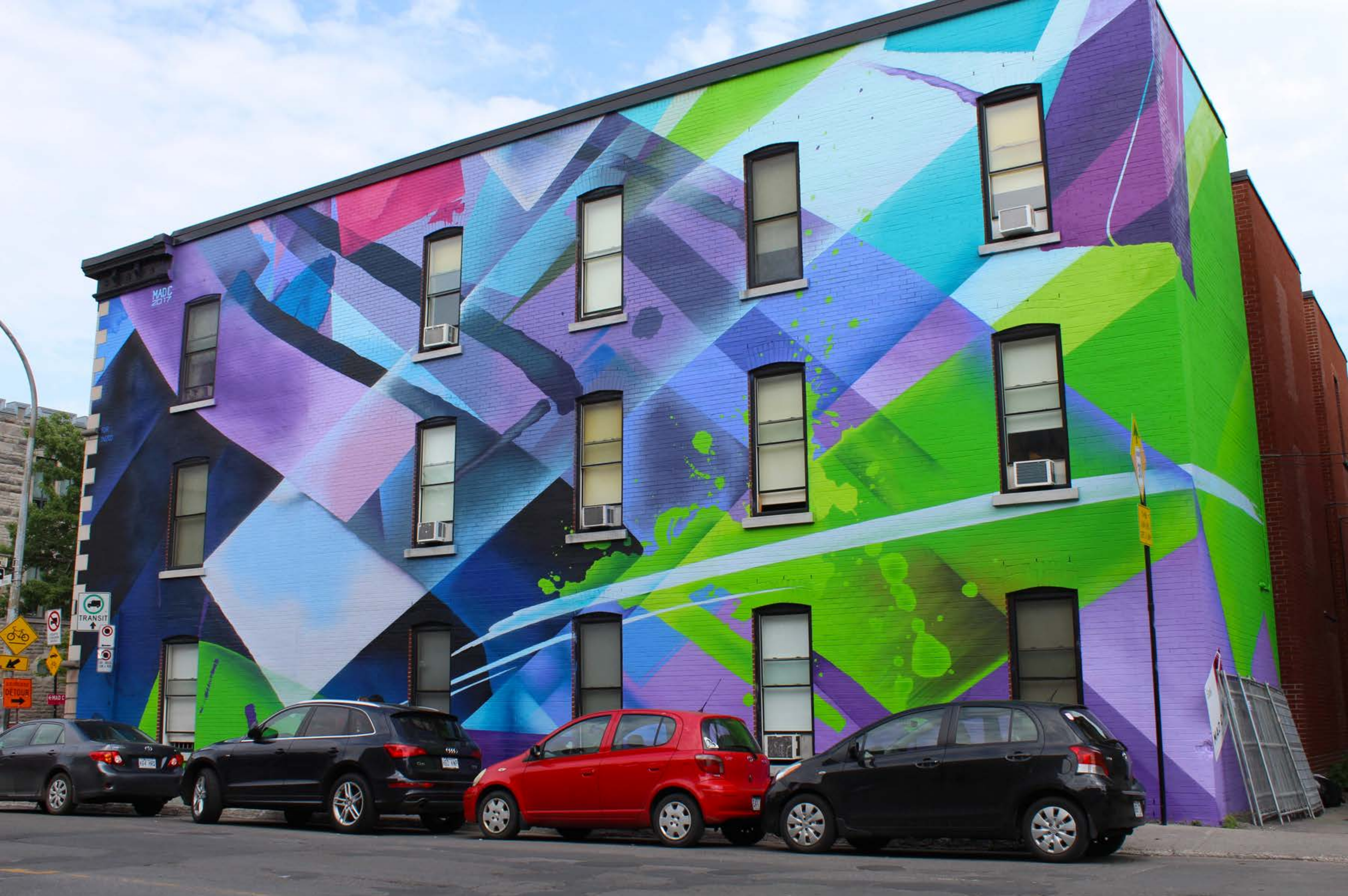
Mad C, Allemagne, 2017 Emplacement / Location : Av. des Pins / Laval