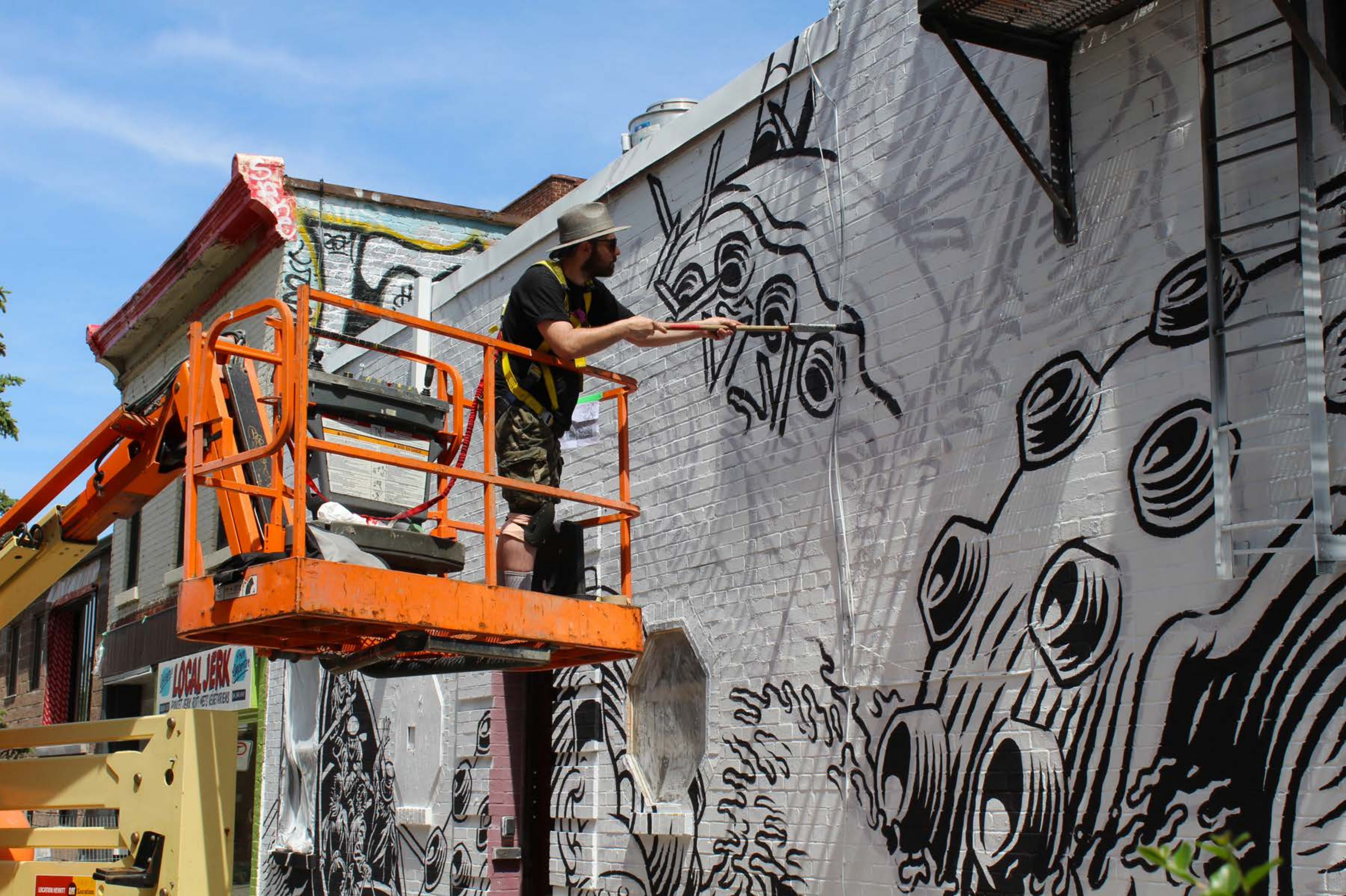
Jason Wasserman, Canada, 2017 Emplacement / Location : Duluth / Saint-Laurent