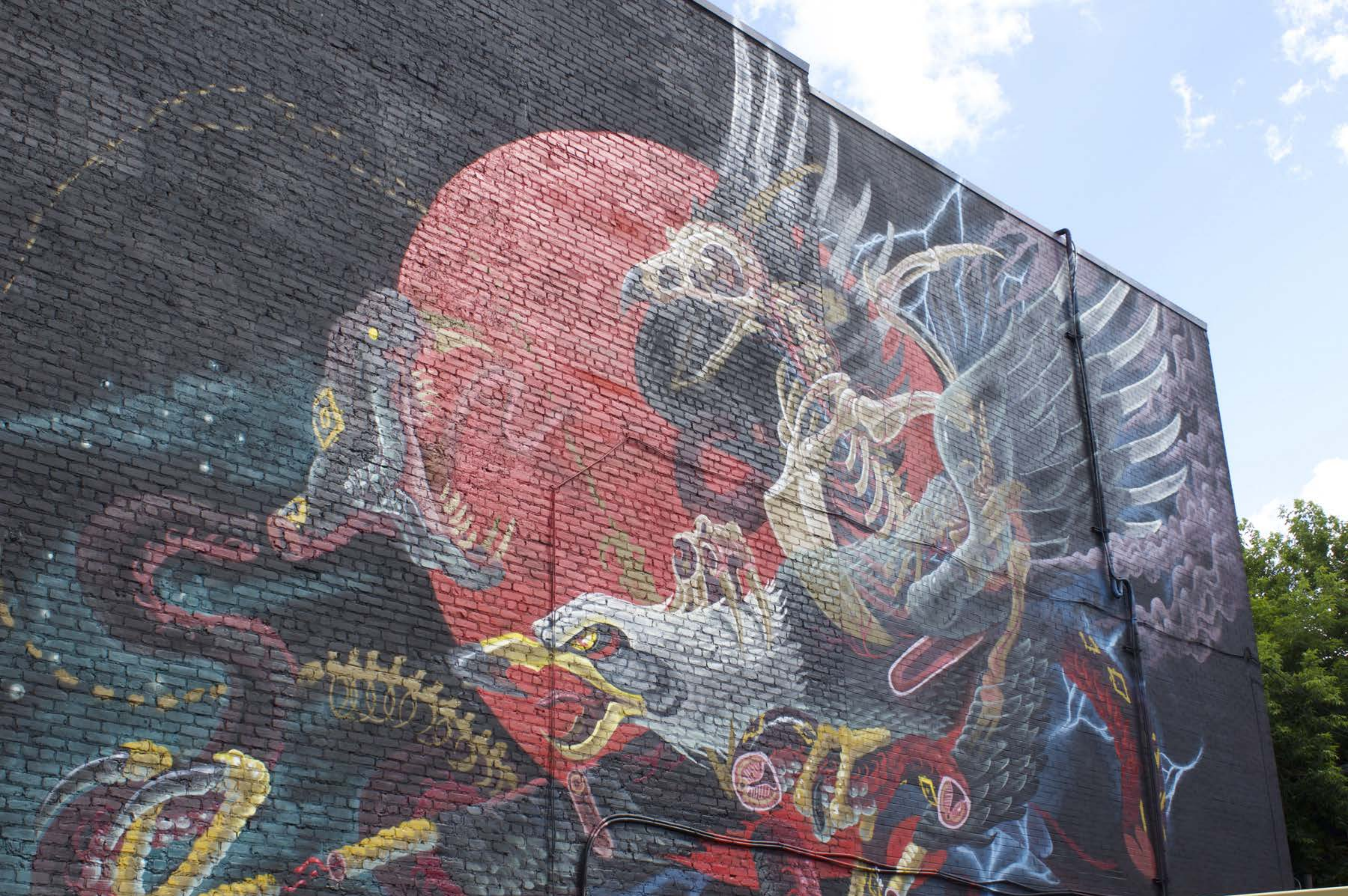
Nychos, Autriche, 2015 Emplacement / Location : Saint-Laurent / Saint-Cuthbert