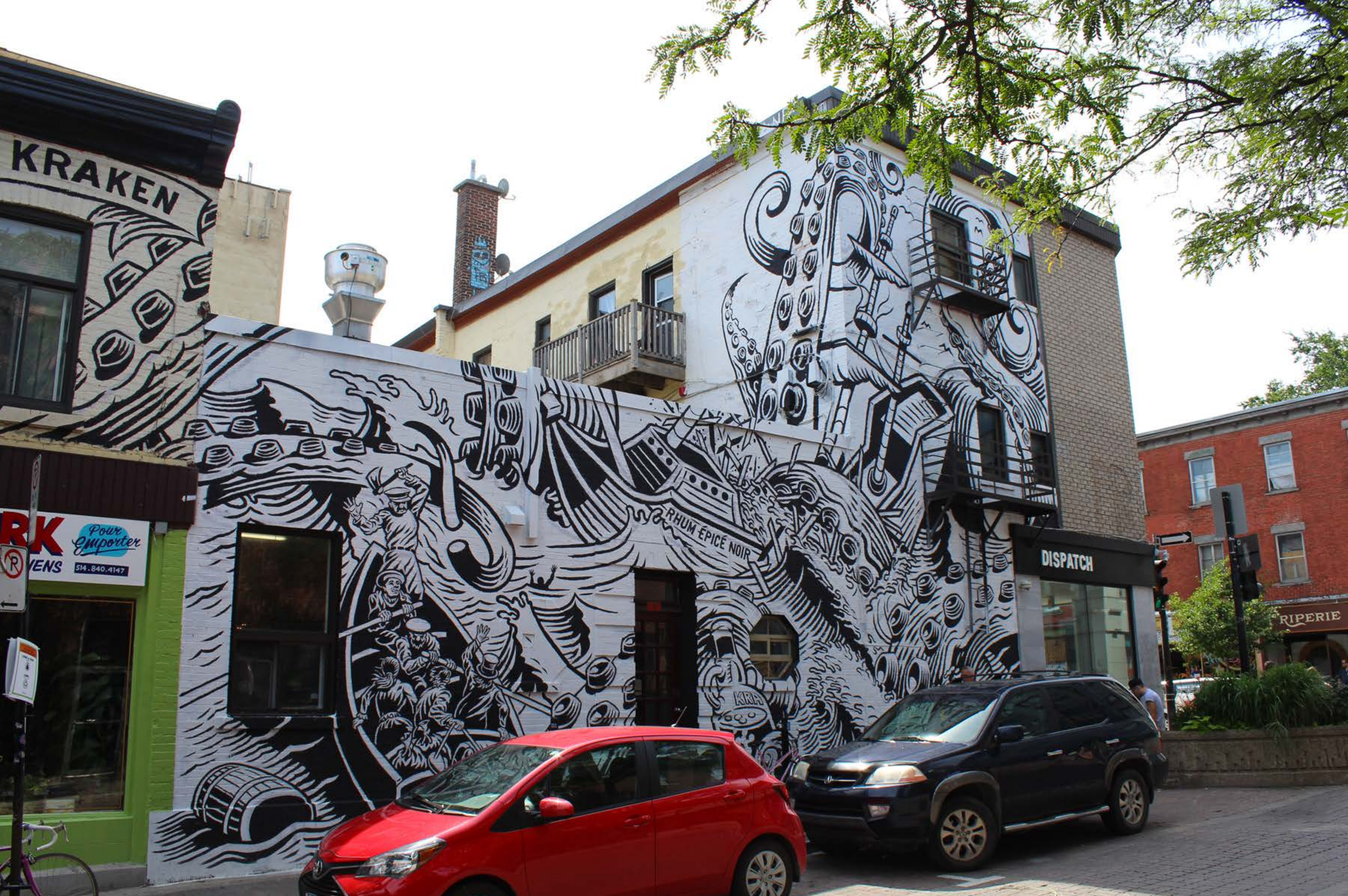
Jason Wasserman, Canada, 2017 Emplacement / Location : Duluth / Saint-Laurent