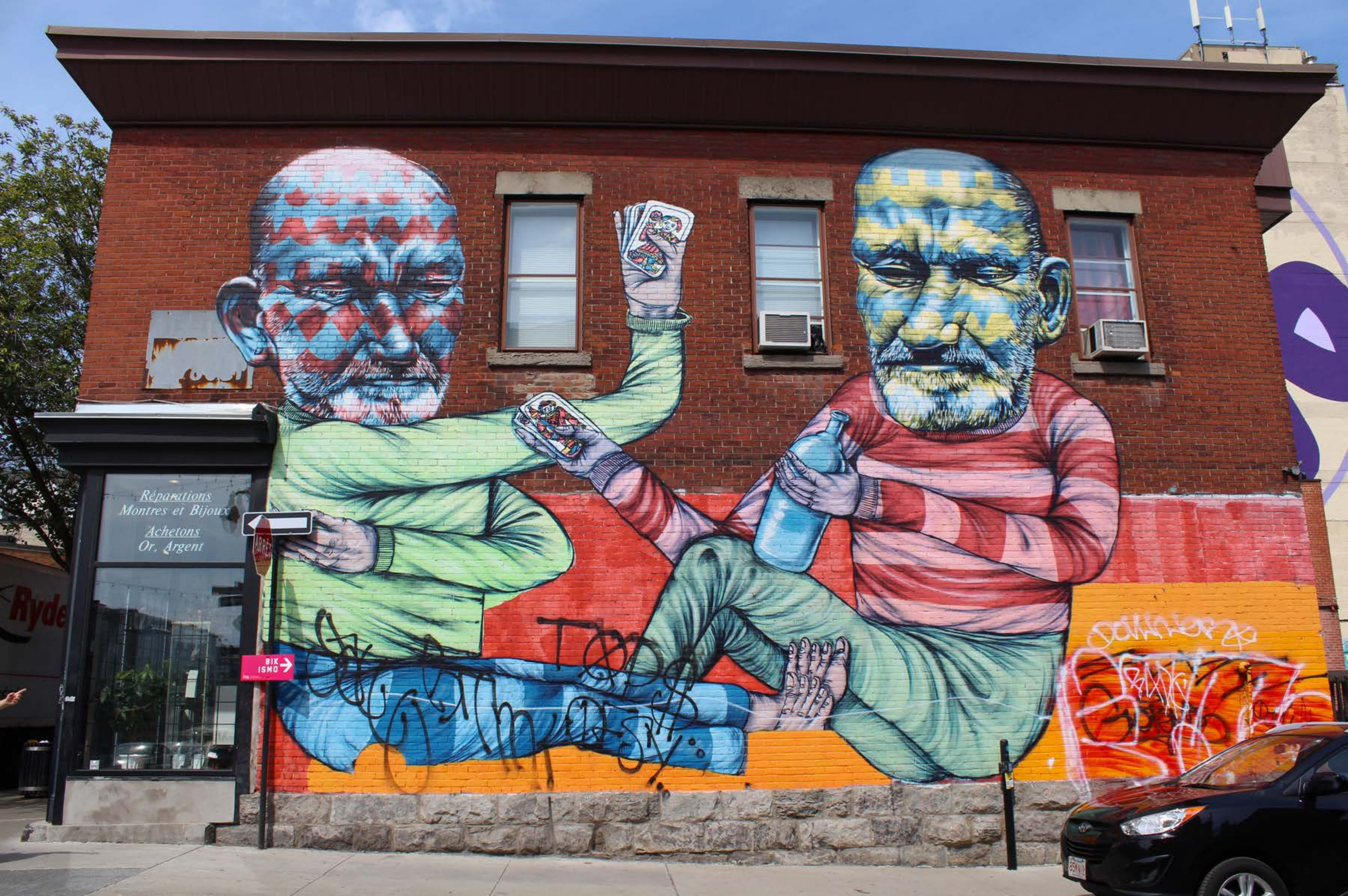
Other (Troy Lovegates), Canada, 2013 Emplacement / Location : Napoléon / Saint-Laurent