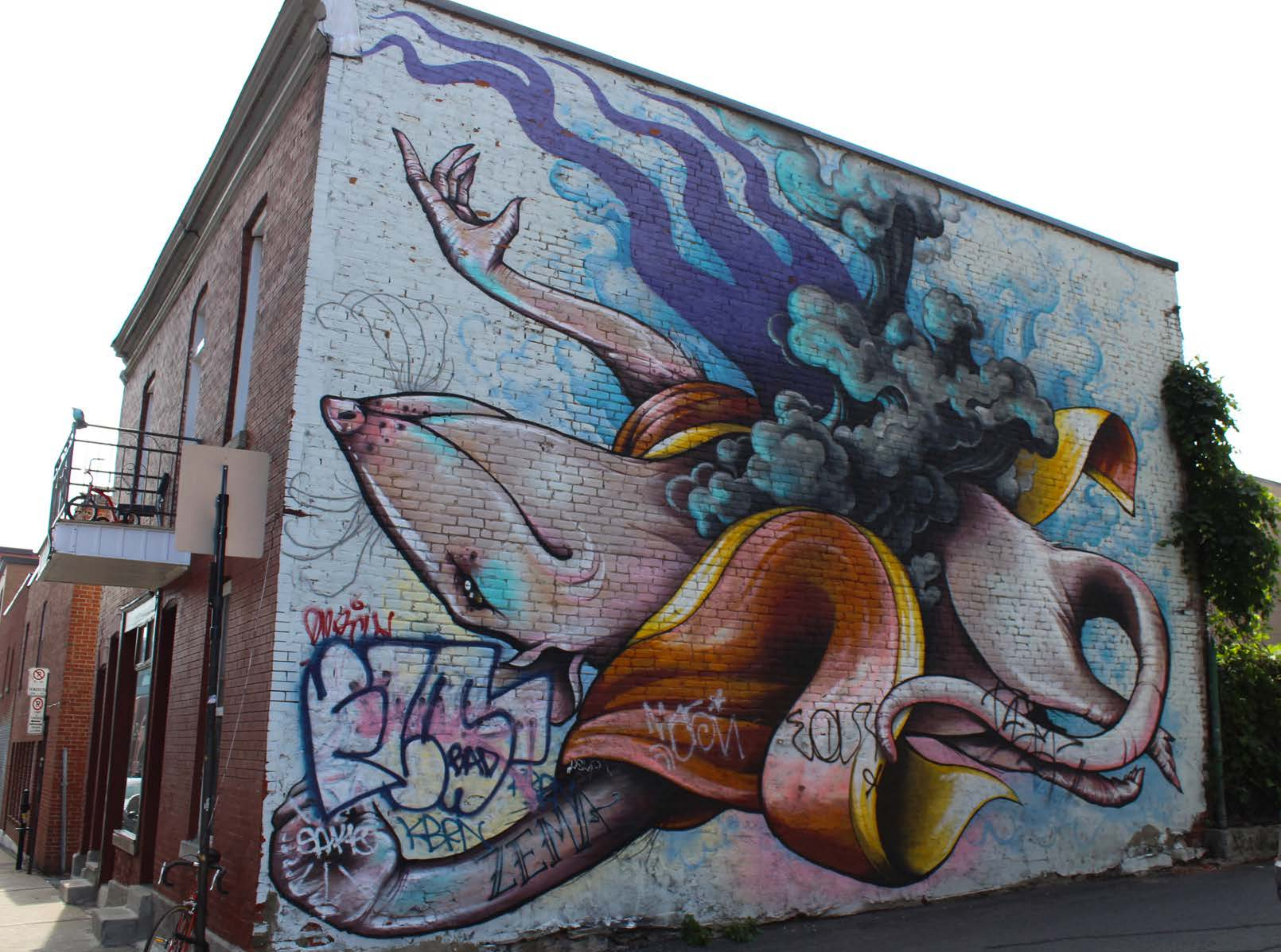
Zema, Canada, 2014 Emplacement / Location : Clark / Rachel