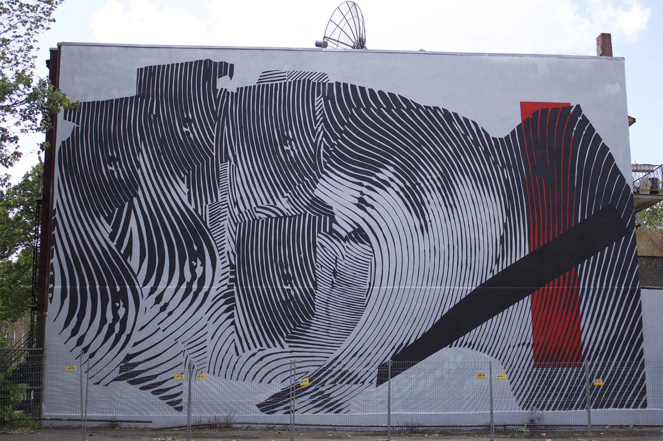
2 Alas, États-Unis, 2015 Emplacement / Location : Saint-Urbain / Mont-Royal