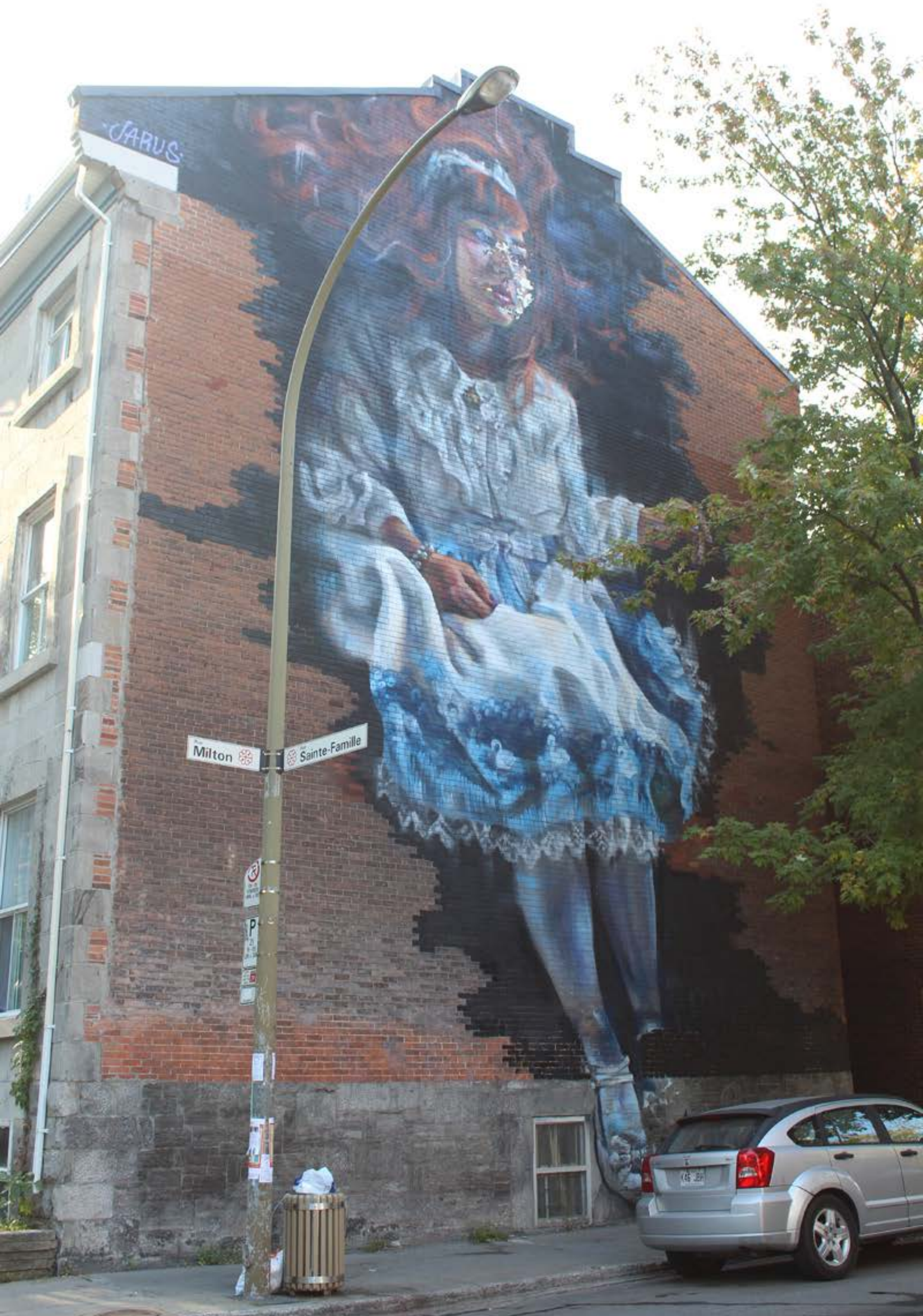
Jarus, Canada, 2015 Emplacement / Location : Milton / Sainte-Famille