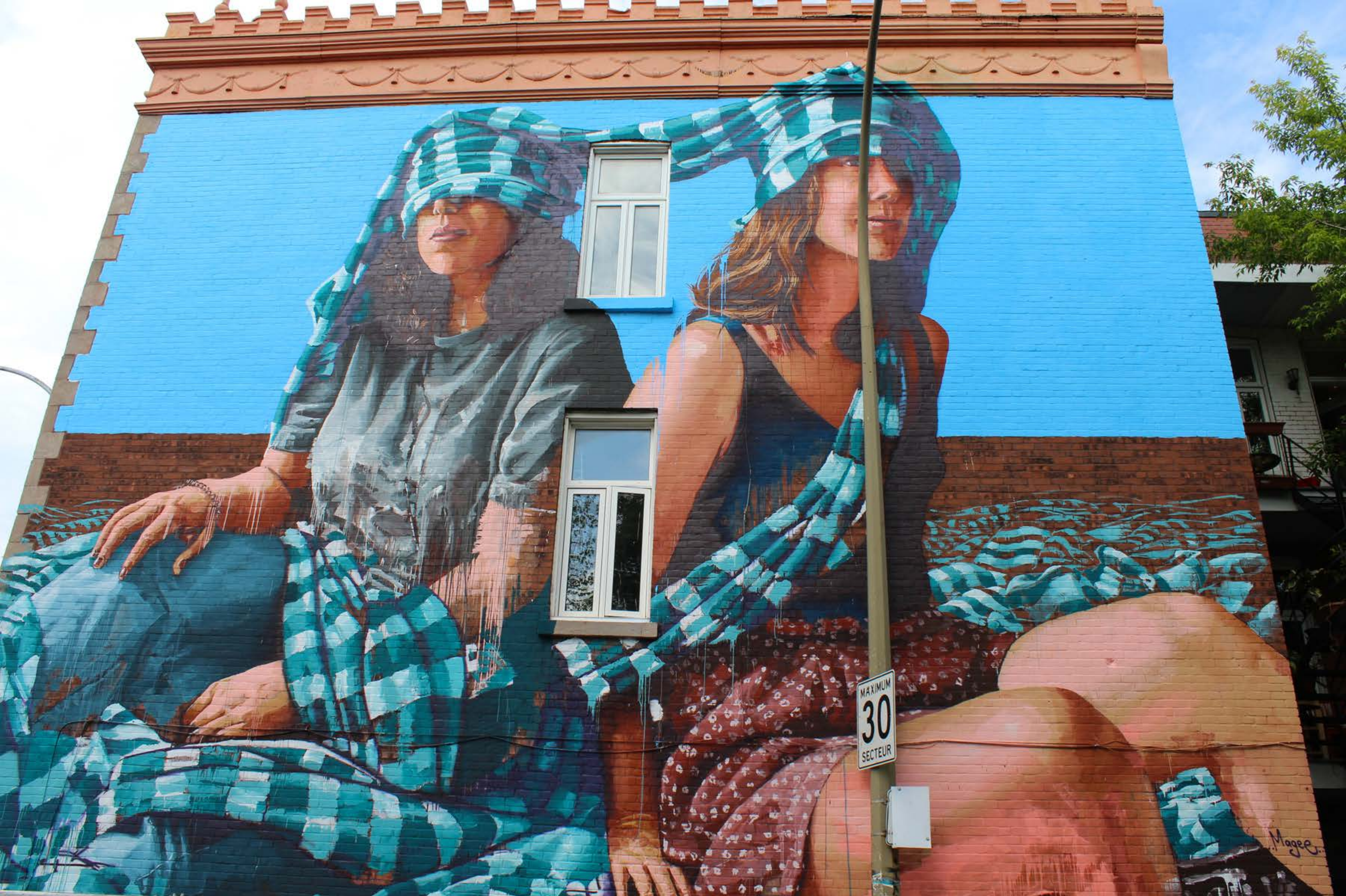
Fintan Magee, Australie, 2017 Emplacement / Location : Hotel-de-Ville / Av. des Pins