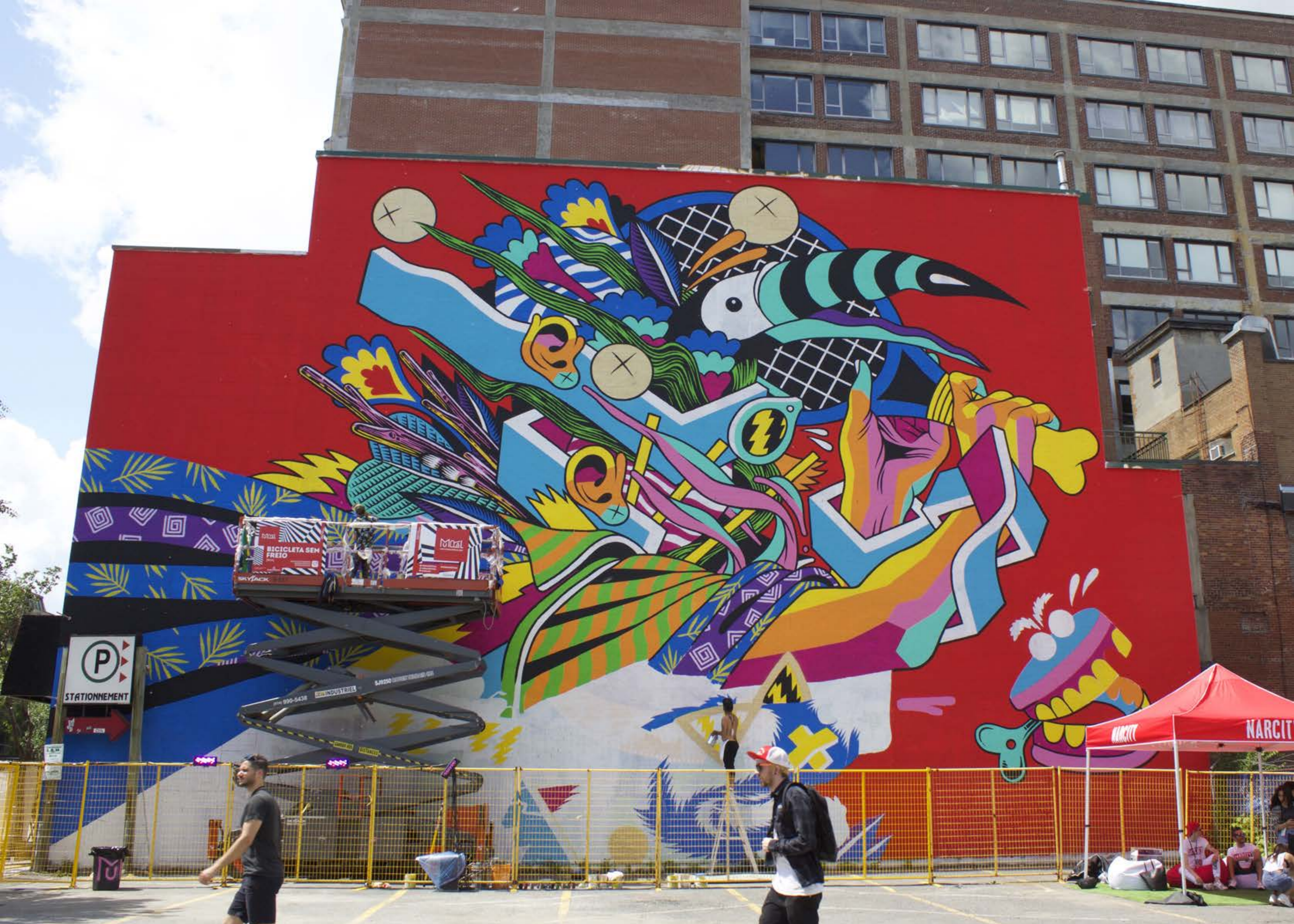
Bicicleta sem Freio, Brésil, 2015

Emplacement / Location : Saint-Laurent, entre Prince-Arthur et Milton