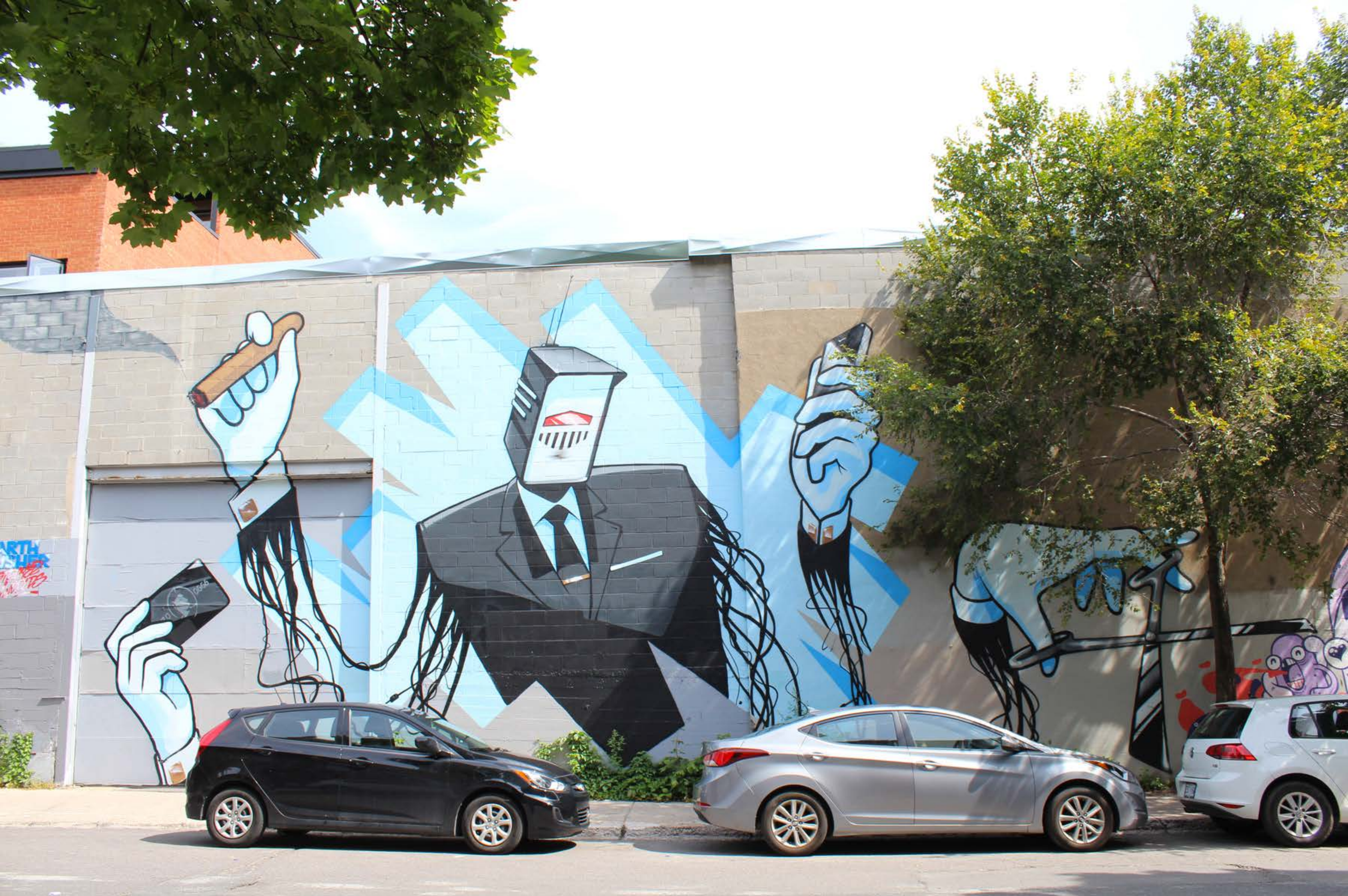
Earth Crusher, Canada, 2015 Emplacement / Location : Clark, entre Rachel et Duluth