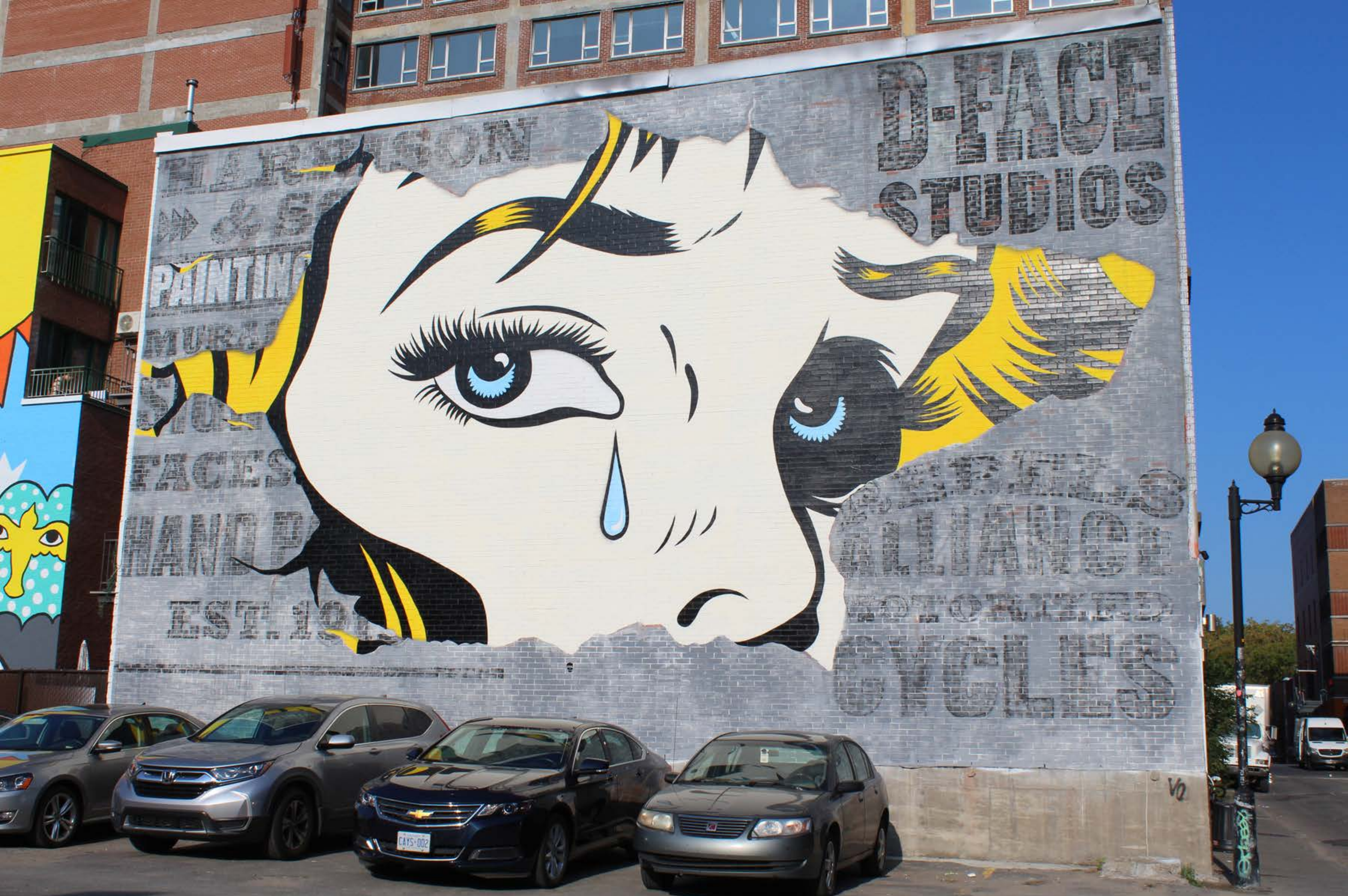
D*Face, Angleterre, 2016

Emplacement / Location : Saint-Dominique, entre Prince-Arthur et Milton