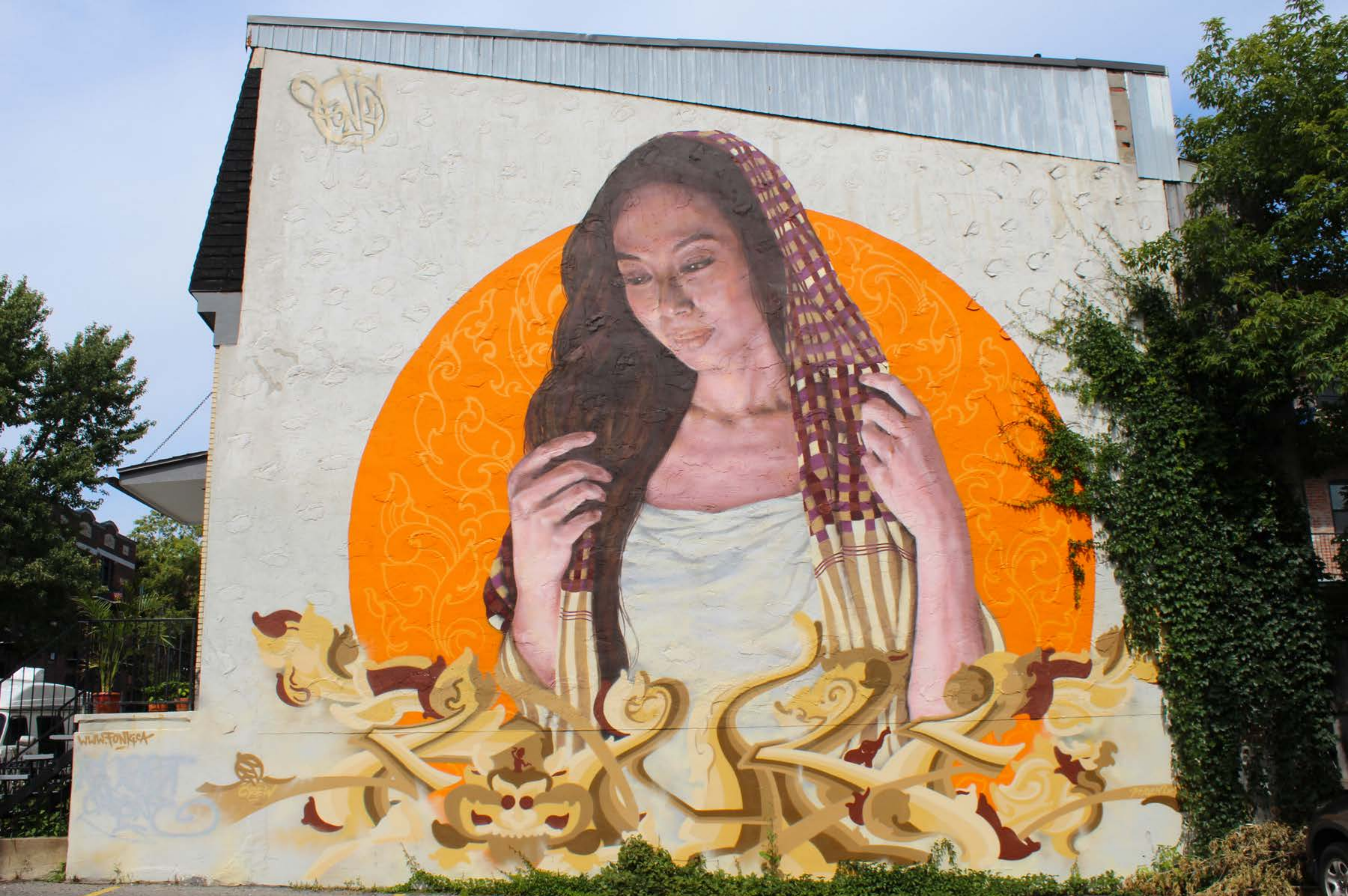
Fonki, Canada, 2016