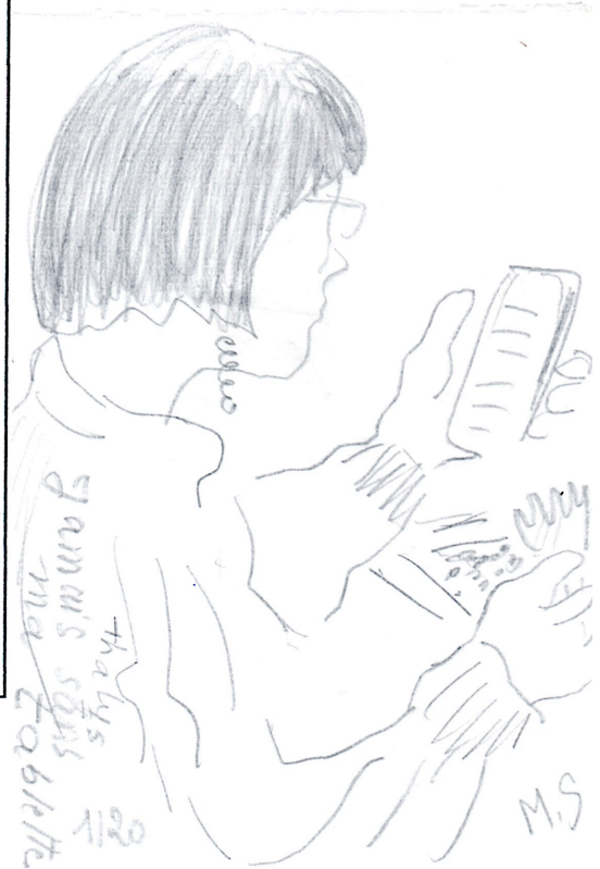
Une œuvre de Marcelle Simon, 13 Résidence Les Monts, 50000, Baudre, FRANCE