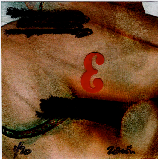
Un 8cm x 8cm de Miguel Jimenez/El Taller de Zenon, C/Santa Maria de Guia, 1-4oC, 41008, Sevilla, ESPAGNE