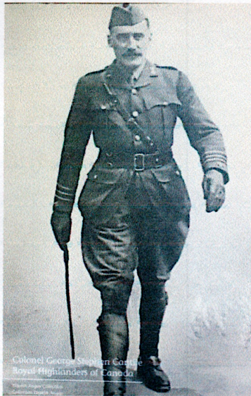
Le Colonel George Stephen Cantlie, auteur des lettres.