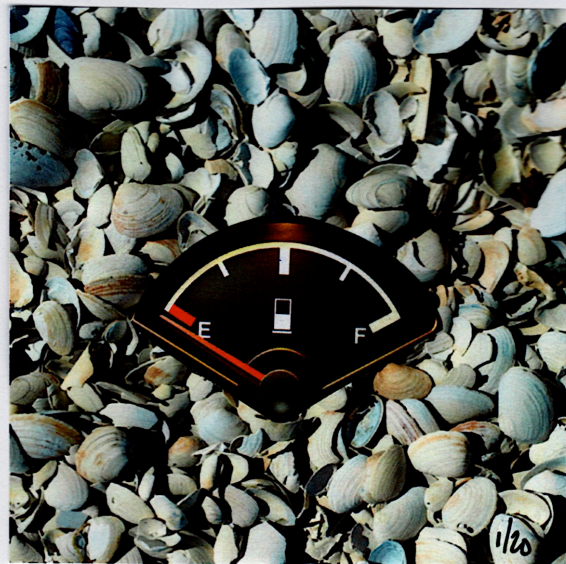
"Coquilles Vides / Empty Shells" Un 8cm x 8cm de: RF Côté, C.P 1 Sainte-Flavie (Québec), G0J 2L0, CANADA