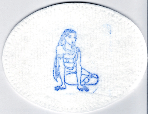
Une œuvre de: Piet Franzen/SIDAC, Leliestraat 94, 2313 BJ, Leiden, PAYS-BAS