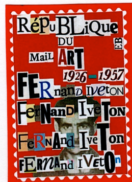
Un timbre d'artiste de Éric Bensidon, 14 rue Sauffroy, 75017 Paris, FRANCE