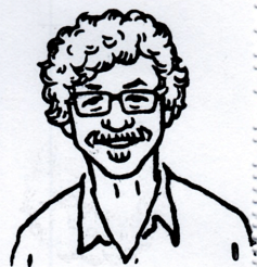
Un timbre d'artiste de John Held Jr., P.O. Box 410837, San Francisco, CA, 94141, USA

CULLA LAS NECESIDADES DEL HOMBRE LA EXPLOTACIÓN Y LA REPRESIÓN