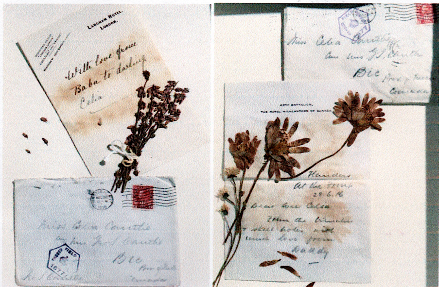
Deux lettres contenant des fleurs séchées expédiées d'Europe pendant la première Guerre mondiale par le Colonel George Stephen Cantlie à sa fille Celia. À noter que les lettres avaient été inspectées par la censure militaire (marque hexagonale mauve).