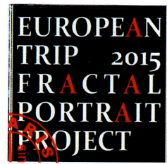
Un timbre d'artiste de Aristide 3108, 30 rue Louis Pasteur, 10120, Saint-André-les-Vergers, FRANCE