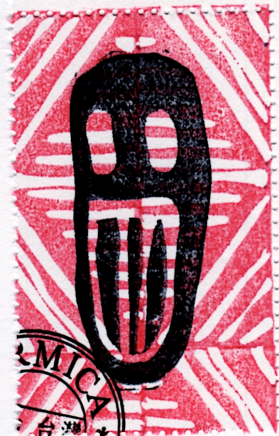
Un timbre d'artiste William Mellott, 5 Fl. No. 108-4, Yancheng Road, Tainan, 702, TAIWAN