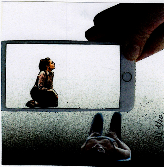
Un 8cm x 8cm de Bruno Sourdin, 13 Village de la Houssée, Saint-Samson-de-Bonfossé, 50750, Bourgvallées, FRANCE