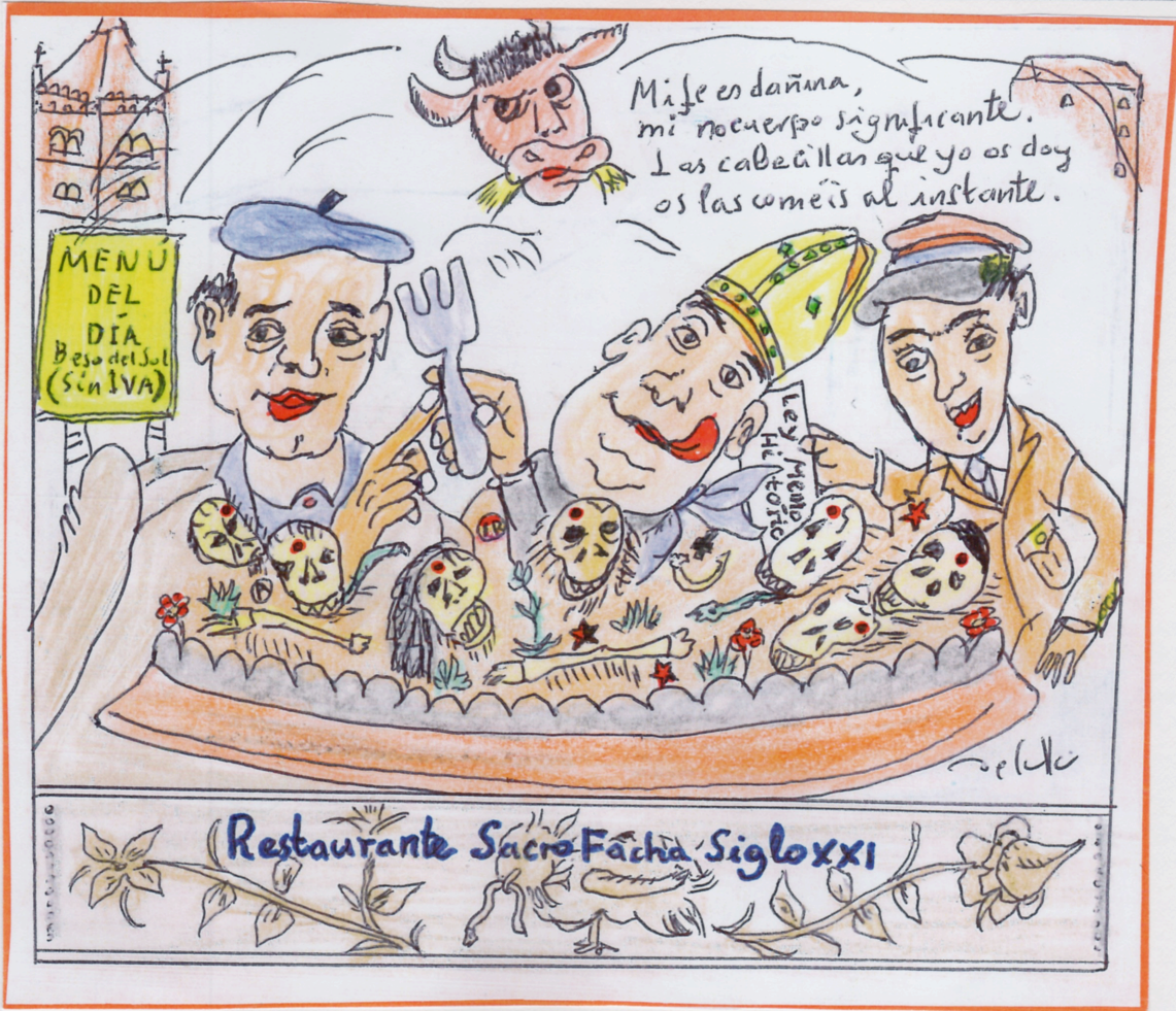
Une œuvre de Daniel de Culla, P Comuneros 7-1A, 09006, Burgos, ESPAGNE (incluant la vignette d'artiste à la page 8) page 4