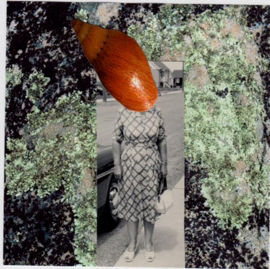
"Écouter la mer..." Un 8cm x 8cm de: RF Côté, C.P 1 Sainte-Flavie (Québec), G0J 2L0, CANADA