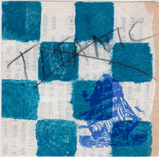
Un 8cm x 8cm de Christian Alle / Nada-Zéro, 9 rue du Pré de la Mer, 50460, Urville-Nacqueville, FRANCE