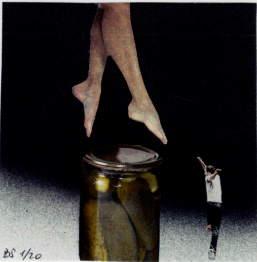
Un 8cm x 8cm de Bruno Sourdin, 13 Village de la Houssée, Saint-Samson-de-Bonfossé, 50750, Bourgvallées, FRANCE