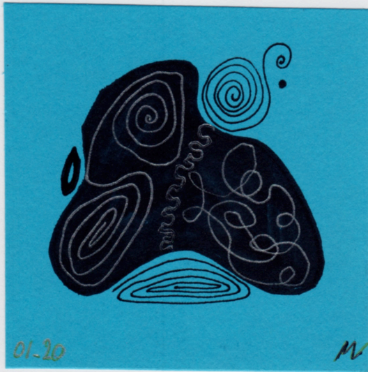
Un 8cm x 8cm de Magda Lagerwerf, Weenderstraat 23, 9551 TJ, Sellinger, PAYS-BAS

Un timbre d'artiste de Serse Luigetti, C.P N. 227 Ufficio Perugia Centro, Piazza Matteotti 1 06100, Perugia, ITALIE