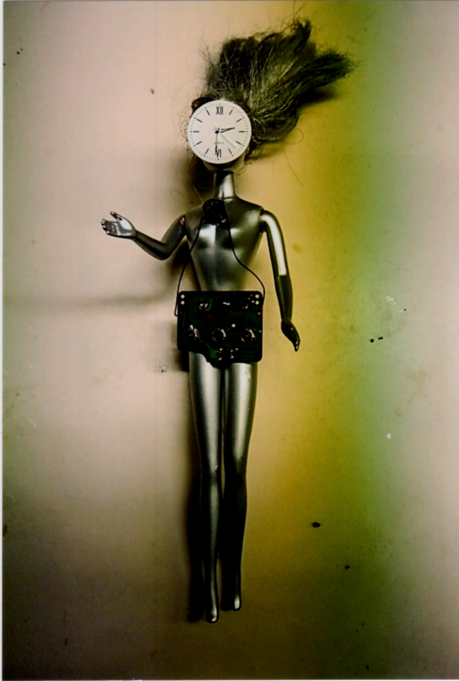
"From the serie Alienated Barbies"

Une œuvre de Henk J. Van Ooyen, Vlinderveen 258, 3205 EJ, Spykenisse, PAYS-BAS