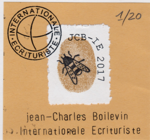
Un 8cm x 8cm de Jean-Charles Boilevin / Internationale Écriviste, 7 rue des abeilles, 37250, Montbazon, FRANCE