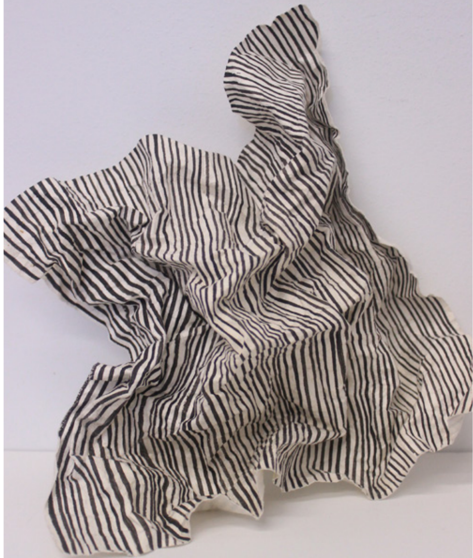
Pavitra Wickramasinghe, Murmur (détail), 2022