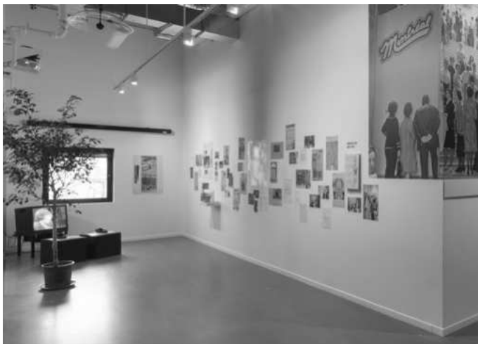
Vue de l'exposition Créer à rebours vers l'exposition : le cas « Montréal, plus ou moins ? », VOX, 1972-2018.

mentionne avoir eu au préalable des entretiens avec des intervenants de deux musées américains qui avaient présenté des projets similaires : « Back Bay Boston, the City as Work of Art », au Museum of Fine Arts à Boston en 1969, et « City », au Philadelphia Museum of Art. Le thème de la ville était aussi récurrent dans la programmation du Museum of Modern Art (MoMA) de New York qui, depuis les années 1950, organisait régulièrement des expositions consacrées à des architectes et à des photographes. Quelques années plus tard, c'était au tour du Centre Pompidou à Paris de mettre sur pied une série de grandes expositions, orchestrée par Pontus Hulten : « Paris – New York », en 1977, « Paris – Moscou », en 1979, et « Paris – Berlin », en 1978. Outre leur thématique commune, ces expositions partagent une vision interdisciplinaire, où se côtoient la peinture, la sculpture, la photographie, l'architecture