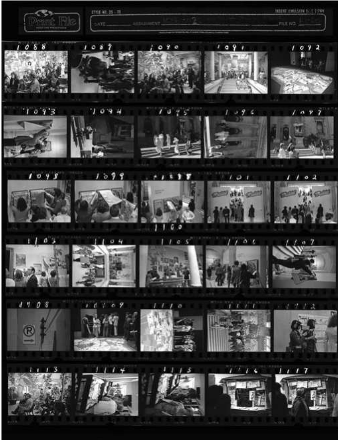
Planches-contacts de vues de l'exposition « Montréal plus ou moins? », prises durant le vernissage.

points de vue ainsi qu'à abolir les hiérarchies artistiques et sociales. Présenter le quotidien de la rue et de la ville ainsi que les débats qui avaient cours sur la destruction du patrimoine urbain ont fait en sorte que des objets et des documents qui ne sont pas destinés à être exposés dans un contexte artistique se sont retrouvés dans