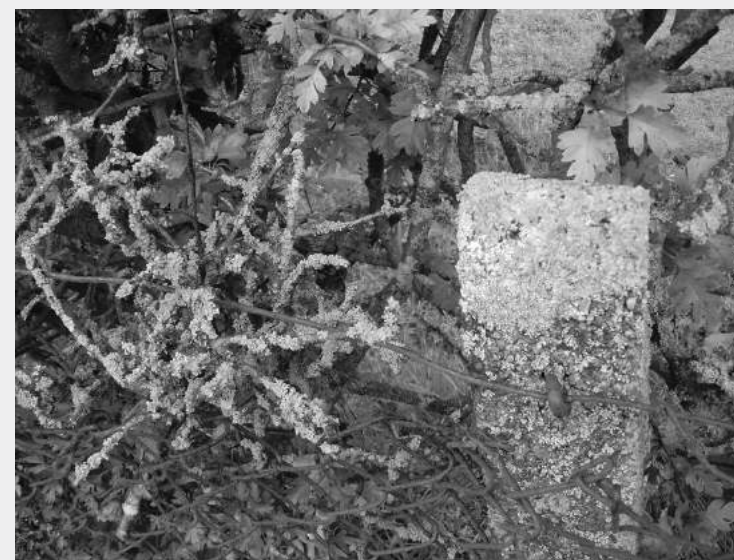
Lichens, Carlisle, Royaume-Unis.